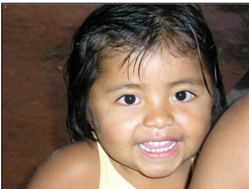
Figura 13 - Criança indígena Terena.