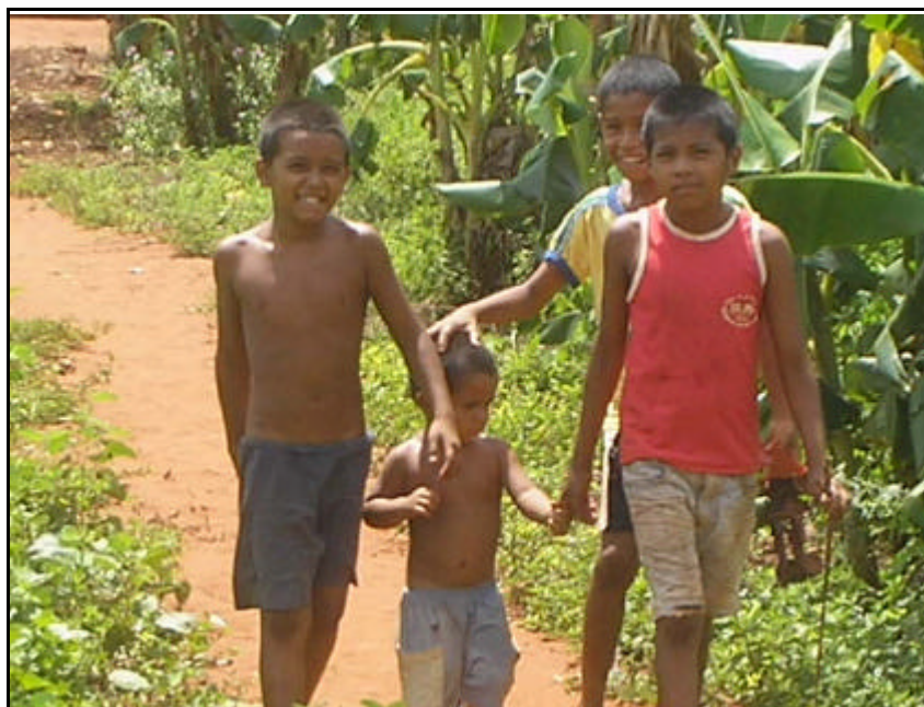
Figura 10 - Crianças Terena na Aldeia Cabeceira.

O índio Terena tem como base para sua educação o exemplo, passado de geração em geração, não sendo esquecido no passar dos séculos, pois quando a linguagem se dirige aos outros membros da comunidade, o pensamento torna-se passível de partilha. Essa acessibilidade do pensamento manifesta-se, na e pela linguagem, expressando, ao mesmo tempo, muitos outros aspectos culturais.