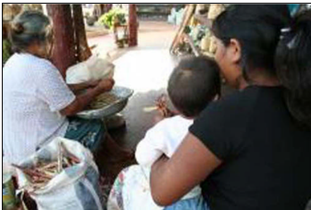
Figura 5 - Mulheres da Aldeia Água Bonita/Campo Grande/MS.