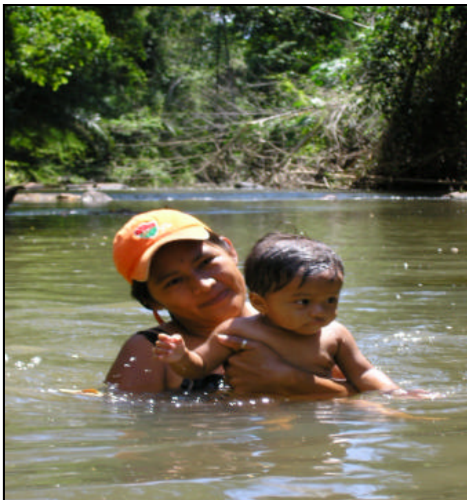
Figura 7 - Mãe e criança Terena da Aldeia Água Branca.