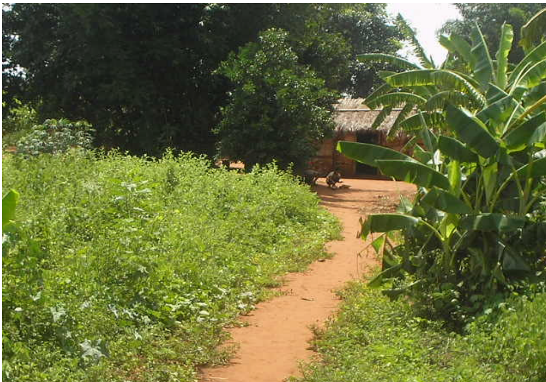
Figura 2 - Residência Terena/Aldeia Cabeceira/PIN - Nioaque/MS.