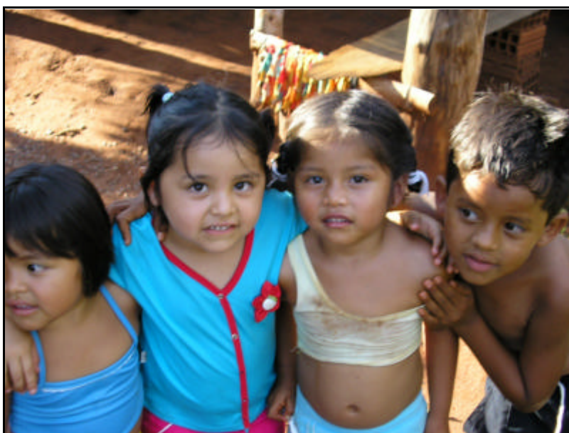
Figura 14 - Crianças indígenas/Aldeia Cabeceira.