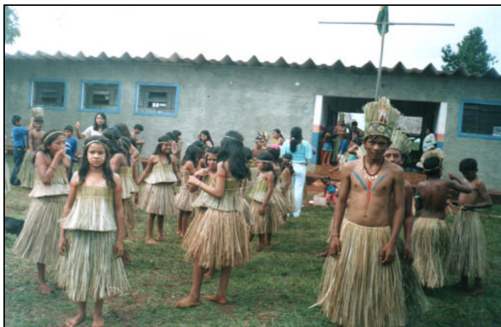
Figura 11 - Crianças Terena se preparando para apresentação da Dança do Bate Pau e do Putu-Putu.

Desde então, iniciou-se um processo de construção e valorização cultural dentro das práticas pedagógicas numa tentativa de superar o processo de dominação, em busca de uma escola indígena autônoma, onde “a representação da diferença não deve ser lida apressadamente como o reflexo de traços culturais ou étnicos preestabelecidos, inscritos na lápide fixa da tradição” (BHABHA, 2005, p. 20), mas como contribuição para fortalecer a cultura.