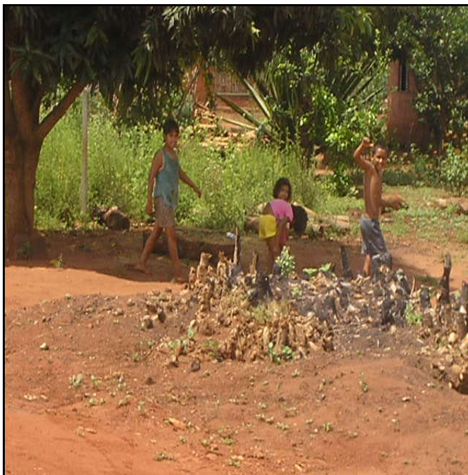
Figura 6 - Crianças Terena da Aldeia Cabeceira.