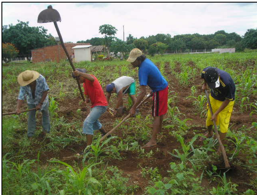
Figura 9 - Homens trabalhando na roça.