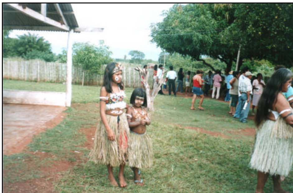
Figura 15 - Crianças Terena na extensão Capitão Vitorino/Aldeia Água Branca.

A atitude do aluno é de fazer com que o colega reflita sobre suas ações, que elas têm conseqüências muitas vezes dolorosas perante a turma, pois existe a possibilidade de não ser convidado para participar de nenhum grupo para realizar seus trabalhos escolares. Por outro lado existe a figura do professor indígena, que analisa a partir de suas ambivalências: professor, tio, primo, pai, sobrinho, afilhado, da educação indígena, onde “sempre há um deslize inevitável do significado da semiose aberta de uma cultura, enquanto aquilo que parece fixo continua a ser dialogicamente reapropriado” (HALL, 2006, p. 33).