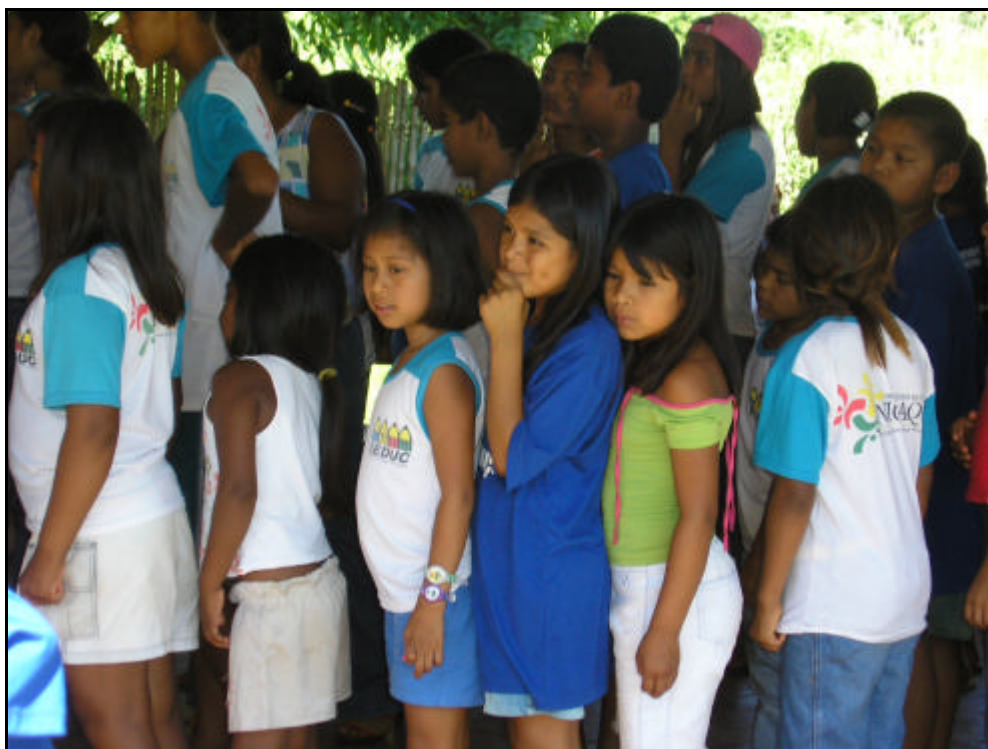
Figura 12 - Crianças Terena na extensão Capitão Vitorino/Água Branca/PIN Nioaque/MS.

Fonte: Acervo do professor Gilson, 2006.