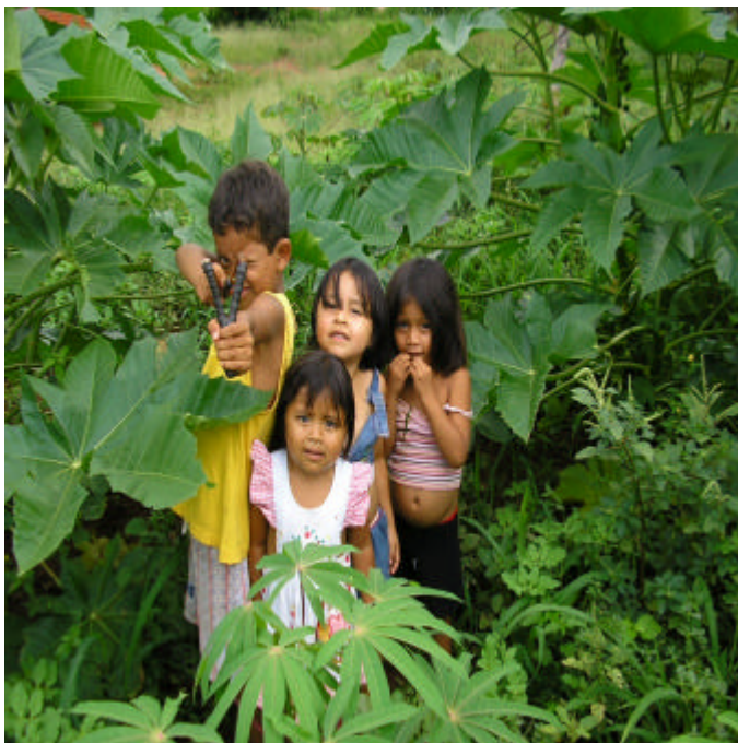
Figura 8 - Crianças Terena - Aldeia Água Branca.