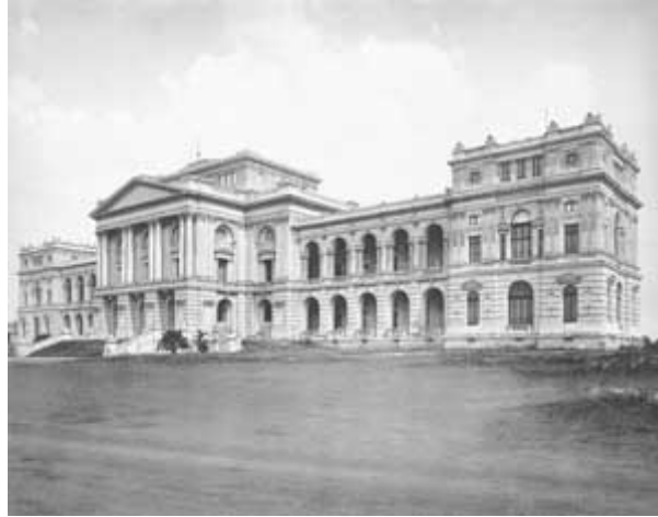
Figura 4 - Museu Paulista em 1902. Acervo do Museu Paulista Fonte: www.aprenda450anos.com.br/450anos/vila_metrop...

Segundo Witter (1999), o acervo do Museu Paulista teve sua origem na coleção do Coronel Joaquim Sertório, que incluía peças de espécimes de História Natural e peças de interesse etnográfico e histórico. Essa coleção foi adquirida pelo Conselheiro Francisco de Paula Mayrink, que juntamente com objetos da coleção Pessanha foi posteriormente doada para o Governo do Estado.