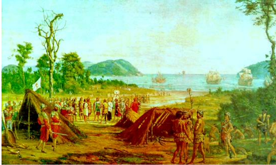
Figura 2 - A fundação de São Vicente – Benedito Calixto. Acervo do Museu Paulista Fonte: br.geocities.com/caminhosdomar/Goianases.htm

da visão de Calixto em relação ao tema de sua obra na época em que foi produzida, ou seja, é uma reconstrução do imaginário da época.