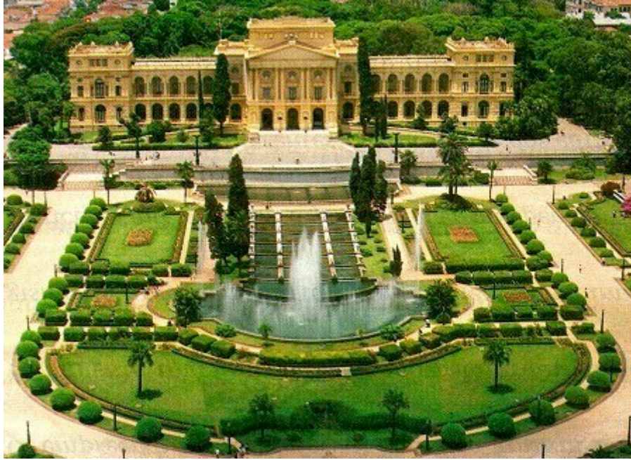
Figura 6 - O Museu Paulista e seu jardim

O Museu Paulista, no âmbito da gestão e organização de seu acervo, criou três departamentos responsáveis pela curadoria de cada tipo de coleção, o Serviço de Objetos, o Serviço de Iconografia e o Serviço de Arquivística. Estaremos nos restringindo ao trabalho realizado pelo Serviço de Objetos, responsável pela curadoria do acervo de tridimensionais.