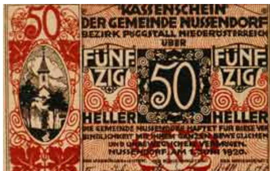
Figura 7- Dinheiro de emergência.

Na sublinha 2 – Formas alternativas de dinheiro , a situação política e econômica, a organização da sociedade, os atributos de valores em diferentes períodos, são alguns aspectos que podem ser verificados por meio das formas alternativas de dinheiro. Neste grupo encontram-se os vales, os bilhetes de trens e bondes, as fichas de controle de entrada e saída, os carimbos, ilustrados nas figuras 7 e 8.