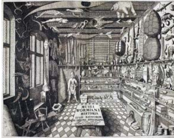
Figura 1 - Frontispício do Musei Wormiani Historia mostrando o quarto das maravilhas de Worm

No século XVIII, encontramos dois tipos de museus: os didáticos, ilustrados ou “museus da razão” e os patrimoniais, preservacionistas ou “museus da culpa”. A acumulação de obras de arte era símbolo de riqueza e saber: nessa época fundaram-se importantes museus de arte e história natural. A ordenação sistemática é requisito para a publicação dos catálogos, as grandes coleções foram reorganizadas e separadas por seções segundo suas especialidades, criaram-se galerias 6 de arte, escolas de desenho e academias. Surgem as exposições temporárias e a noção de arte acessível a todo tipo de público. Quanto à documentação das coleções, novos princípios de disposição foram criados nas galerias de arte, houve a popularização dos inventários e guias, surgem os primeiros métodos de documentação manual para fichas, sistematização, identificação e guias. Foi produzida uma variedade de inventários e catálogos ilustrados, no caso das pinacotecas as ilustrações são acompanhadas por um texto indicando a localização, o autor e as dimensões do quadro. Neste sentido, Torres (2002, p. 137, tradução nossa) sintetiza as grandes mudanças ocorridas: