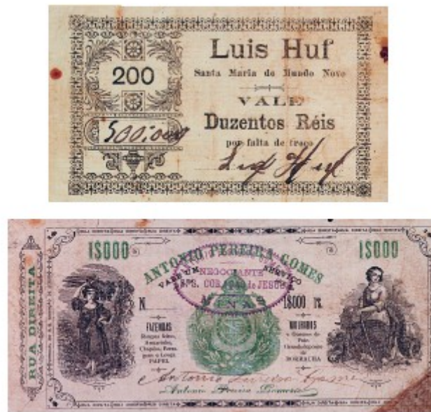
Figura 8 - Vales. Acervo do Museu Paulista Fonte: www2.uol.com.br/historiaviva/noticias/museu_d...

A sublinha 3 – Cultura visual no século XIX: museus, exposições industriais e cidades , avalia os seguintes aspectos: