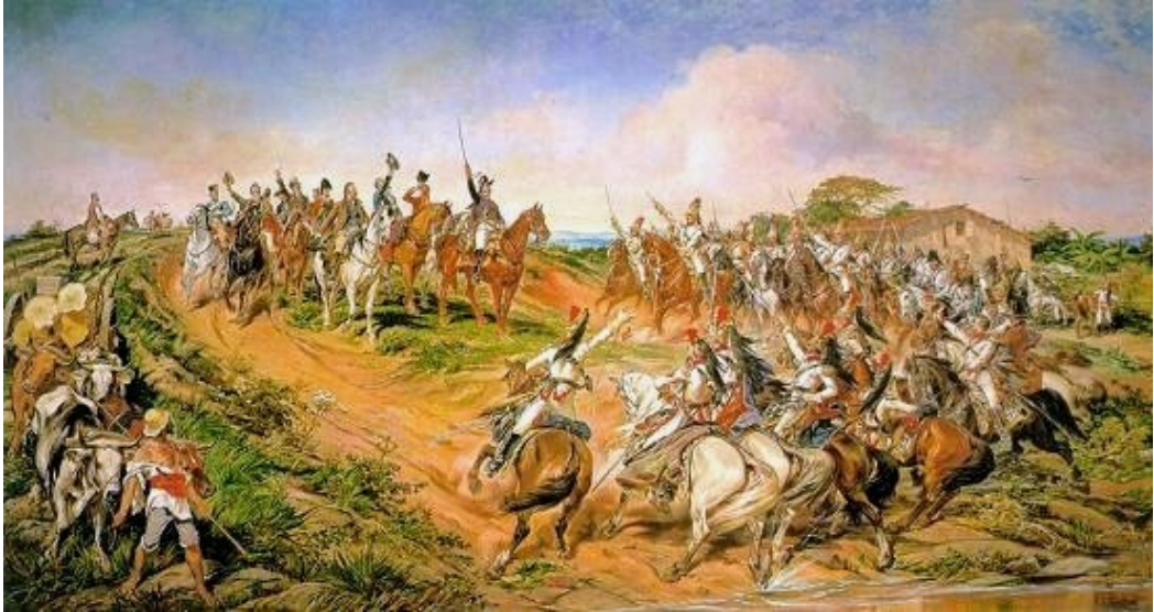
Figura 5 - Independência ou morte, 1888.

Na figura 5, podemos ver a famosa tela de Pedro Américo, Independência ou morte.