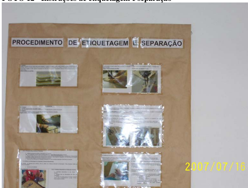
FOTO 12 - Instruções de etiquetagem e separação

A fim de estabelecer um padrão para agilizar o processo de etiquetagem das peças recém saídas do corte, a empresa adotou uma espécie de mural no qual são expostas as operações a serem realizadas.