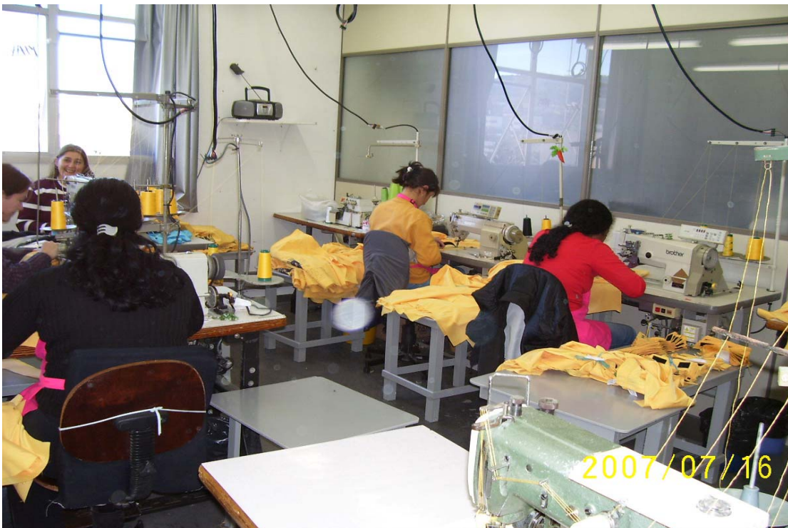
FOTO 02- Costureiras trabalhando -2007