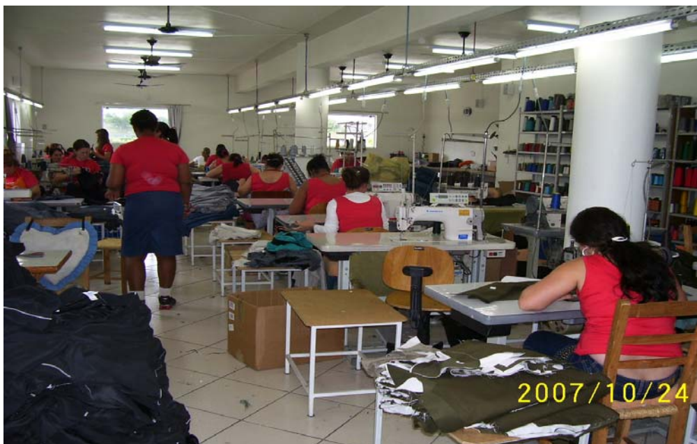
Fonte: Pesquisa de campo 2007.

A multifuncionalidade ampliou as exigências sobre o trabalho e os trabalhadores. Nesta direção, do campo empírico trouxemos uma síntese dessas exigências: