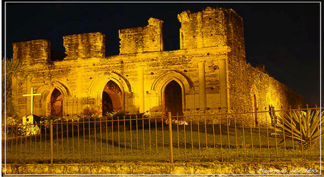
Figura 1. Igreja de Alagoínhas Velha, Alagoínhas -BA.

A origem do nome de Alagoínhas deveu-se à existência de uma bacia de águas límpidas e refrescantes que ficou denominada como “Fonte dos Padres” e de várias lagoas e córregos nas proximidades, que levou a região a receber o nome de Lagoínha. Uma das maiores riquezas do município é a excelência da qualidade de sua água, que faz parte do aquífero que vai de Dias D'Ávila até Tucano.