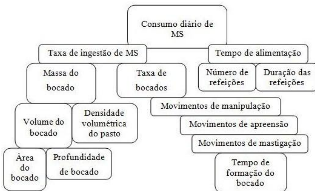
Figura 1: Componentes do comportamento ingestivo de animais em pastejo (Adaptado de Carvalho, 1997).

Considerando-se uma escala a partir da massa do bocado, podemos determinar a taxa de ingestão de MS em um determinado tempo. Associando esse valor ao tempo diário de alimentação, é possível calcular o consumo diário de MS de um animal em pastejo (Figura 1).