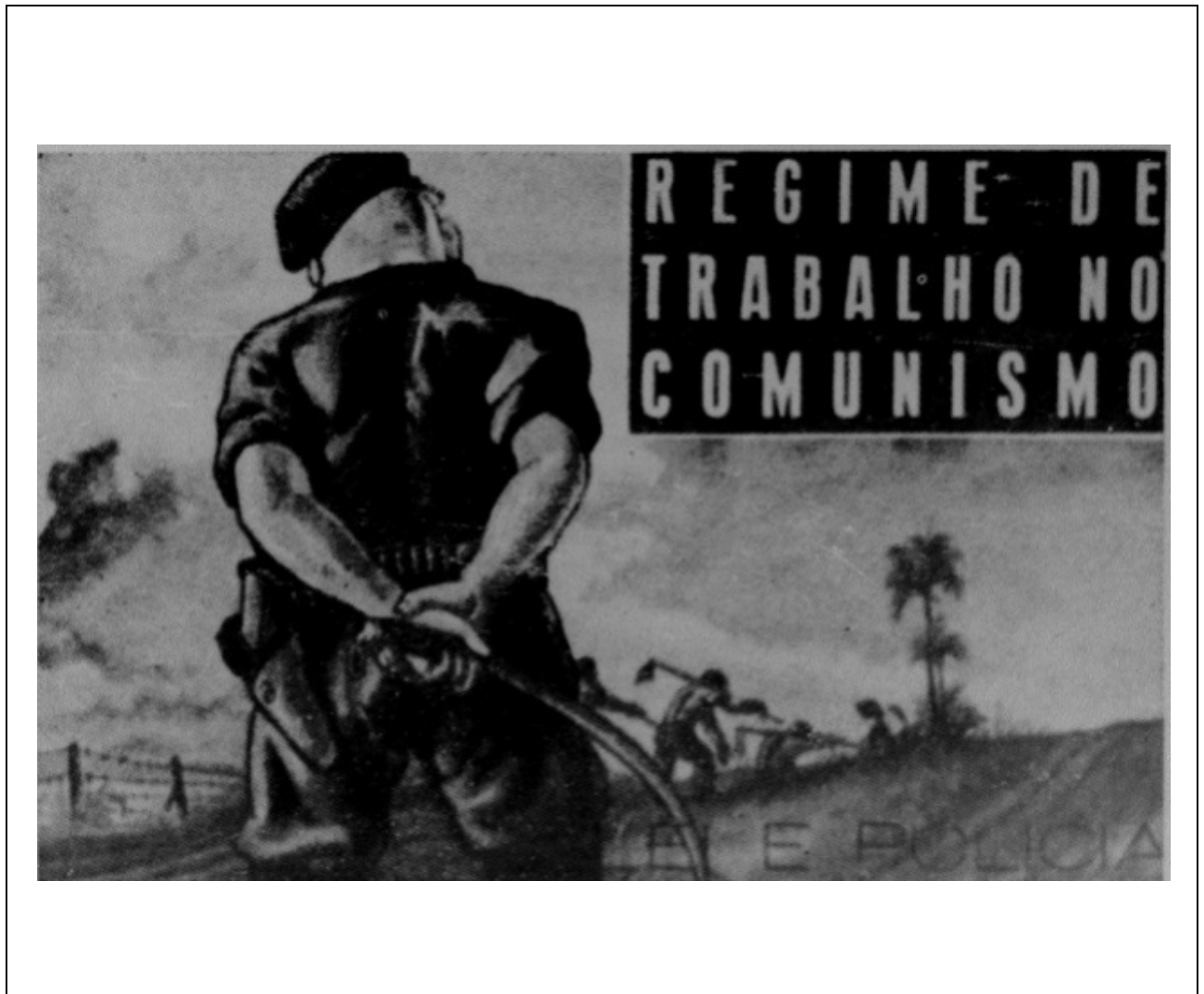
QUADRO 3 - Regime de trabalho no comunismo