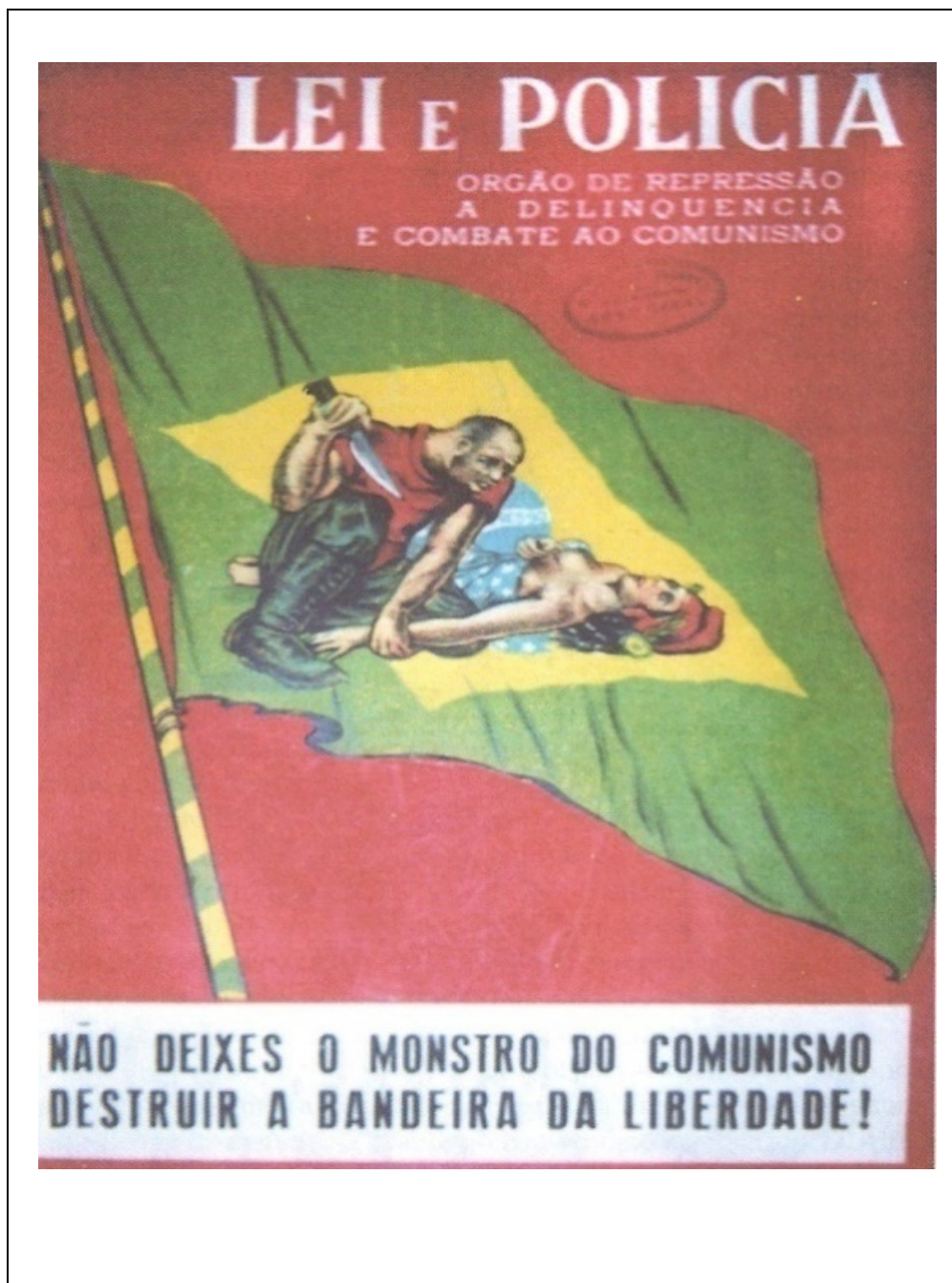
QUADRO 1 - Não deixes o monstro do comunismo destruir a bandeira da liberdade!

Fonte: Lei e Polícia, 1948, Nov/Dez, Ano I, n. 2 e 3, p. 52