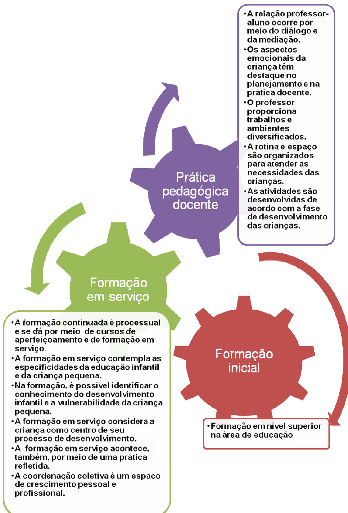
Figura 2- Grupos de indicadores de qualidade detalhados.