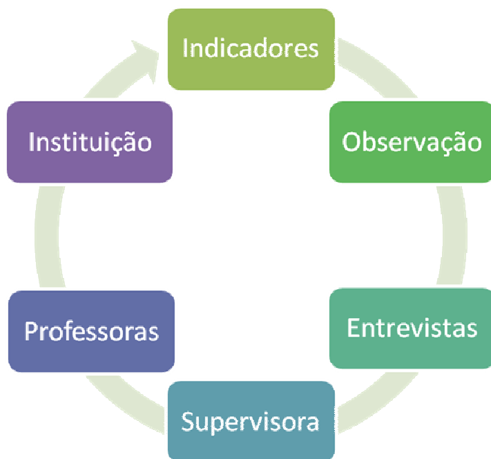
Figura 4 – Percurso metodológico

Para a construção das informações, partiu-se dos indicadores, por meio de um processo contínuo, passando pelos procedimentos e instrumentos utilizados até a análise das informações, conforme ilustrado na figura 4.