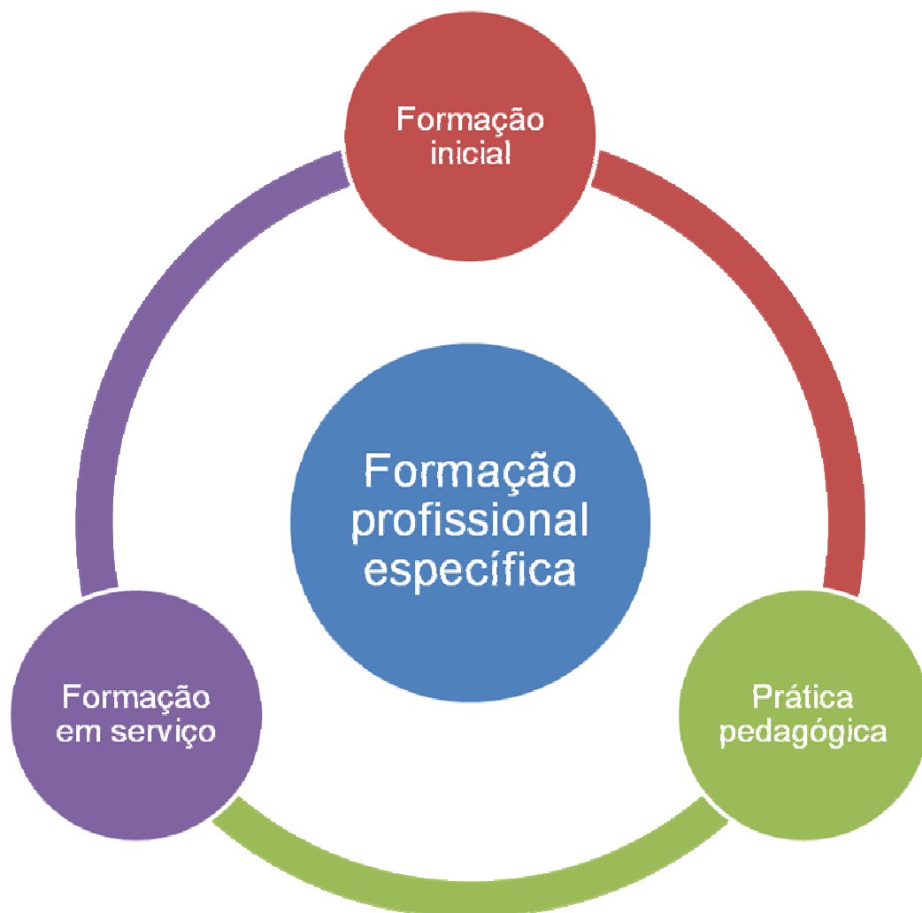
Figura 1 – Grupos de indicadores de qualidade

Para cada um desses grupos foram construídos indicadores julgados relevantes para a qualidade na educação infantil. Esses indicadores estão extremamente interligados, relacionando-se e complementando-se, no entanto, eles não cobrem a gama de possíveis indicadores da formação profissional específica em geral. Para a proposta desse trabalho, julgou-se que esses são os mais adequados para essa análise, e esses foram selecionados: