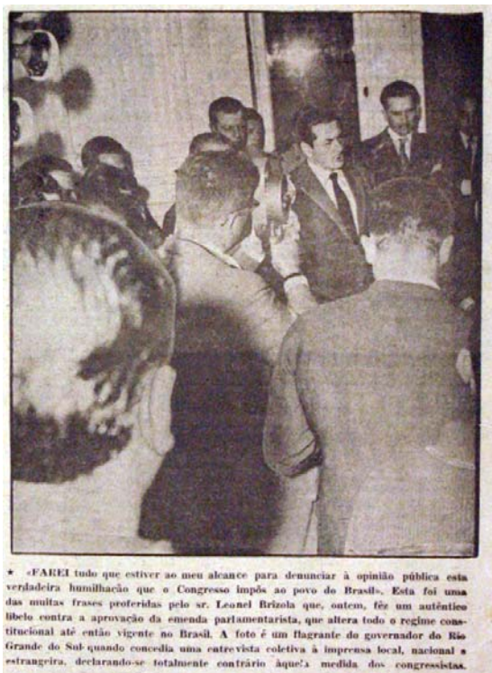
Figura 36 - Brizola em foco

Os meios de comunicação disponíveis, o rádio e o jornal são os meios de transmissão pelo qual o governador comunicou à população gaúcha e nacional suas decisões, seu sentimento de insatisfação e sede por justiça. A imprensa foi a principal arma de Brizola na defesa dos seus ideais.