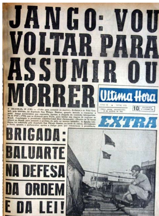
Figura 33 - Palácio fortificado