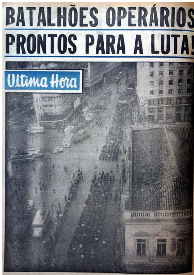
Figura 40 - Prontos para a luta

legalidade. O que ratificado pela manchete “Legalidade fez o povo vibrar nas ruas”.