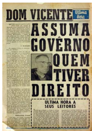
Figura 13 - Líder eclesiástico

No dia trinta e um de agosto, acompanhando a editoria de política podemos fazer uma leitura do andamento da crise. A guerra civil parece eminente. A capa abre a edição com foto e manchete indicando a mobilização das tropas do Ministro da Guerra, Odílio Denys, em marcha contra a resistência no Sul (fig.14). Mas a reportagem mais significativa, tanto política como fotográfica, é a que aparece nas páginas centrais oito e nove onde o povo lotou a Praça da Matriz para aplaudir General Machado Lopes, comandante do III Exército que aderiu, e se tornou o General da Legalidade . Na página dez aparecem fotos de campanhas para doadores de sangue, num plano de emergência da Cruz Vermelha (fig.15). E a contracapa fecha a edição com uma foto ocupando praticamente todo o espaço da página, mostrando, como diz a manchete “Batalhões operários prontos para a luta” .