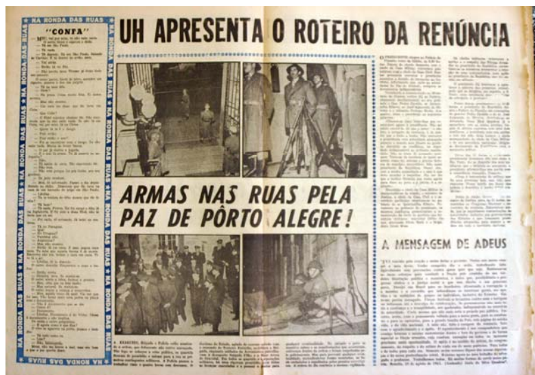
Figura 4 - Militares em prontidão

Na edição extra do dia vinte e sete, a manchete da capa expõe o que já se delineava desde a renúncia de Jânio: “Golpe contra Jango!” . Além desta manchete, a capa apresentava um editorial que convocava: “constituição ou Guerra civil” , e uma foto aberta de Jango ao microfone com uma platéia ao fundo. Uma foto de arquivo, pois este não se encontrava em território nacional, na qual ele discursa para uma multidão.