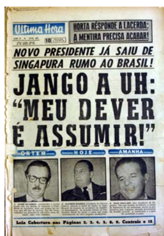
Figura 2 - Ontem, hoje e amanhã