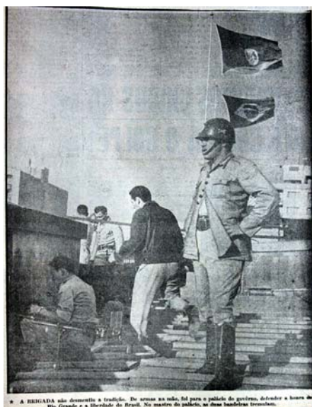
Figura 34 - Soldados prontos para a luta