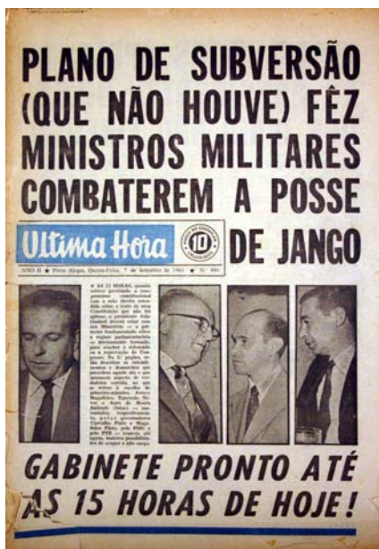
Figura 22 - Líderes políticos em Brasília