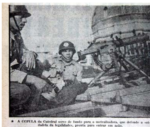
Figura 35 - Fortificação militar

Esta imagem acima que integra uma narrativa fotográfica na capa e página dupla central reforça a ideia de fortificação militar do Palácio Piratini, soldados prontos para a luta armados com metralhadoras. A foto acrescenta um elemento novo a cúpula da catedral metropolitana e numa relação com a legenda leva a crer que a catedral é mais uma instituição a ser preservada, pois esta está com a legalidade, pela sua proximidade física e ideológica.