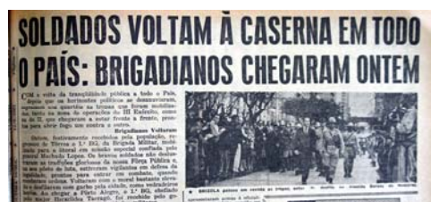
Figura 29 - Brizola passa tropas em revista