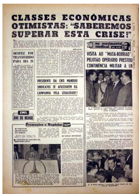
Figura 23 - Visita ao "Mata-Borrão"

Dia oito a fotografia ganha o espaço da capa que compreende quase a sua totalidade. Mostra o congresso lotado enquanto Jango faz seu discurso de posse, repercutindo a posse do presidente (fig.24). A manchete traz a confirmação. "Tancredo é o "premier"!". Na página 8 as fotografias mostram ambientes internas