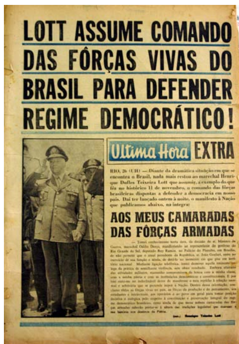
Figura 6 - Manifesto do gen. Lott

As fotos das edições que circularam no dia vinte oito evidenciam a grande mobilização popular que aconteceu nas ruas de Porto Alegre. UH traz na capa da edição extra a manchete de intenso sensacionalismo “Jango: vou voltar para assumir ou morrer” a foto mostra a Brigada Militar mobilizada para defender o Rio Grande do Sul e o Brasil na sugestiva mensagem visual onde aparecem as