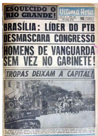
Figura 26 - III Exército deixa Porto Alegre

No sábado de nove de setembro UH a capa se divide, em uma manchete que questiona o novo gabinete parlamentarista pela falta de homens de vanguarda e foto na mesma proporção de importância espacial com as tropas do III exército que deixam Porto Alegre em direção ao interior do estado (fig.26). Nas centrais 10 e 11 são retratos das autoridades que integram o novo gabinete e em especial um retrato de Tancredo Neves que ganham destaque (fig.27).