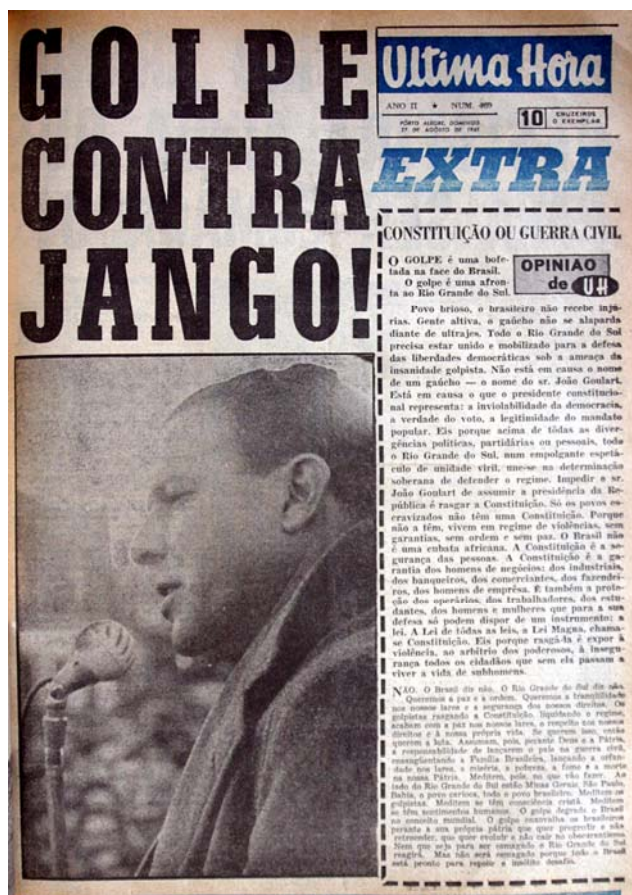
Figura 30 - "Golpe Contra Jango!"

Brizola aparece passando as tropas em revista já com os espíritos desarmados. A partir desta noção apresenta-se 3 de imagens fotográficas do padrão em questão para análise em separado.