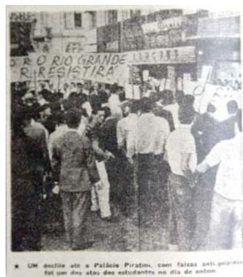
Figura 9 - Todos à assembléia