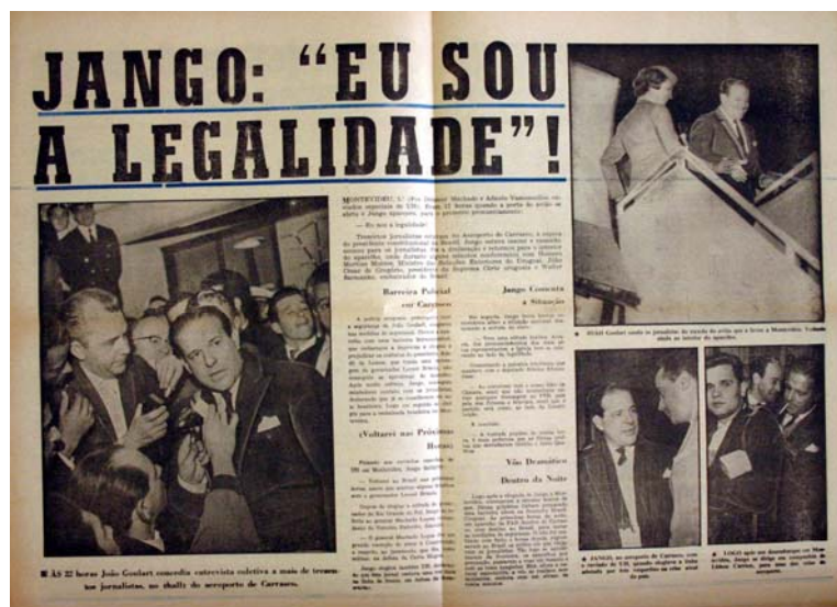
Figura 16 - Eu sou a legalidade Fonte: Última Hora-RS (25 ago./13 set. 1961)

ocuparam 2 cidades de Santa Catarina!”. Contudo as pagina centrais, 8 e 9 trazem fotos da chegada de Jango no Uruguai e a manchete “Jango: “Eu sou a legalidade”” (fig.16).