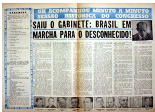
Figura 27 - O novo gabinete

Nos dias seguintes 11,12 e 13 as principais fotos sobre a legalidade em UH mostram a desmobilização militar com o retorno da Brigada Militar e do exército aos quartéis (fig.28). O Governador Brizola passa as tropas em revista (fig.29). No