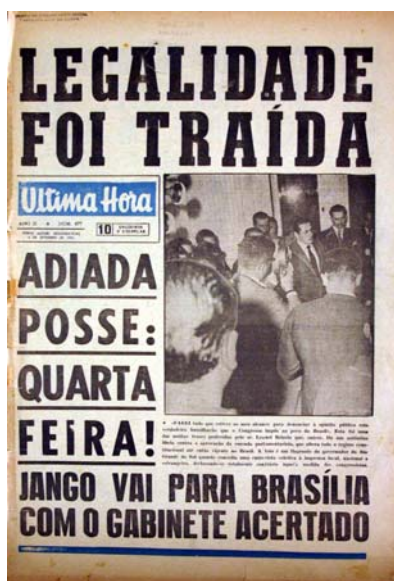
Figura 20 - Legalidade traída

Segunda-feira, dia quatro de setembro UH publica uma foto em tamanho grande de uma coletiva de imprensa com o governador Brizola e a manchete: “Legalidade foi traída” (fig.20), demonstrando uma ruptura no discurso de Brizola e Jango, as paginas centrais aparece um conjunto de fotos onde parece o descontentamento de manifestantes com o silêncio de Jango naquele momento