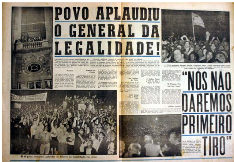
Figura 41 - O povo aplaudiu a Legalidade

Esta página central do UH-RS mostra uma narrativa fotográfica que explora a relação da massa popular e as lideranças da resistência ao golpe e da defesa da legalidade, na foto do lado superior esquerdo mostra as lideranças na sacada do palácio saudando a população em frente ao Palácio Piratini Aparecem Leonel Brizola e Machado Lopes, abaixo a esquerda a população manifesta-se com cartazes e aplausos, no canto superior direito mais uma foto de manifestantes populares, e por fim abaixo e a direita com câmera alta o fotografo em situação privilegia da sacada faz uma vista geral da Praça da Matriz mostrando a multidão em segundo plano enquanto no primeiro plano, de costas para o fotografo e de frente para a massa, aparecem as autoridades (fig.41).