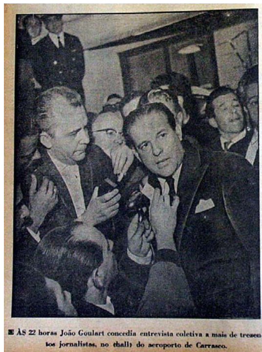
Figura 37 - Jango e a imprensa

governador notam-se pela distância dos primeiros, e segundo plano, vemos um cinegrafista, A câmera alta enfatiza ainda mais a perspectiva levando a imprensa na direção do governador.