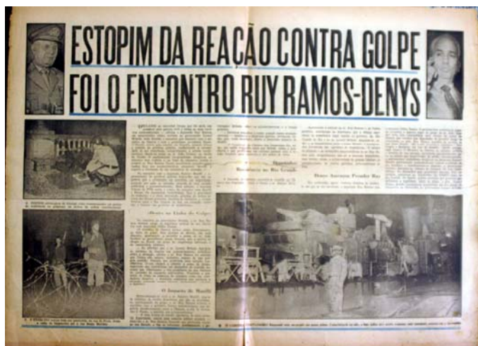
Figura 5 - Estopim da reação