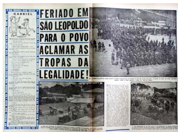
Figura 28 - Desmobilização militar

Dia treze o jornal traz um único retrato do General Machado Lopez ilustrando entrevista concedida.