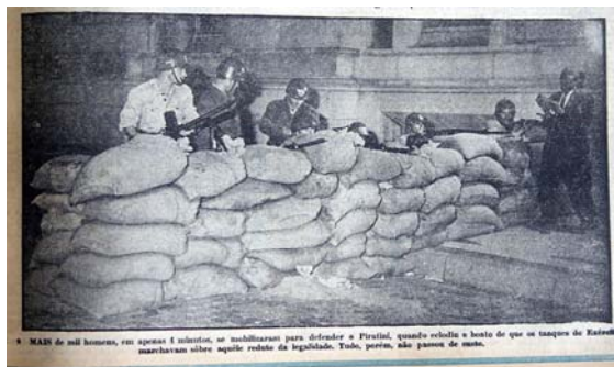
Figura 11 - Soldados em trincheira

Na terça-feira, dia vinte e nove, o Última Hora traz na capa a linha de frente da batalha, indicando na Manchete principal: “sargentos da FAB impediram ontem o bombardeio do Palácio Piratini” e a mobilização dos sindicatos de trabalhadores na área de energia com uma foto de um líder sindical vigilante, pronto para entrar em ação (fig.12). Enquanto, comitês de resistência espalhados pela cidade mobilizam-se. E por fim, a contracapa traz o Arcebispo Metropolitano, Dom Vicente Scherer, com a manchete: “Assuma o Governo quem tiver direito” . A foto é de Dom Vicente (fig.13), o líder eclesiástico está centralizado em tamanho médio o que mostra uma importância significativa.