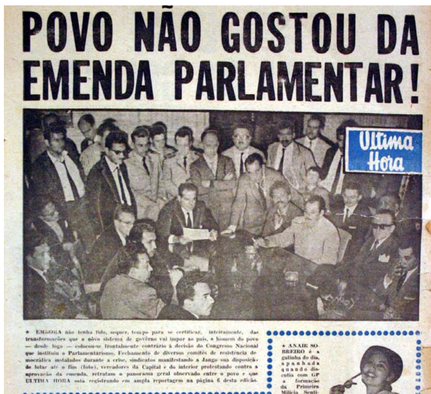
Figura 38 - Coletiva de imprensa com Jango

A imagem mostra uma entrevista coletiva de João Goulart no Palácio Piratini, em sua chegada em Porto Alegre e novamente o foco central para onde se dirige o olhar do leitor. Jango está cercado por jornalistas sentados à mesa preparada para a coletiva (fig.38). A tomada da foto com a câmera alta possibilita visualizar um todo separado pela figura central atrás de Jango, militares e civis que parecem ser do estafe do presidente e a sua frente os jornalistas com o olhar desviado para alguém fora do quadro da foto que interpela o entrevistado. A manchete relacionada com a foto reforça o clima de explicações sobre a postura de Jango em relação a proposta parlamentarista.