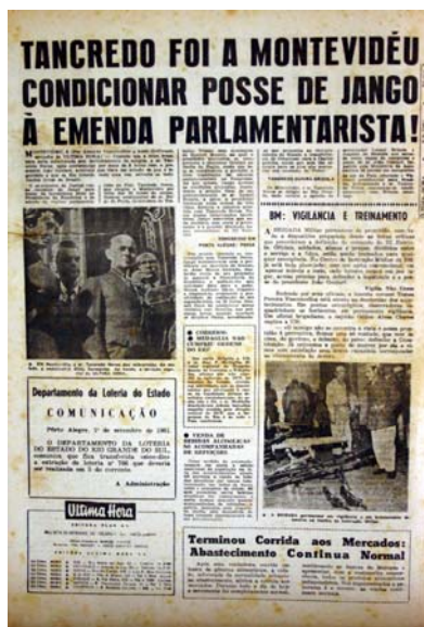
Figura 17 - Tancredo no Uruguai