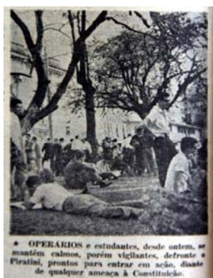
Figura 7 - Operários e estudantes

bandeiras ao fundo. Nas ruas os fotógrafos vão retratar a ação contra o golpe com fotos de manifestações, passeatas de estudantes, operários e populares, e barricadas nas ruas (figs. 7,8 e 9). Numa demonstração de integração social a Praça da Matriz torna-se o ponto de convergência para todas as manifestações, local onde o povo é apresentado como autentico condutor do movimento. Na pagina central UH apresenta uma sequência fotos mostrando a mobilização da Brigada Militar com barricadas na praça em torno do Palácio Piratini (fig.10)