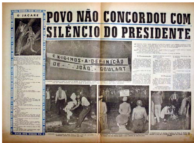
Figura 21 - Silêncio de Jango

(fig.21). E na contracapa uma foto em tamanho grande apresenta Jango em entrevista coletiva com sindicalistas e vereadores.