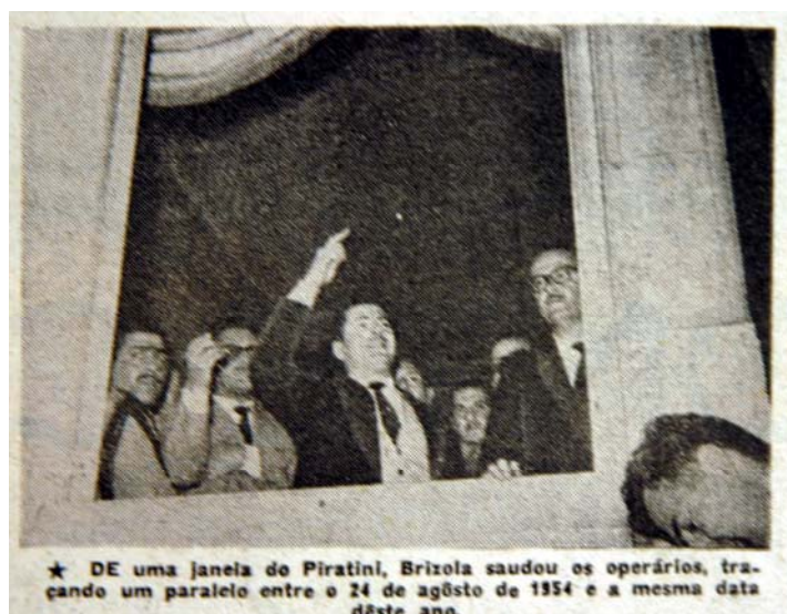
Figura 3 - Discurso de Brizola em 26-03-1961

No mesmo dia, na página oito, a edição traz uma foto (fig.3) do governador Leonel Brizola na janela do Palácio Piratini discursando ainda em defesa da volta de Jânio à presidência, acreditando que este teria sido vítima de uma tentativa de golpe. Chamam atenção também as quatro fotos publicadas na página central lado a lado mostrando militares em prontidão pela paz em Porto Alegre, apontando uma preparação para resistência ao golpe em curso (fig.4).