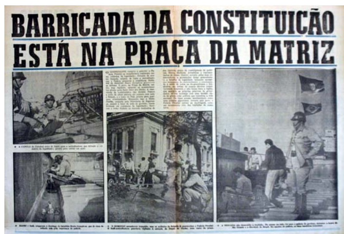
Figura 10 - Barricada da constituição

Ainda no dia vinte e oito, a edição 471 apresenta a notícia; “Terceiro exercito aderiu a Brizola!” Com uma foto do general Machado Lopes ao lado do Governador Brizola. Na página central mobilização em frente ao palácio com soldados em uma trincheira (fig.11). E a contracapa mostra o povo na Praça da Matriz.