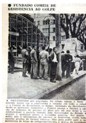
Figura 8 - O Mata-Borrão