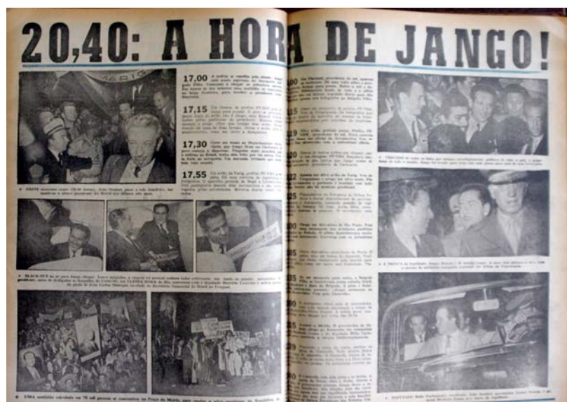
Figura 18 - A hora de Jango