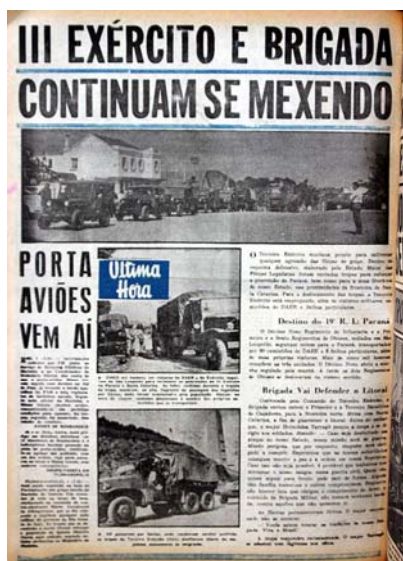
Figura 19 - Movimentação das tropas