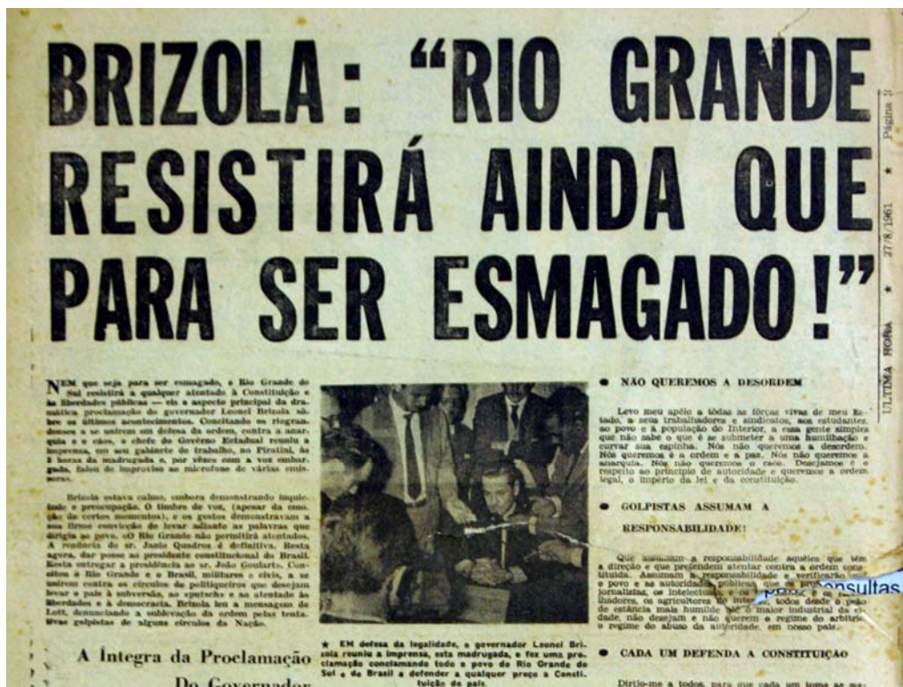
Figura 31 - Rio Grande resistirá

imagem o presidente e em segundo plano o público ouvinte, a desfocalização do segundo plano e o plano fechado da foto permitem que se imagine o público como uma multidão. Neste momento da crise nos primeiros dias o Última Hora indicou a principal liderança identificada com o jornal, o povo e a legalidade.