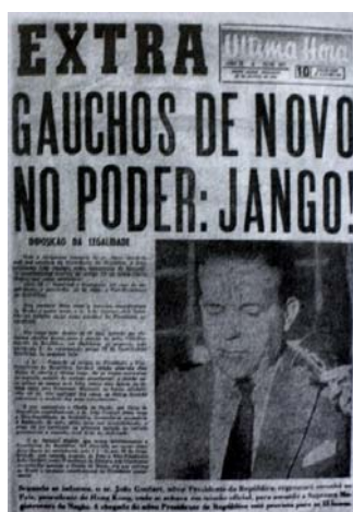
Figura 1 - Gaúchos no poder

Apesar de num primeiro momento a cobertura jornalística se confundir com a política o UH foi um jornal defensor da Legalidade. O Última Hora foi o único veículo da mídia existente que percebeu e revelou um alinhamento das forças políticas com o “Rio Grande Histórico”, verdadeiro ou mitológico. A legalidade apareceria, assim, como uma síntese de contradições, aspirações psicológicas, necessidades existenciais e interesses sociais e econômicos concretizados num gesto político de desafio. 125