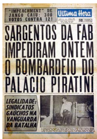
Figura 12 - Sindicalismo vigilante

Na terça-feira, dia vinte e nove, o Última Hora traz na capa a linha de frente da batalha, indicando na Manchete principal: “sargentos da FAB impediram ontem o bombardeio do Palácio Piratini” e a mobilização dos sindicatos de trabalhadores na área de energia com uma foto de um líder sindical vigilante, pronto para entrar em ação (fig.12). Enquanto, comitês de resistência espalhados pela cidade mobilizam-se. E por fim, a contracapa traz o Arcebispo Metropolitano, Dom Vicente Scherer, com a manchete: “Assuma o Governo quem tiver direito” . A foto é de Dom Vicente (fig.13), o líder eclesiástico está centralizado em tamanho médio o que mostra uma importância significativa.