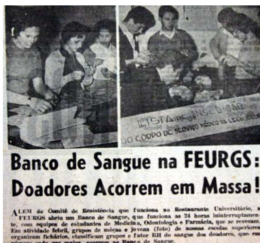
Figura 15 - Cruz Vermelha

Na edição de nº 475 de sexta-feira, primeiro de setembro, uma semana após o início da crise, a capa não traz nenhuma foto, é significativa a ausência de fotografias, e sim manchetes que davam conta da movimentação e da posição do chefe das forças armadas: “Denys disse não a Jango” e “ Tropas do golpe já