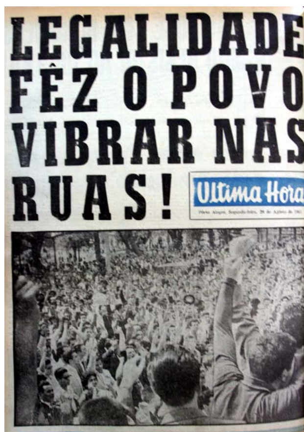
Figura 39 - Legalidade fez o povo vibrar nas ruas

denominada na manchete com “Povo”. Em outra foto na contracapa do Última Hora exibe uma foto que ocupa quase a totalidade da página em ângulo superior demonstrando operários organizados militarmente subindo a avenida Borges de Medeiros. Para completar este grupo de fotos destaque para a página central do Última Hora no dia 28 de agosto onde se vê uma sequência de fotos da multidão que compareceu na Praça da Matriz para saudar os líderes da legalidade Leonel Brizola e Machado Lopes.