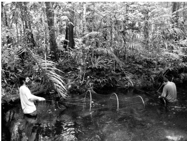
Figura 2. Disposição em que foram assentados os covos, à direita (igarapé a jusante) fica o funil de entrada fixado junto ao leito do riacho e a esquerda o segundo compartimento (onde ficam os animais e a isca) fixado à meia-água.

revisadas diariamente das 07:00 às 09:30h. Na medida do possível, elas também foram revisadas no início da noite, para minimizar a probabilidade de afogamento dos animais presos na rede do covão abaixo da linha d'água.