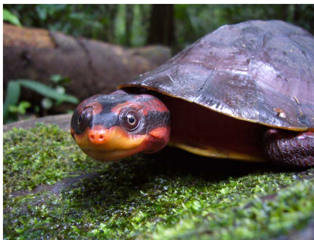
Figura 3. Macho adulto de Rhinemys rufipes capturado na Reserva Florestal Adolpho Ducke.

Indivíduos capturados. Foram capturados 144 indivíduos de Rhinemys rufipes (Figura 3), sendo 78 fêmeas, 55 machos e 11 juvenis. Treze fêmeas grávidas foram detectadas por palpação de região pélvica entre o início de abril e o início de julho. Ao todo foram capturados 27 indivíduos no riacho Acará, 41 no riacho Bolívia, 41 no riacho Ipiranga e 35 no riacho Tinga.