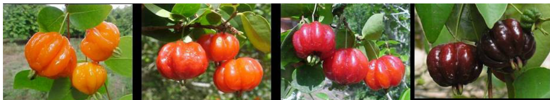
Figura 1. Pitangas ( Eugenia uniflora L.) com diferente coloração de polpa.

No que concerne à produção e comercialização da fruta, não se dispõe de dados oficiais, tanto no Brasil quanto no mundo, no entanto estima-se que o Brasil seja o maior produtor mundial. Os maiores plantios estão localizados no Estado de Pernambuco, onde uma região possui cerca de 300 hectares cultivados (BEZERRA et al., 2000).