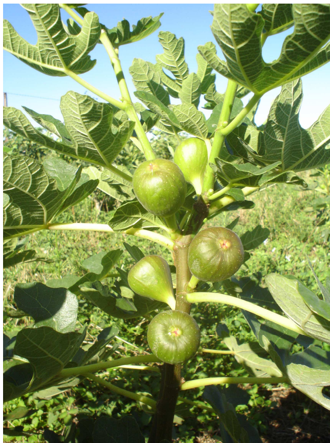
Figura 3. Uniformização do tamanho dos frutos abaixo da região despontada. Marechal Cândido Rondon-PR, Unioeste, 2008.

tamanho dos frutos abaixo da região despontada, com maior crescimento dos frutos localizados na extremidade do ramo (Figura 3), possibilitando planejamento da colheita e economia na aplicação de produtos cúpricos (GONÇALVES et al., 2006).