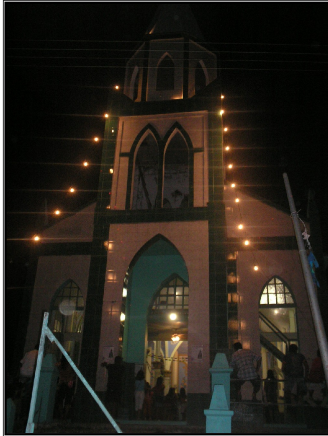
FIGURA 11 – Igreja de Nossa Senhora Aparecida iluminada para o festejo, Comunidade de São Carlos.

As luzes da comunidade despontam no barranco. A igreja está decorada e dos auto falantes da torre o som que se escuta são os cânticos que logo mais estarão animando a celebração. O grupo responsável pela noite do festejo já está na igreja, arrumando o espaço, fazendo o ensaio para a entrada da procissão que dá início a celebração. O movimento que é visto na comunidade é em direção à igreja, as pessoas passam usando a camiseta do festejo ou trajando sua melhor roupa, afinal para o ribeirinho a Santa merece um traje especial. Homens, mulheres, senhoras, jovens e crianças fazem parte do grupo que está na igreja.