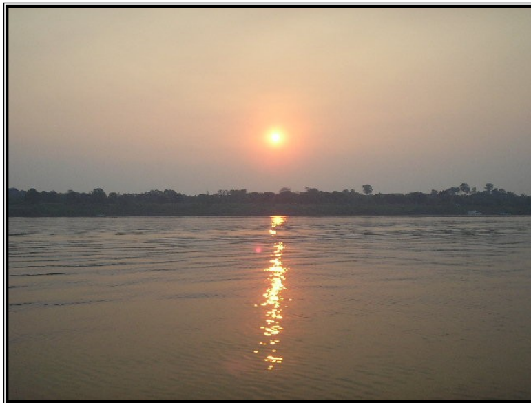
FIGURA 10 – O sol se pondo no rio Madeira. A noite vêm chegando e com ela os momentos mais esperados do festejo. Fonte: SARAIVA, Adriano Lopes, Outubro de 2005.

Quando o barco chega à comunidade já é noite. Na beira do barranco estão alguns familiares e amigos dos passageiros a espera de quem vai chegar. O encontro entre aqueles que chegam com os que estão na comunidade é animado, cercado de saudosismo e euforia.