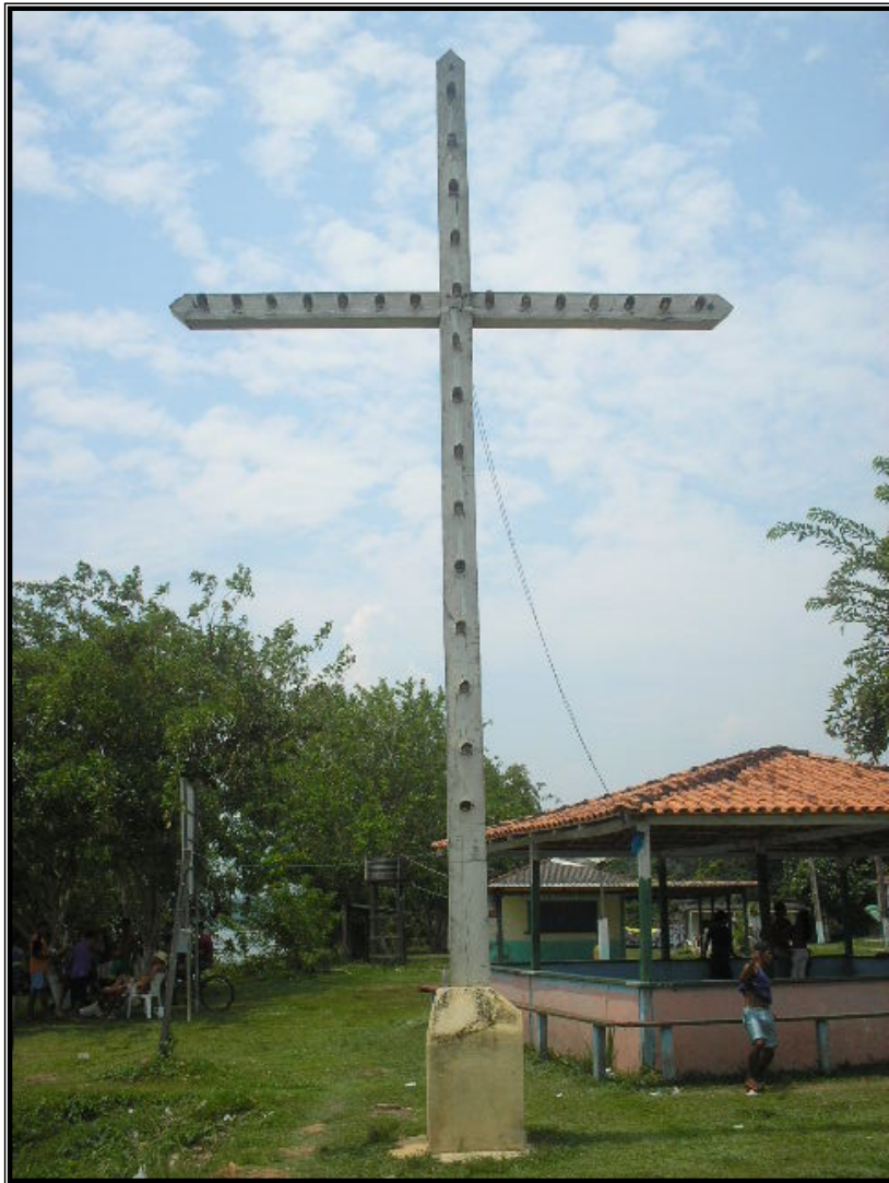
FIGURA 1 – Cruzeiro da Comunidade de Calama. Marco da comunidade que já indica que logo ao chegar o viajante encontrará a igreja católica.