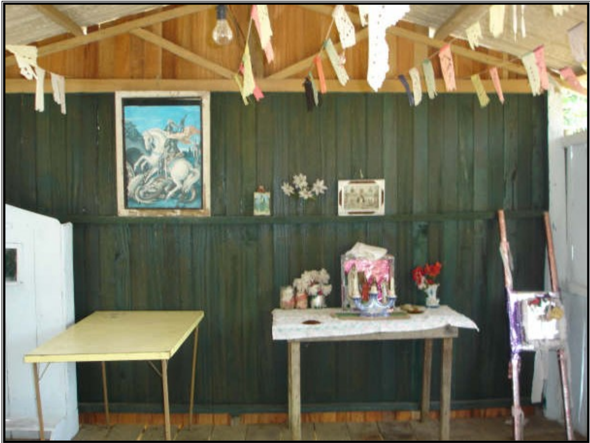
FIGURA 26 – Sala de uma residência na comunidade de Santa Catarina, onde observamos a devoção e a religiosidade popular no andor, no oratório e no quadro de São Jorge.