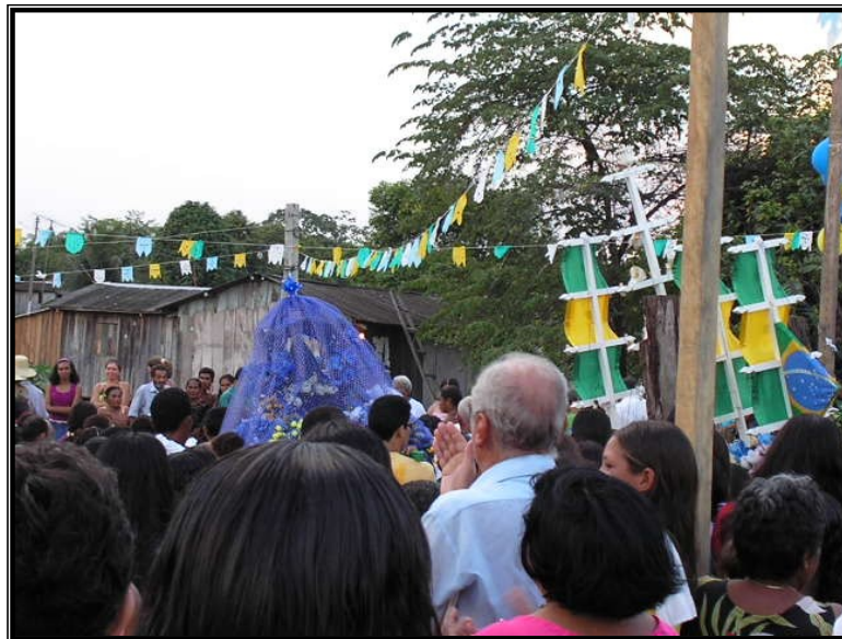
FIGURA 22 – As imagens seguem juntas rumo ao pátio da igreja seguida e sendo louvadas pelos fiéis.

A procissão terrestre já espera a chegada do andor fluvial. O encontro das imagens remete a gênese das imagens de Nossa Senhora, uma encontrada no rio e a outra vinda por terra. Em São Carlos eles prestam homenagem às imagens. O andor da imagem que vem pelo rio é feito no formato de um barco, adornado pelos símbolos das águas como canos, malhas de pesca, peixes e botos. Já o andor da procissão terrestre traz a Santa paramentada com um manto costurado pelas mulheres da comunidade, sendo feito com muito esmero e dedicação.