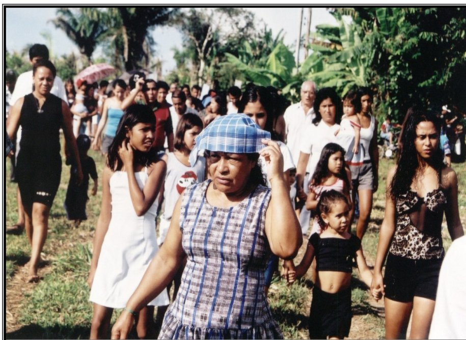
FIGURA 3 – Procissão do Festejo de Nossa Senhora da Saúde, Comunidade de Prosperidade. Fé e devoção durante as comemorações em homenagem à Santa. Fonte: SILVA, Josué da Costa, Agosto de 2004.

“Eu não desligo. Quando tá chegando perto do dia da festa... Não é só eu não, viu? As minhas irmãs também. Um liga pro outro, e pro outro, sabe como? E, assim, é a coisa mais gostosa que tem! Essa expectativa: que tá chegando, que a gente tem que vim... - apesar de que eu venho sempre. Eu não consigo desagarrar, né?” (Informante A)