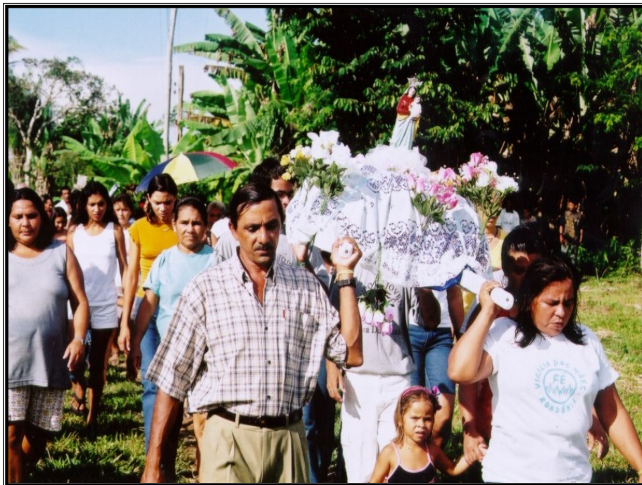
FIGURA 4 – Andor de Nossa Senhora da Saúde em momento de procissão, comunidade de Prosperidade. Cânticos e louvor são entoados durante o festejo.

“O suor derramado desta pequena comunidade será o alicerce onde será construída a nova Nazaré do futuro, onde enchentes e deslizamentos jamais afetarão. Unidos venceremos. A força dos pequenos é a imagem do poder divino”.