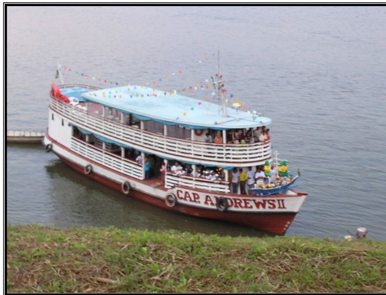
FIGURA 18 – Barco trazendo o andor com a imagem de Nossa Senhora, a procissão das águas enfim chega em terra firme.

A procissão do Festejo de Nossa Senhora Aparecida é o momento onde vemos os devotos pagando suas promessas, vemos muitos de pés no chão com uma vela na mão simbolizando sua fé, seu agradecimento. O grupo das mulheres da comunidade puxa o cântico, tendo o sacerdote como o pastor que toca seu rebanho em direção ao encontro com da Santa. As duas imagens precisam se encontrar para juntas serem levadas à Igreja para a missa campal e o coroamento de Nossa Senhora.