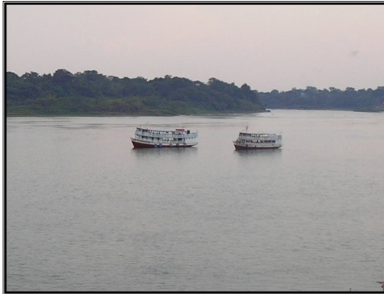
FIGURA 8 – Barcos recreio chegando em São Carlos para a procissão de Nossa Senhora Aparecida. Fonte: SARAIVA, Adriano Lopes, Outubro de 2005.