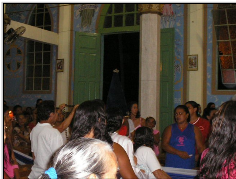
FIGURA 12 – Procissão de Entrada de Nossa Senhora Aparecida. Momento de louvor, oração e devoção no Festejo de São Carlos.

O sino toca mais uma vez chamando a todos para o início da Celebração. O dia é do Grupo de Professores da Escola da comunidade. Eles são responsáveis por organizar a celebração, de providenciar o brinde que será bingado, pela ornamentação do altar e pela condução dos cânticos da celebração.