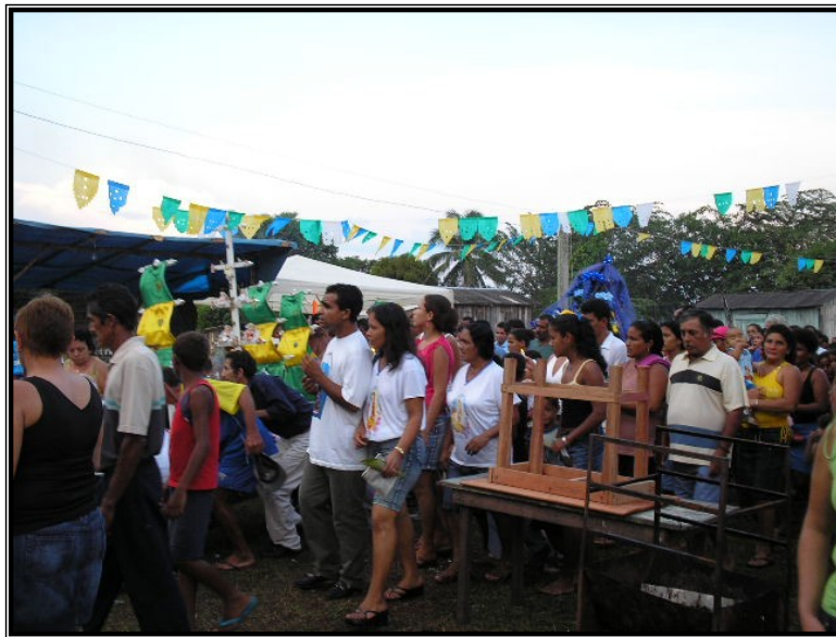
FIGURA 20 – As imagens se encontram. Água e terra juntas no louvor à Santa.

“Se as água do mar da vida, Quiserem te afogar Segura na mão de Deus e vai! Se as tristezas desta vida Quiserem te sufocar Segura na mão de Deus e vai