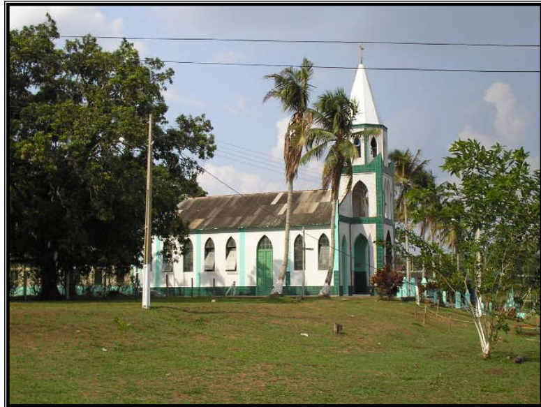
FIGURA 16 – Igreja de Nossa Senhora Aparecida em dia de festa. Ornamentação, movimento e festividades marcam os momentos do festejo.

segue noite adentro, com suas músicas, danças, paqueras, encontros; é o momento onde os jovens têm para exercitar a conquista, de “ficar”, é o jogo da sedução que está no ar.