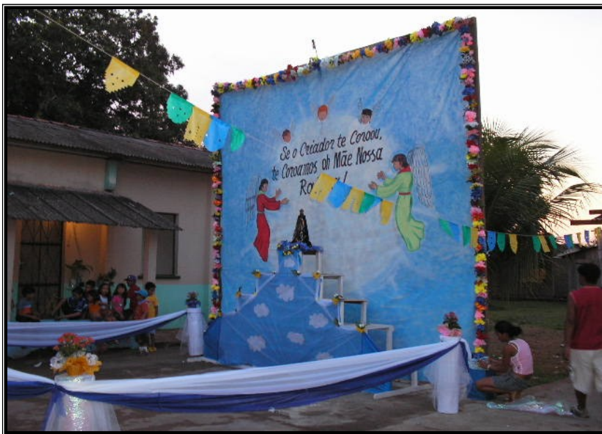
FIGURA 25 – Altar para coroação da Imagem de Nossa Senhora sendo preparado para o momento de encerramento do festejo.

A imagem de Nossa Senhora Aparecida antes de voltar para o altar da igreja, antes ela é coroada, recebendo dos moradores orações, cânticos e promessas.