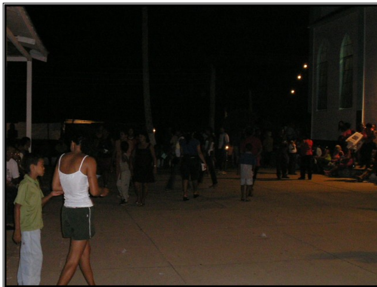
FIGURA 14 – Pátio da Igreja de Nossa Senhora Aparecida em dia de festejo. Espaço do bingo, dos leilões, da convivência da comunidade. Fonte: SARAIVA, Adriano Lopes, Outubro de 2005.

Além do bingo o participante da festa pode aproveitar opções de lazer que estão a sua disposição, como barracas de comidas e bebidas, doces e bolos, de roupas, o pequeno parque de diversão, o algodão doce, o churrasquinho. No pátio ao lado da Igreja de Nossa Senhora Aparecida está toda uma infra-estrutura montada para acomodar os momentos de diversão e os momentos missa campal do festejo.