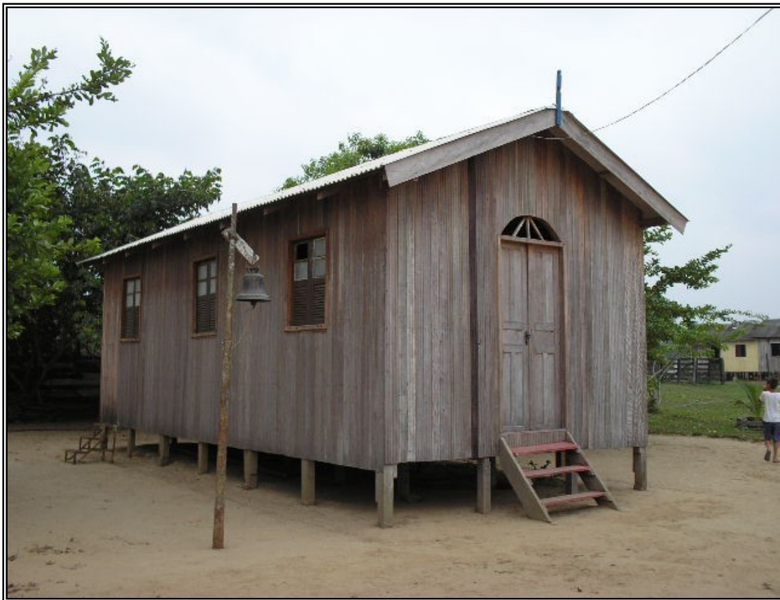
FIGURA 5 – Igreja da Comunidade de São José da Praia. Marco de presença do catolicismo que existe na região ribeirinha, mesmo nas comunidades mais distantes a religiosidade é marcante.