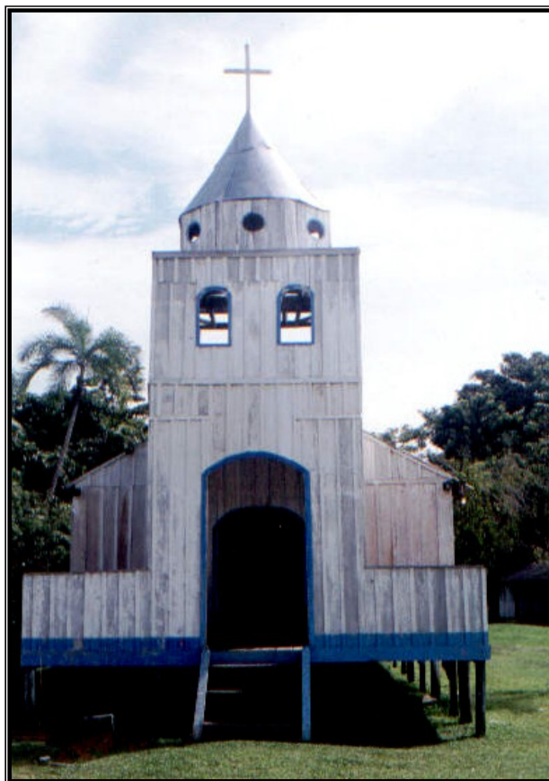
FIGURA 2 – Antiga Igreja de São Pedro na comunidade de Nazaré, construção de madeira que foi substituída por uma igreja de alvenaria.

O sino da Igreja toca avisando a comunidade que a missa já vai iniciar... “Já vai começar o festejo?” Pergunta um visitante a uma senhora que com passos firmes se dirige a igreja. Ela responde: - Sim, senhor vai começar! É o festejo de Nossa Senhora de Nazaré... (moradora da comunidade de Nazaré, 2004)