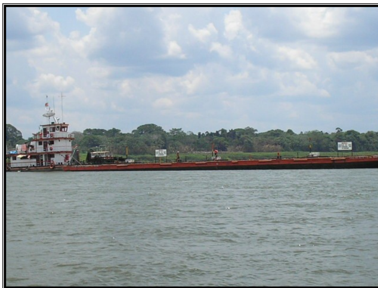
FIGURA 9 – Balsa transportando combustível de Manaus a Porto Velho. O rio Madeira é a estrada para os ribeirinhos, fonte de alimento, de subsistência, lazer e diversão. Fonte: SARAIVA, Adriano Lopes, Janeiro de 2007.

A viagem segue seu percurso descendo o rio, encontrando outros barcos, passando pelas comunidades ao longo do rio. A comunidade vai ficando cada vez mais próxima e a animação dos passageiros aumenta com a convivência desse curto espaço de tempo. Esta que já mostra que será ainda maior durante o festejo, advinda da grande movimentação que há na comunidade com as missas, os bingos, o baile, as brincadeiras e o torneio de futebol.