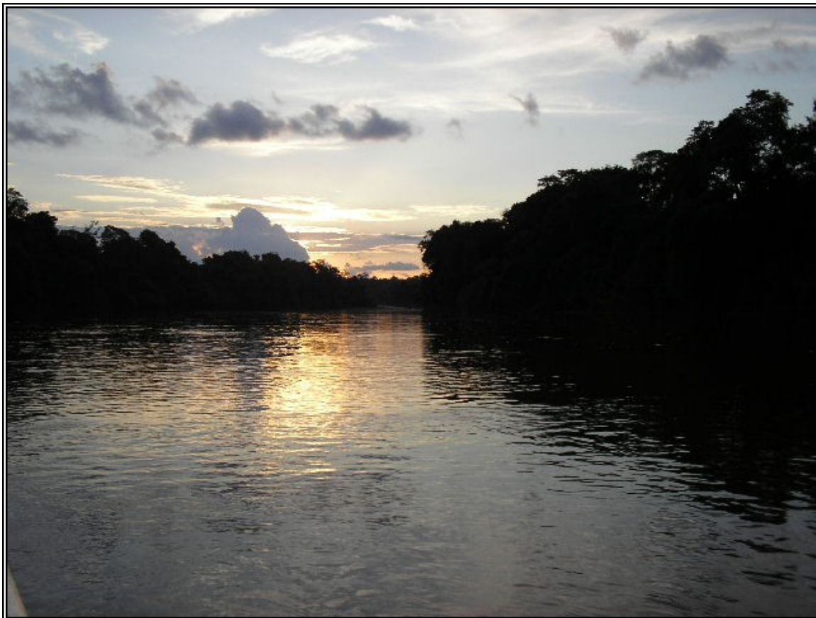
FIGURA 6 – O pôr-do-sol no rio Madeira, prenúncio das festividades que estão por começar nas comunidades ribeirinhas. Fonte: SARAIVA, Adriano Lopes, Outubro de 2005.