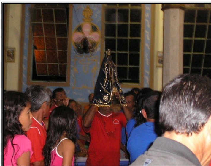
FIGURA 13 – Entrada da Imagem de Nossa Senhora Aparecida na celebração. Fiel segura a imagem em devoção, levando-a ao altar para o início de missa. Fonte: SARAIVA, Adriano Lopes, Outubro de 2005.

Eles trazem em suas mãos utensílios de seu trabalho. Livros, apagadores, o giz, um caderno, lápis, são trazidos por alguns deles para serem depositados no altar em agradecimento a santa. O louvor é externado na forma do cântico, na forma de agradecimento por parte do grupo ali presente. A Imagem é colocada no altar e os professores sentam-se nos lugares para eles reservados, assim a celebração prossegue.