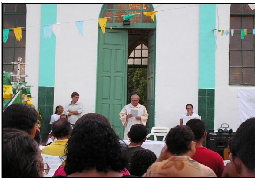
FIGURA 24 – Momentos de louvor na missa campal, preces, cânticos e penitências cercam a celebração conduzida pelo sacerdote.

As imagens se encontram e são levadas para o pátio da Igreja, onde vai ser rezada a missa campal. A missa é para celebrar o momento do festejo, para encerrar a festa com chave de ouro e a participação de todos.