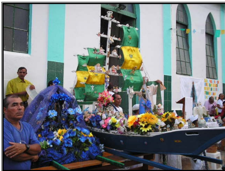
FIGURA 23 – Os dois andores lado a lado. Preparação para a missa campal, enfim água e terra estão juntas.

As imagens se encontram e são levadas para o pátio da Igreja, onde vai ser rezada a missa campal. A missa é para celebrar o momento do festejo, para encerrar a festa com chave de ouro e a participação de todos.