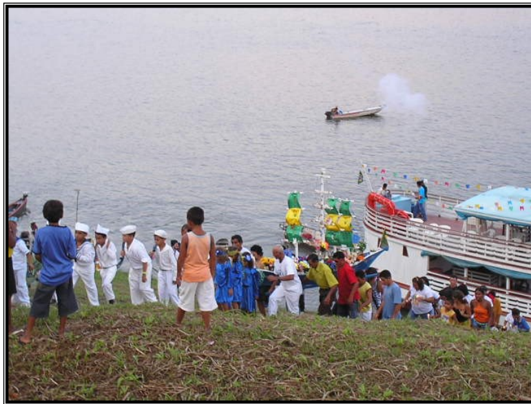
FIGURA 19 – Procissão das águas sobe a Terra Firme, logo as duas imagens se encontram.

Na beira do barranco se dá o encontro das imagens de Nossa Senhora, a que está na procissão terrestre e a da procissão fluvial. O barco pára no porto à frente da igreja e um grupo de devotos carrega o andor, tendo uma comissão de crianças, os meninos trajados de marinheiros e meninas de anjos representando protetores do andor de Nossa Senhora. Ouve-se o cântico “Segura na mão de Deus” sendo entoado pelos devotos.