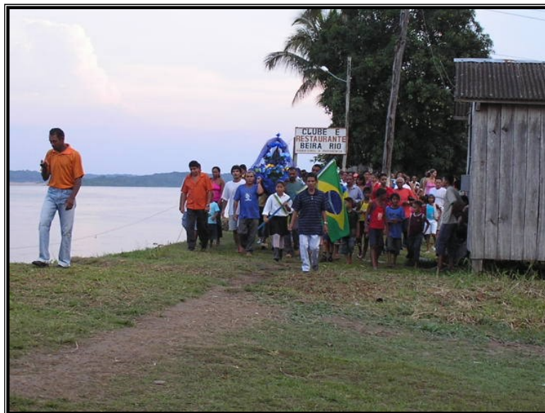
FIGURA 21 – Os fiéis trazem as imagens. A procissão segue seu caminho.

“Se as água do mar da vida, Quiserem te afogar Segura na mão de Deus e vai! Se as tristezas desta vida Quiserem te sufocar Segura na mão de Deus e vai