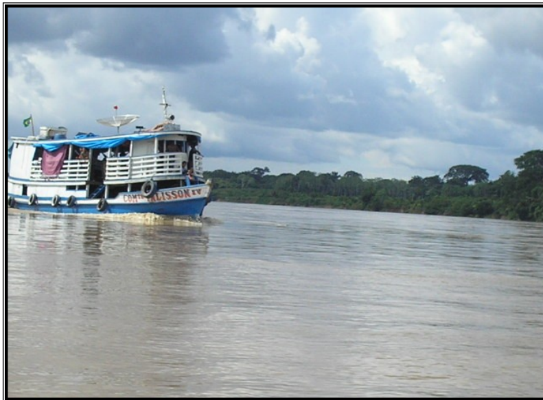
FIGURA 7 – Barco recreio cortando as águas do rio Madeira, transportando passageiros e cargas de Porto Velho às comunidades ao longo do rio.

Estamos no mês de outubro às vésperas do Festejo de Nossa Senhora Aparecida. Um barco sai do porto do Cai n'Água com destino a São Carlos, cheio de passageiros, pessoas entusiasmadas rumo a festa, muitas delas irão rever familiares, alguns dos rapazes irão para jogar no torneio de futebol como também algumas pessoas irão para conhecer. E um sentimento é comum a todos: a euforia de estar viajando para um evento de muita importância para aquela comunidade.