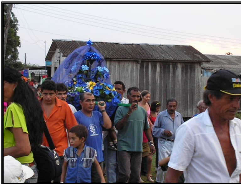
FIGURA 17 – Andor com a imagem da Santa. Procissão terrestre do Festejo de Nossa Senhora Aparecida.

O festejo tem que continuar. E a procissão é a etapa seguinte. Em São Carlos temos duas procissões, uma terrestre e outra fluvial. O andor com a imagem sai da igreja e dá uma volta pela comunidade.