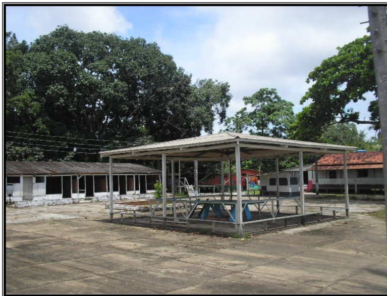
FIGURA 15 – O pátio da Igreja durante a semana. O movimento só existe nos momentos festivos.

A diversão que o festejo proporciona para o ribeirinho faz parte da programação. Já está no planejamento que a organização faz para a festa. Para que as barracas e demais outras atividades estejam na festa é cobrada uma taxa, convertida para a igreja, para manutenção da estrutura e reforma das instalações do prédio, do pátio e das barracas que estão naquele espaço.