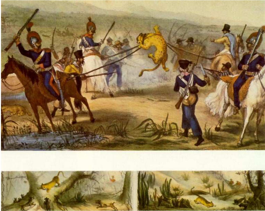
DEBRET, Viagem Pitoresca e Histórica pelo Brasil (1834)