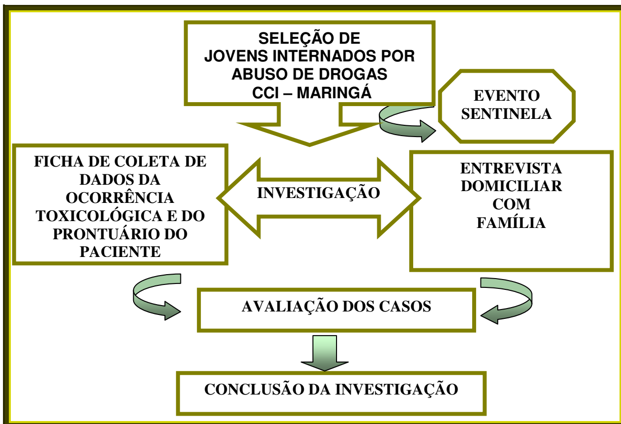
Figura 1: Etapas do processo de investigação do evento sentinela.

A partir do levantamento dos prontuários dos casos selecionados foi preenchido o campo de dados do prontuário hospitalar do roteiro de investigação, enfocando os sintomas apresentados durante a internação, tratamento registrado, diagnósticos médico e evolução clínica. Em seguida, procedeu-se à entrevista com a família.