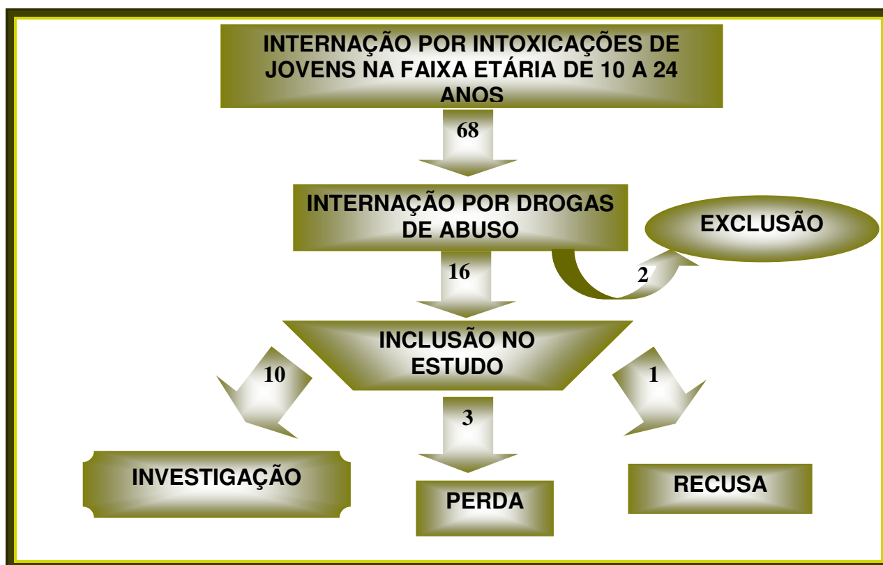
Figura 2: Casos cadastrados no CCI/HUM e definição da população de estudo, fevereiro a julho de 2006.

No período de fevereiro a julho de 2006 foram cadastradas no Centro de Controle de Intoxicações de Maringá 68 internações de jovens na faixa etária de 10 a 24 anos; 16 internados tinham drogas de abuso como os agentes principais da intoxicação (23,5%).