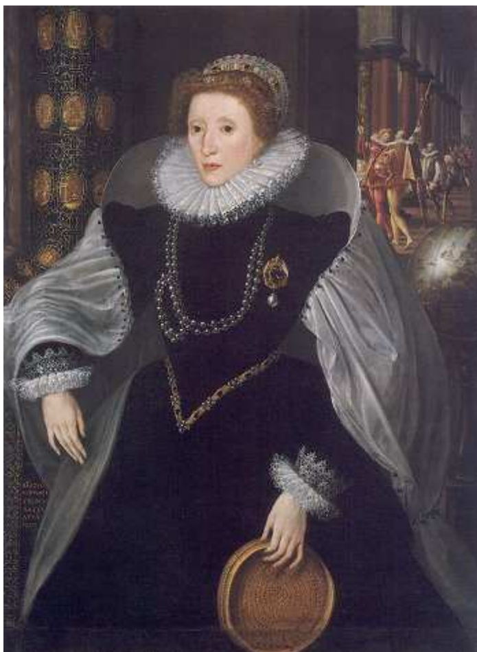
Fig. 07 – Elizabeth I: The Sieve Portrait, c1583, por Quentin Metsys, o Jovem.

Esse retrato foi pintado para representar a pureza e a castidade da “virgin Queen”. A peneira é um símbolo da castidade e a pureza, tomada originalmente do Triunfo da Castidade , de Petrarca. Na história original, uma virgem romana prova sua pureza e castidade ao carregar uma peneira cheia da água sem derramar nenhuma gota. Essa pintura foi usada para reforçar a pureza da “virgin Queen”, visto que ela era constantemente cortejada por príncipes estrangeiros e inclusive por seus súditos. A imagem da “rainha virgem” era um modo de prevenir a tomada do poder de Elizabeth, mas, ao mesmo tempo, provocava desconforto e angústia de seus súditos, pois viam a possibilidade de a Inglaterra ficar sem um sucessor e o perigo de uma guerra civil era iminente.