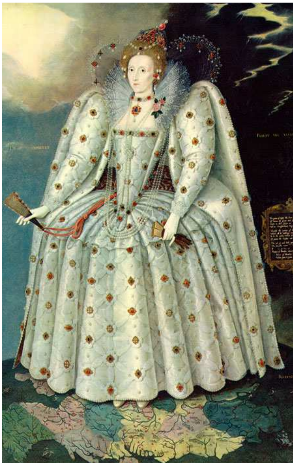
Fig. 01 – The Ditchley Portrait, c1592, por Marcus Gheeraerts, o Jovem.

Fonte: http://www.marileecody.com/gloriana/elizabethditchley.jpg