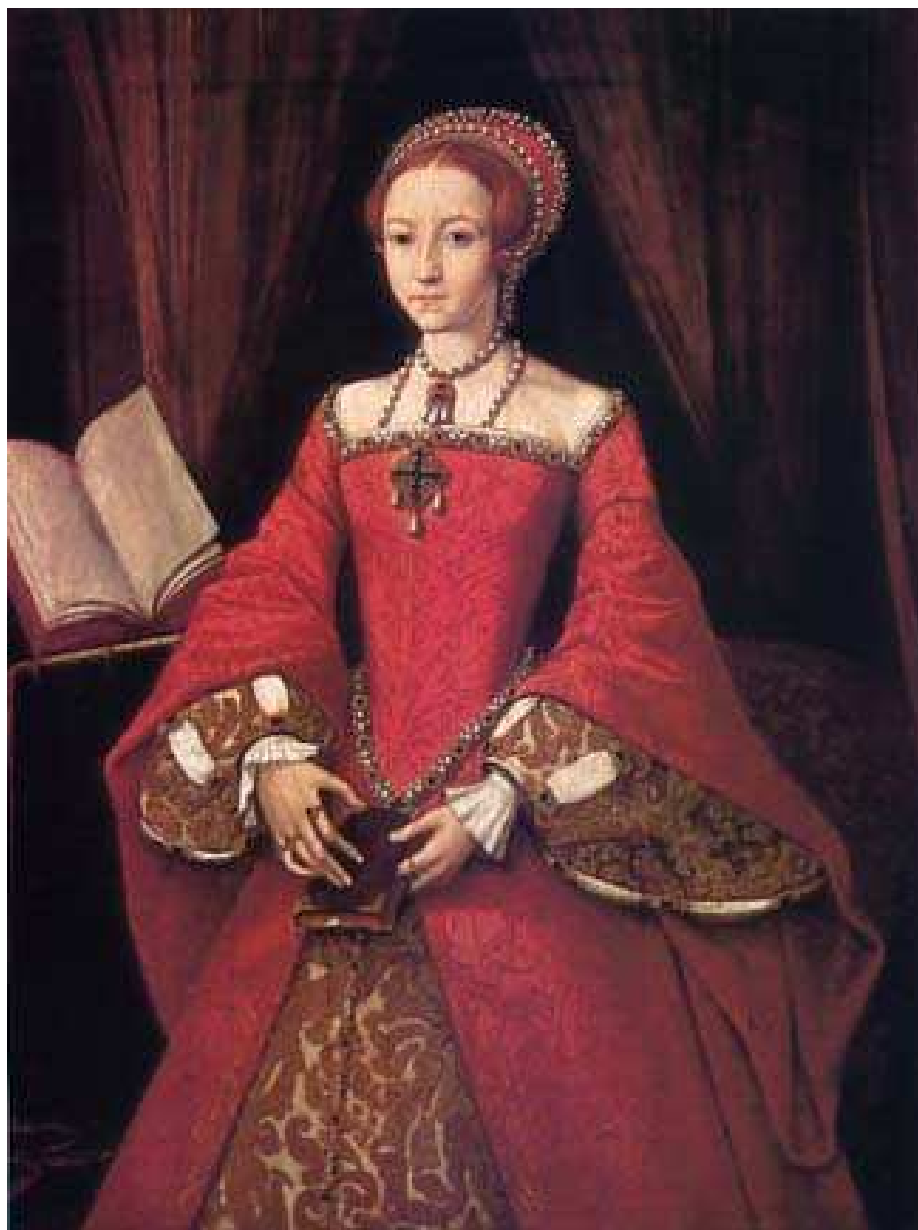
Fig. 08 – Princess Elizabeth , c1546, por William Scrots.