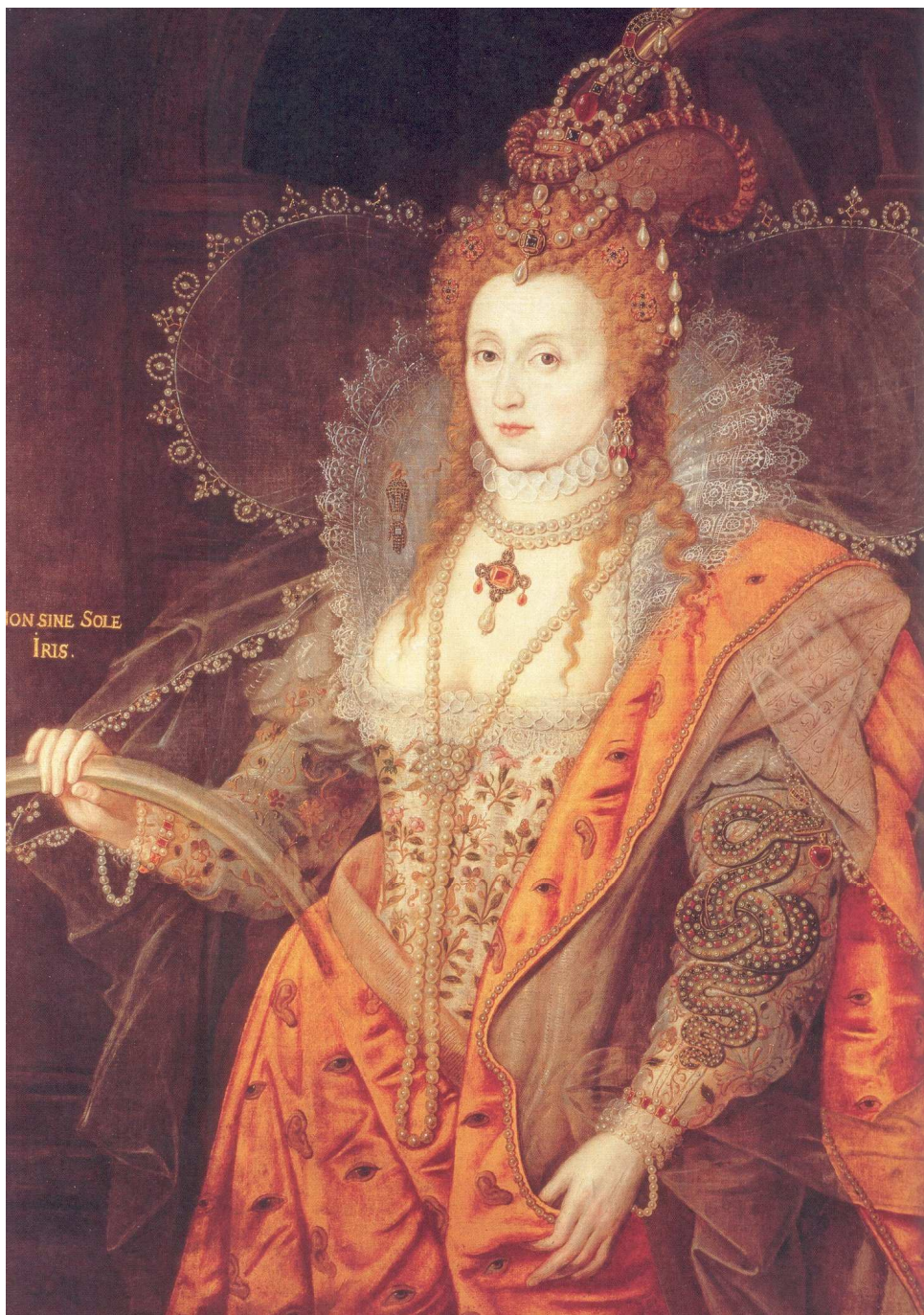
Fig. 02 – Elizabeth I: The Rainbow Portrait , c1600, por Isaac Oliver.