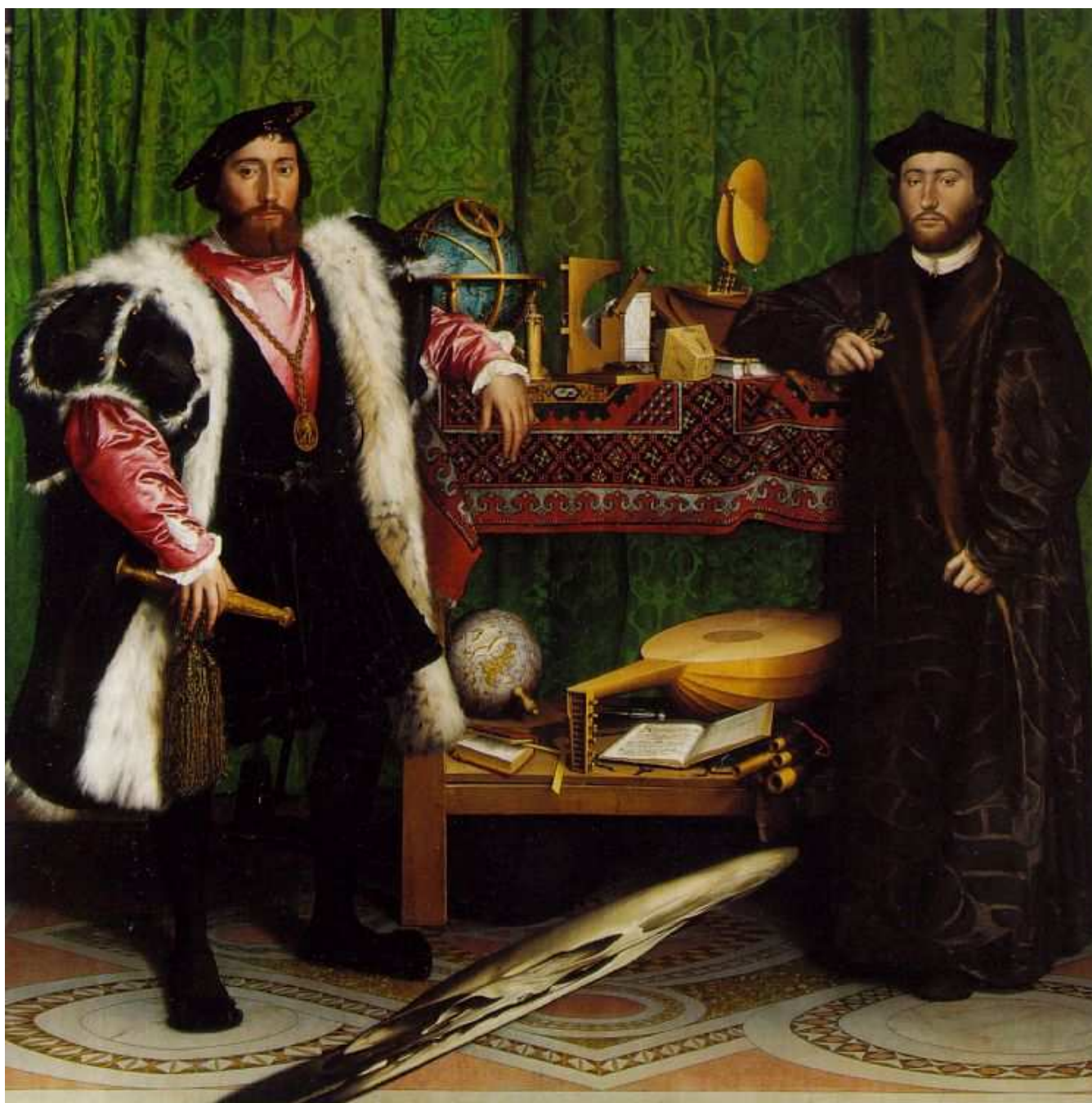
Fig. 09 – The Ambassadors , pintado por Holbein, em 1533.