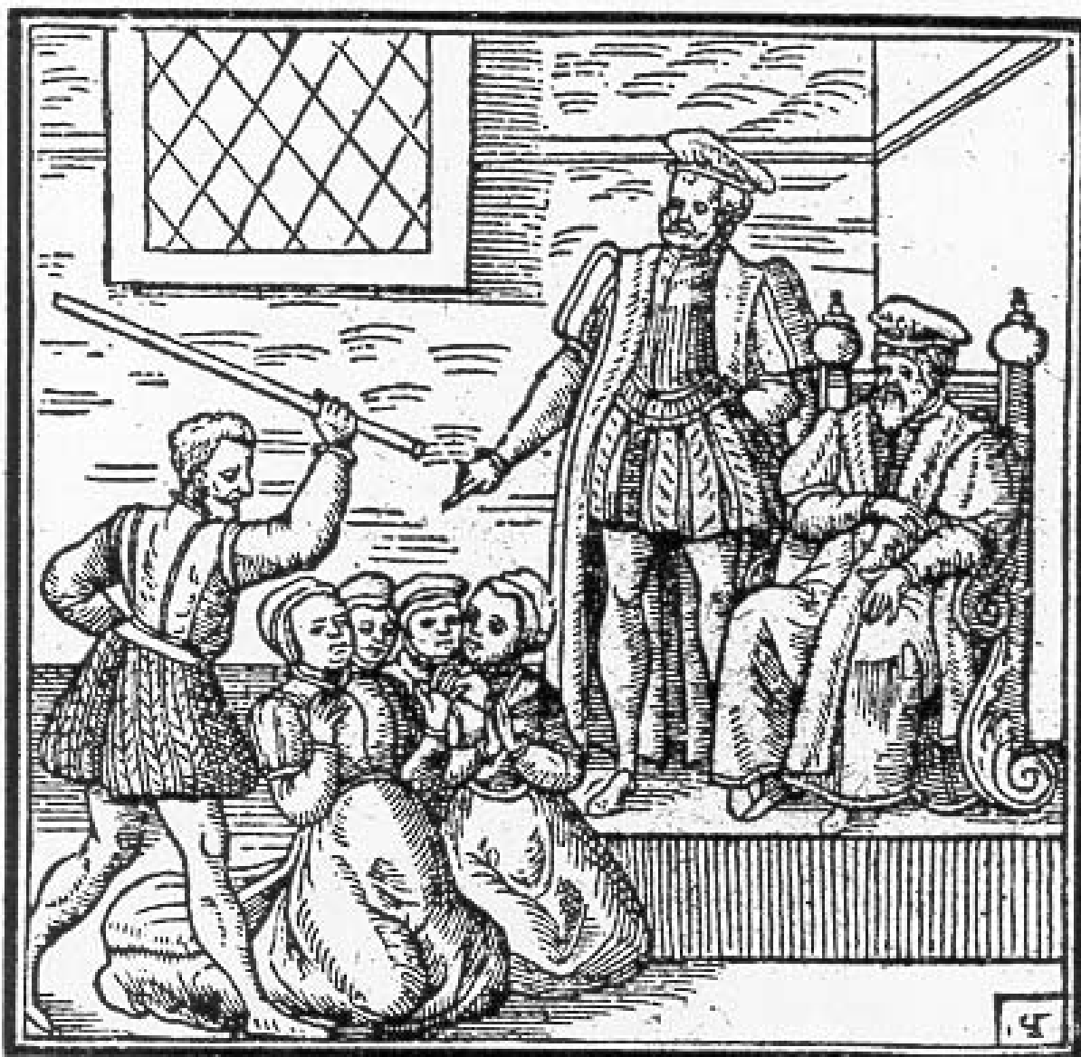
Fig. 06 – James I e a caça às bruxas

Um grupo de mulheres acusadas de bruxaria diante do rei James. O rei se interessava bastante pelos problemas da bruxaria, que escreveu um estudo chamado Daemonologie . Nota-se aqui uma configuração ambígua em relação aos corpos das bruxas, visto que são apenas dois corpos e quatro cabeças, o que sugere, de certa forma, a concepção da época de anormalidade em relação às descrições físicas relativas às bruxas.