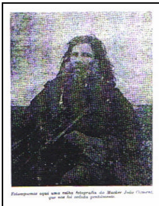
O FERRABRAZ , 01 mar, n.129.p.5.