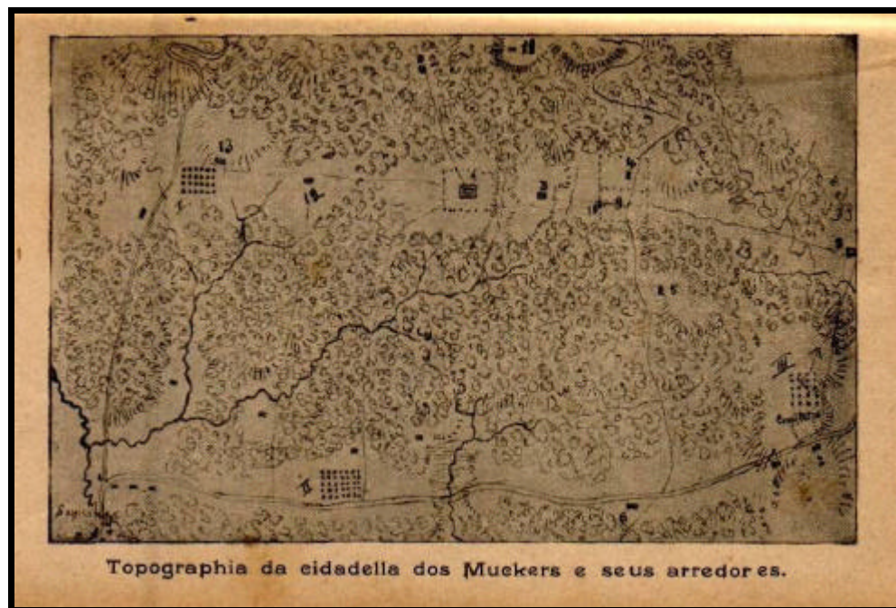
SCHUPP, Ambrósio. Os Muckers . 2 ed. Porto Alegre: Selbach & Mayer, s/d. p. 373.

Descrito como uma região de vegetação densa e de difícil acesso, a cidadella dos Mucker representava a resistência aos valores defendidos pelos demais moradores da localidade. Ao mesmo tempo, a cidadella representava uma ameaça à segurança dos moradores, que passaram a ver a casa do casal Maurer como uma espécie de “fortaleza” armada no Ferrabraz.