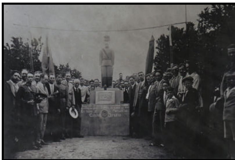
Acervo Museu Municipal de Sapiranga

O ato de inauguração pode ser reconstituído através da fotografia que ilustra a página abaixo 333 . Através dela, podemos observar que o ato de inauguração do monumento contou com a participação de diversas pessoas da comunidade sapiranguense, além das autoridades anteriormente nomeadas.