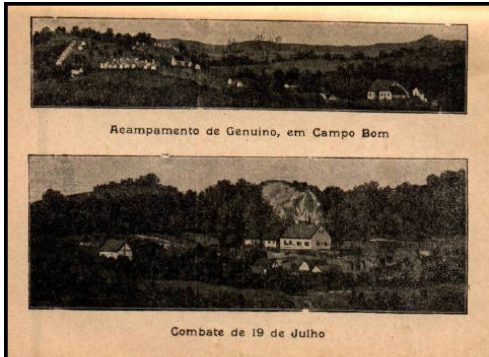
SCHUPP, Ambrósio. Os Muckers . 2 ed. Porto Alegre: Selbach & Mayer, s/d, 329.

Peter Burke 188 lembra-nos de que as imagens exercem um papel fundamental na construção dos imaginários sociais, na medida em que apresentam ao público um determinado ponto de vista, um ângulo, a partir do qual a imagem procura mostrar uma determinada realidade.