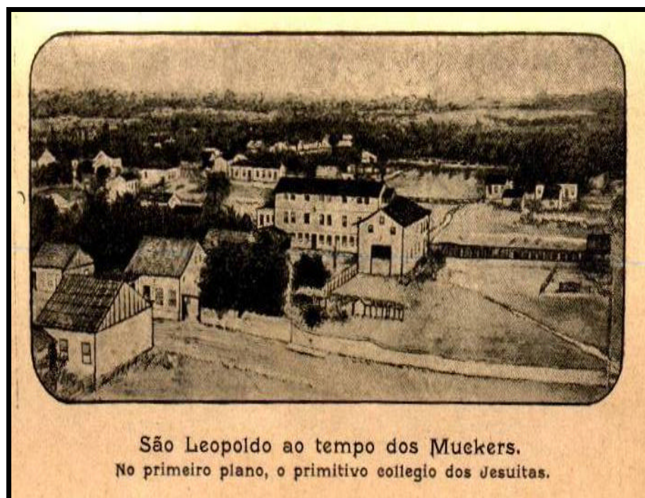
SCHUPP, Ambrósio. Os Muckers . 2 ed. Porto Alegre: Selbach & Mayer, s/d, p. 25.

Outra leitura possível dessa imagem seria a de representar a posição contrária aos Mucker. Enquanto as representações do Ferrabraz procuravam evidenciar o caráter obscuro e fanático dos Mucker, a representação do colégio dos jesuítas procurava mostrar o lado “civilizado” de São Leopoldo, com a presença dos jesuítas na região.