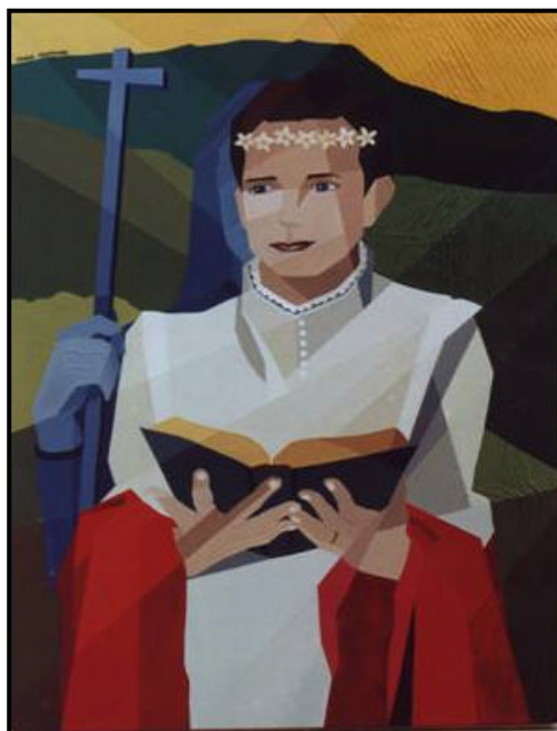
JACOBINA (óleo sobre tela com textura acrílica – 50x70cm)

Sobre Jacobina, a artista produziu três obras, sendo que as duas primeiras pinturas são, atualmente, os dois únicos trabalhos artísticos registrados sobre a líder dos Mucker. O registro foi feito no MARGS - Museu de Arte do Rio Grande do Sul, que tem o direito sobre suas imagens.