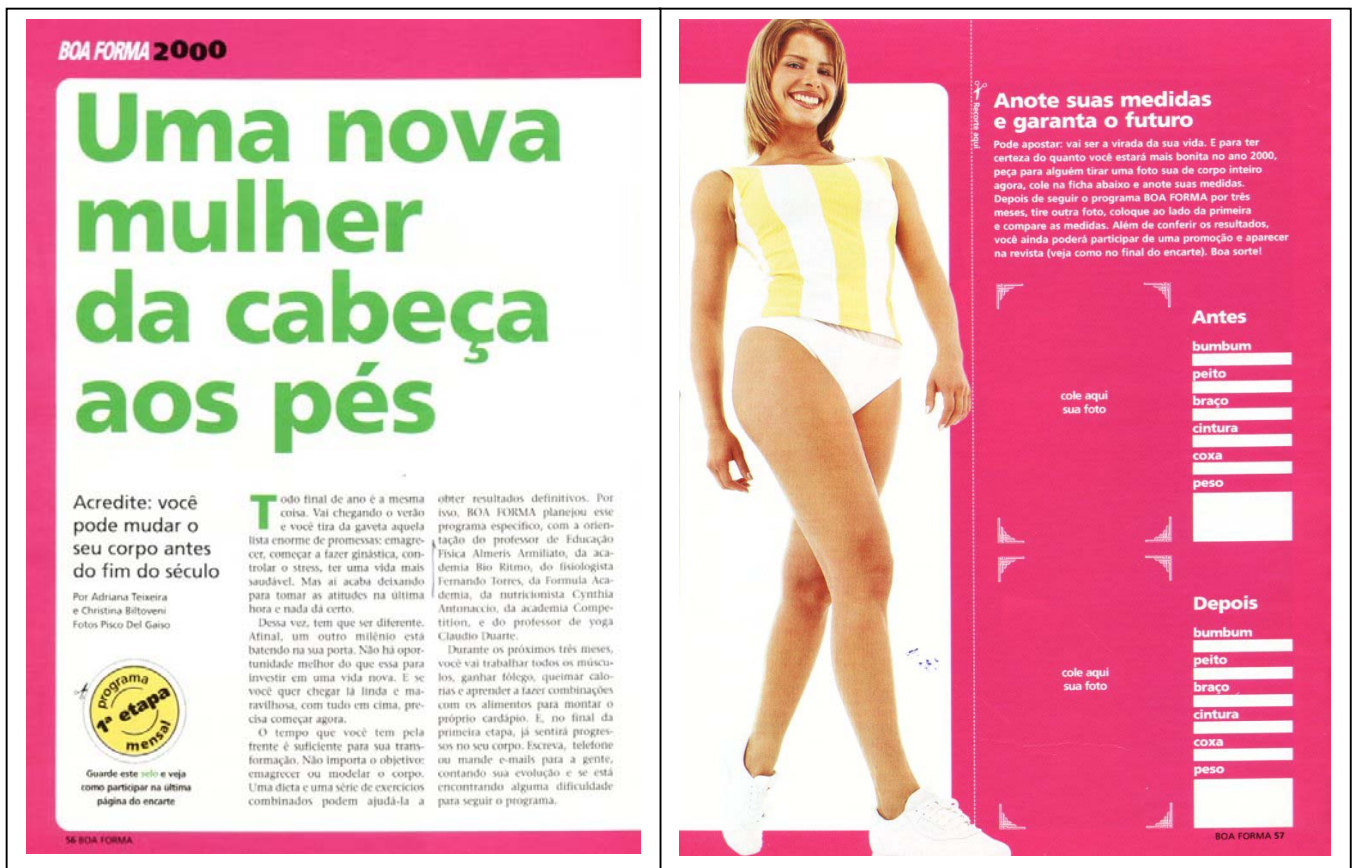
FIGURA 1 – Uma nova mulher da cabeça aos pés

Fonte: TEIXEIRA; BILTOVENI, 1999, p. 56.