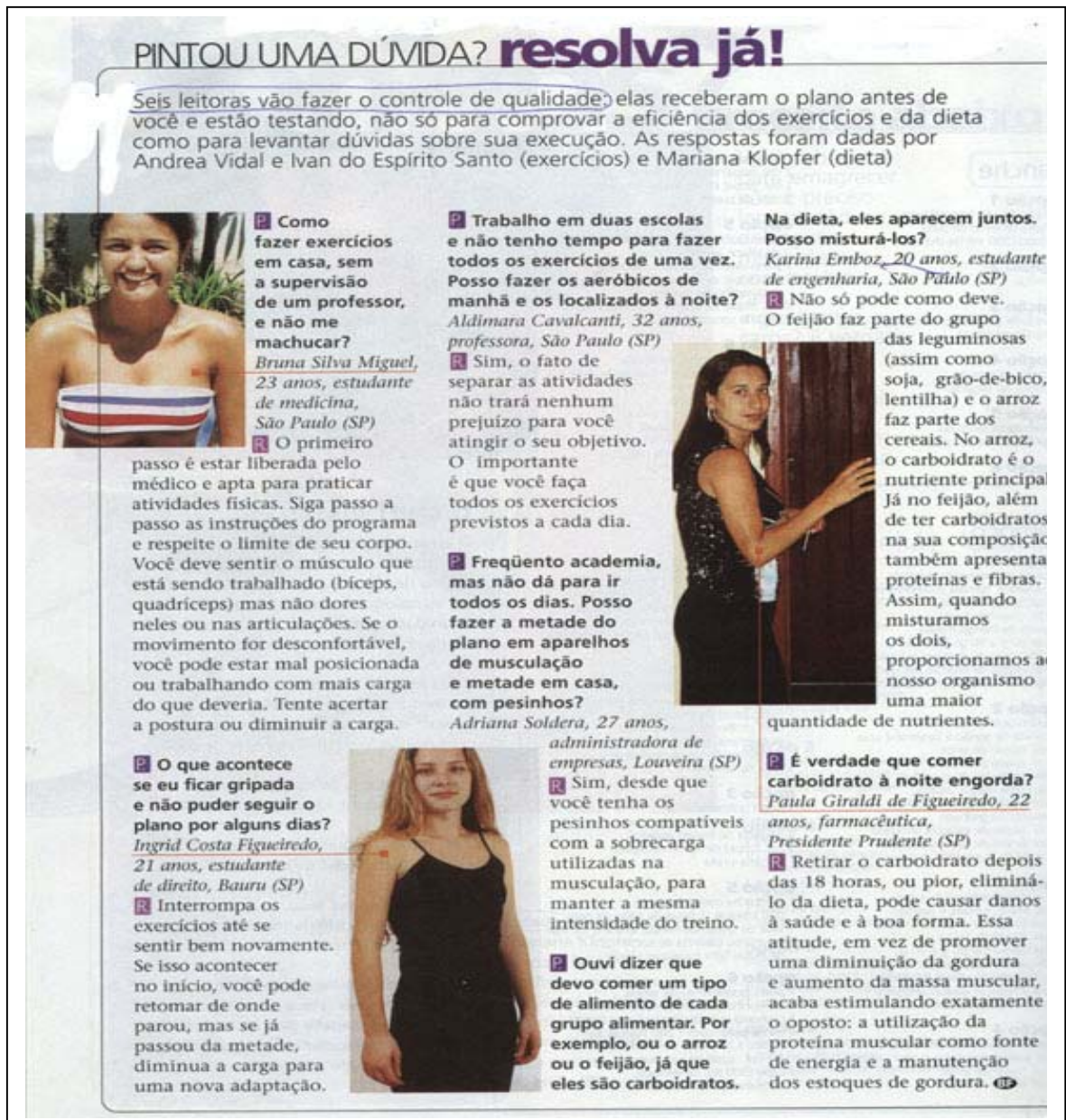
FIGURA 5 – Pintou uma dúvida? resolva já!