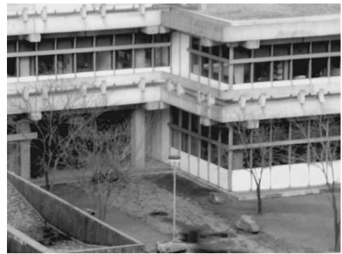
Figura 2.3: Imagem original - prédio

Esta aplicação a teoria clássica tem como objetivo ilustrar o método investigado com funcionais que são aplicados na prática, assim como na próxima subseção. Não vamos nos ater a detalhes de convergência e demais comparações. Para maiores detalhes veja [BO04, Res05].