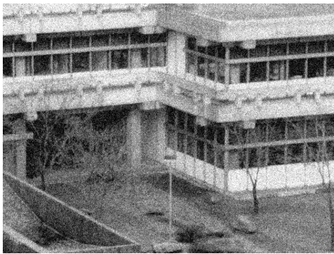
Figura 2.2: Exemplo imagem com ruído

Essa técnica é aplicada como uma ferramenta favorável para problemas de processamento de imagem, uma vez que ela permite a reconstrução de soluções com descontinuidades. Um destaque para essa aplicação é a reconstrução de imagens com ruído. Em inglês esse processo é chamado de denoising .