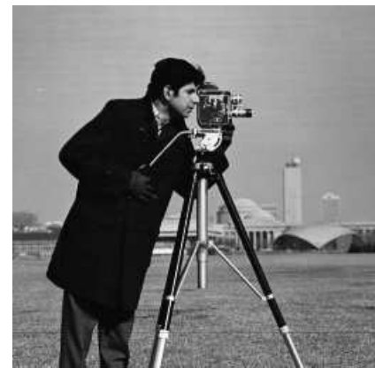
Figura 4.2: Imagem original - fotógrafo

Para os próximos resultados consideramos um operador não linear F tal que \mathcal{D}(F) \subseteq L^2(\Omega) e \Omega \subset \mathbb{R}^n é um domínio Lipschitz limitado. Definimos o funcional de penalização convexo como