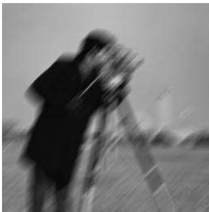
Figura 4.1: Exemplo imagem borrada

Um interesse em particular é o tratamento de imagens tremidas, borradas ou embaçadas. Em inglês o processo para a correção de tais efeitos é conhecido como deblurring .