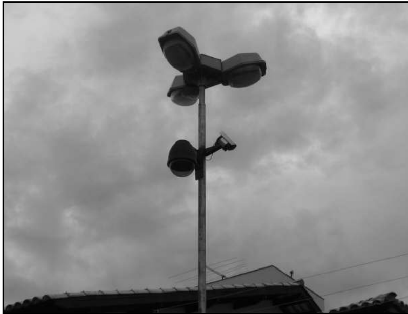
Câmeras instaladas em uma rua da cidade, próxima há uma praça.

A auto-segregação é na verdade uma solução escapista. Se de um lado, os condomínios exclusivos ou os “pseudocondomínios” prometem resolver os problemas de segurança dos indivíduos de classe média e alta, de outra parte deixam intactas as causas da violência e da insegurança cotidiana. Antes, contribuem para o esfacelamento da sociabilidade, civilidade, qualidade de vida. Esses espaços pressupõem um descompromisso para com a cidade como um todo.