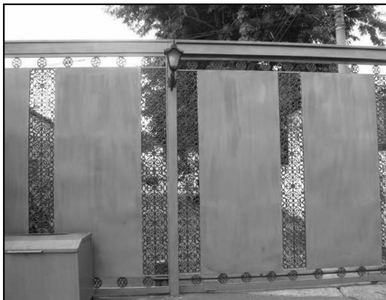
Rua fechada com portão no Setor Bueno Rua privatizada há 15 anos

Em alguns bairros de classe média e alta da cidade de Goiânia os moradores privatizaram ruas públicas, fechando seu acesso com portões, correntes e guaritas. A medida é aprovada tanto pelos moradores das ruas já fechadas quanto por moradores de ruas e bairros vizinhos que acreditam que o fechamento das ruas significa segurança e proteção à medida que inibe a circulação de pessoas estranhas nestes espaços e limitam o contato das pessoas que residem nestas ruas com os transeuntes. Além do cercamento e vigilância das ruas dos bairros de classe média e alta da cidade, existem exemplos de “praças privatizadas” nesses setores que contam com vigias particulares contratados pelos moradores. As narrativas ilustram a satisfação dos moradores com o cercamento dos espaços.