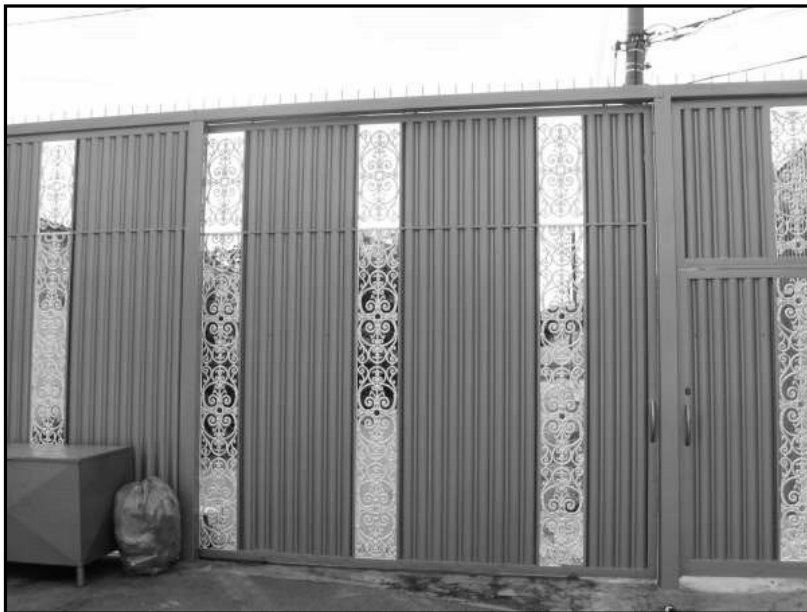
Exemplo de outra rua fechada com portão também no setor Bueno A rua foi privatizada há cinco anos

"- Tem uns 15 anos que nós fechamos aqui. Virou um condomínio. Ai, ficou tranquilo, os carros dormem na rua e tal. Tinha roubo de carro, toca fita, uso de drogas, era meio complicado, e assim que fechou, ficou bem mais seguro. Depois não teve mais problema não. Muitas pessoas de outros setores nos procuraram, muita gente mesmo, querendo fazer o mesmo nas suas ruas." (Empresário, 43 anos, morador de uma rua fechada no setor Bueno)