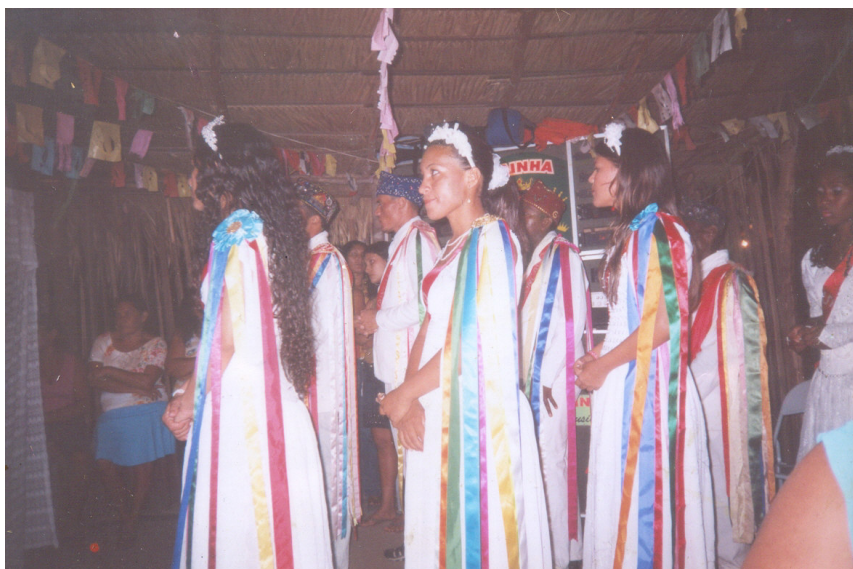
Foto 3 - Dançantes se preparando para iniciar o representamento do baile. Pereira.Paulo Sérgio Castro

No princípio do baile , antes da fala inicial do guia, este se posiciona entre as duas cortinas para iniciar o ritual e somente após estas terem sido removidas (conforme versos acima), os dançantes se dirigem até o altar dançando.