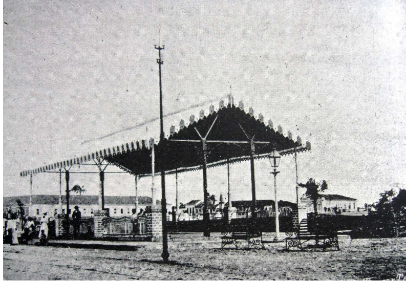
Figura 6 - Mercado de frutas