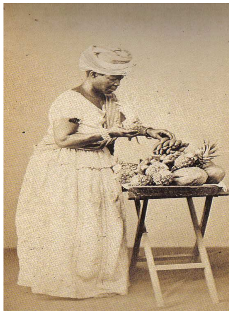
Figura 7 - Sem título

arrumava as frutas de seu tabuleiro, entre elas destacam-se bananas e abacaxis. Percebe-se, ainda, a simplicidade do engenho, digo, do tabuleiro, formado por uma tábua de madeira com suporte do mesmo material.