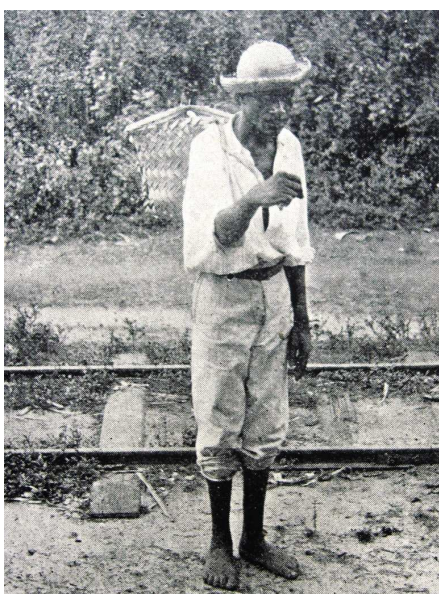
Figura 8 - De volta da cidade

Assim, o trabalhador “de volta da cidade” que aparece na fotografia publicada na Revista do Norte em inícios do século XX, pode ser tomado como ilustrativo do elo entre esses dois espaços. De aspecto simples, pés descalços e corpo franzino sobre o qual apóia o cofo, que provavelmente volta abastecido de gêneros da cidade, esse trabalhador certamente realizou alguma atividade importante para o funcionamento da cidade “civilizada”, que, não obstante faz questão de mantê-lo distante.