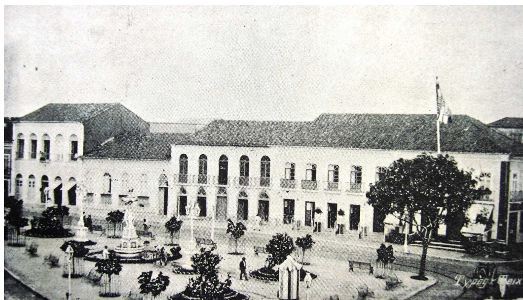
Figura 2 - Praça João Lisboa

A fotografia a seguir, em que se vê a Praça João Lisboa, localizada no centro da cidade, poderia ser tomada como um retrato da cidade que a elite local desejava, ou seja, limpa, urbanizada e com aspecto europeu, que os chafarizes se encarregavam de produzir.