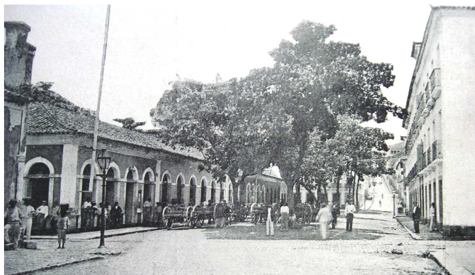
Figura 9 - Praça do comércio