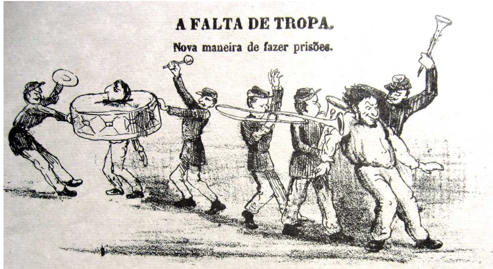
Figura 5 - A falta de tropa

impor a ordem, de tal forma que a população se via obrigada a usar de outros meios para garantir a tranqüilidade pública.