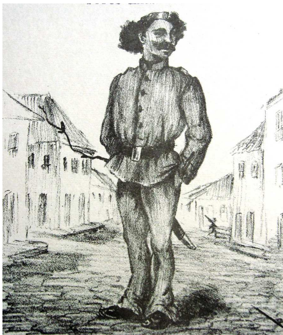
Figura 4 - O urbano