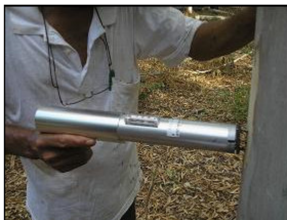
Figura 2. Mensuração da resistência à penetração na madeira de Eucalyptus camaldulensis , com aparelho Pilodyn Wood Tester .