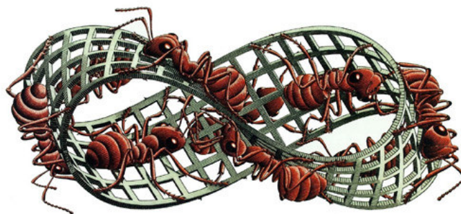
Figura 2 - Fita de Moebius 79

Por outro lado, se se pensar a subjetividade como um processo de singularização, ela não está nem do lado de dentro, nem do lado de fora. A subjetivação é um movimento que habita o dobrar-se da linha. Isto se dá como na fita de Moébius (ver figura 2), em que não se pode mais separar o dentro do fora. Apenas podemos dizer que existe uma superfície que, ao dobrar-se, cria desacelerações no caos da imanência.