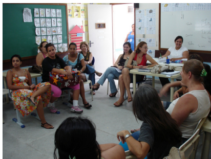
Desenvolvimento do Grupo Focal