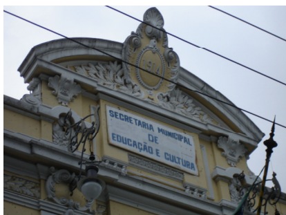
Prédio da Fundação e Secretaria Municipal de Educação de Niterói