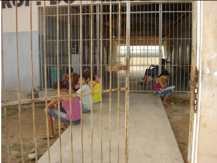
Foto 04: Entrada da Escola Municipal Prof. Alice Feitosa no povoado Ilha do Ouro