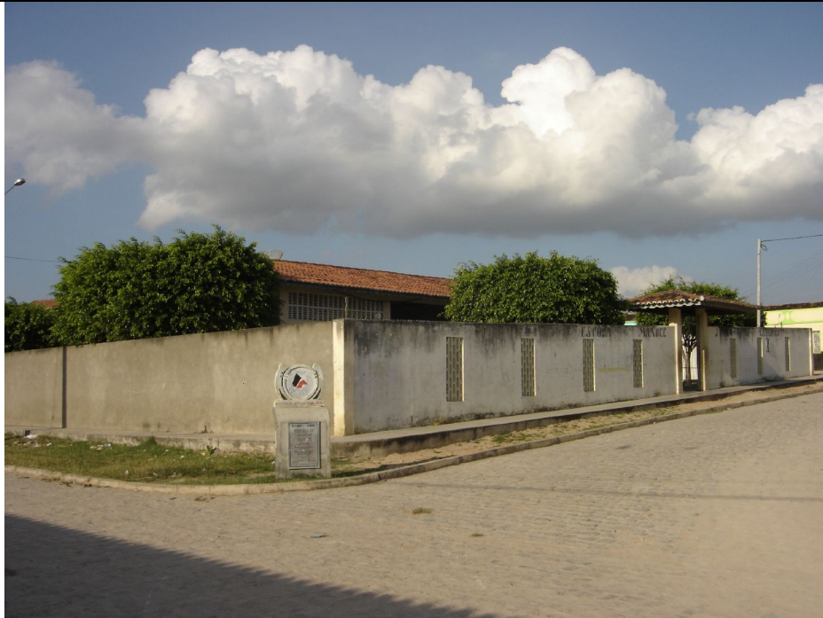
Foto 02: Escola Municipal Manoel Jovito de Santana no povoado Lagoa da Volta