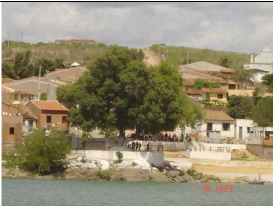
Foto 05: Vista do povoado Ilha do Ouro a partir do Rio São Francisco