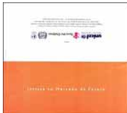
Figura 5. Lado externo folder para

Diferentemente do que vimos no folder da seção anterior, a peça voltada aos empresários apresenta mais claramente a relação das adolescentes mencionadas com o trabalho infantil doméstico e é mais enfático ao ressaltar problemas do TID. Desse modo, o texto procura sensibilizar os leitores para o enfrentamento do trabalho infantil doméstico, que é relacionado a agressões, exploração, humilhações, “tratamento desumano” e constrangimentos. O texto mostra ainda que, apesar de esses serem “objetivos concretos” de meninas domésticas, o dia-a-dia do trabalho em casas de família acaba afastando-as desse desejo: