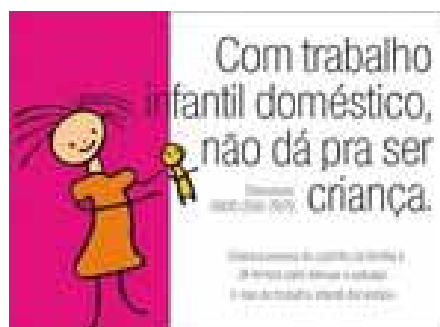
Figura 10. Anúncio embalagem.

O anúncio divulgado nas embalagens de biscoito e farinha de trigo da empresa Ocrim S/A, apresenta o desenho da menina com a boneca e a mensagem tema da segunda fase: “Com trabalho infantil doméstico, não dá pra ser criança”. Dessa forma, há uma nova combinação entre imagem e texto. Já não é mais a foto do café da manhã que acompanha esse texto, mas sim o desenho que se tornou símbolo do próprio Programa.