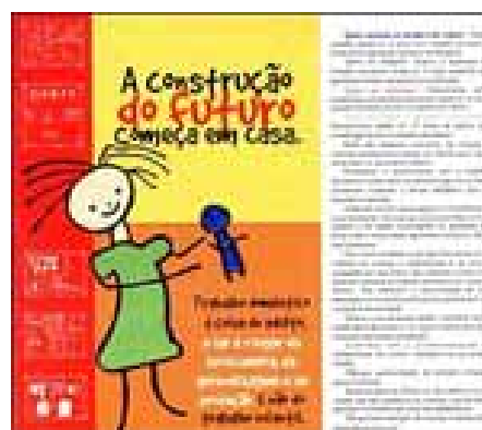
Figura 6. Lado interno folder para empresários.