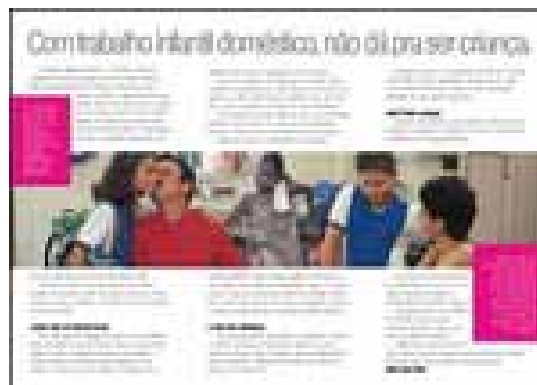
Figura 9. Folder 2ª fase parte interna.

Ao propor esse movimento, o Petid objetiva romper com a situação de “invisibilidade” social das crianças e adolescentes trabalhadoras domésticas, estimulando que os leitores do folder se coloquem no lugar do outro. Assim, é possível examinar a situação a partir da perspectiva desse outro, no caso a menina, e isso colabora com o deslocamento de perspectiva na medida em que surge um elemento crítico, perturbador das rotas convencionais de produção de sentido.