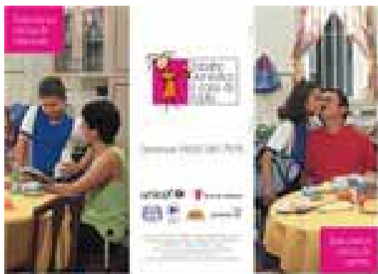
Figura 8. Folder 2ª fase parte externa.

A primeira página do folder mostra o pai beijando o rosto da filha e o texto em destaque é “Toda criança precisa de carinho” (situação 1). A página seguinte apresenta a mãe mostrando um livro para o filho e o texto que acompanha a foto é “Toda criança precisa de educação” (situação 2). Essas são duas afirmações que, normalmente, todas as pessoas tendem a concordar. Criança precisa de carinho e educação. No entanto, quando abrimos o folder por completo, deparamo-nos com uma menina em preto e branco, que não está nem na situação 1, nem na 2. Pelo contrário, ela parece estar afastada de todo o resto. Ora, se todas as crianças precisam de carinho e estudo, quem é aquela menina que está ali?