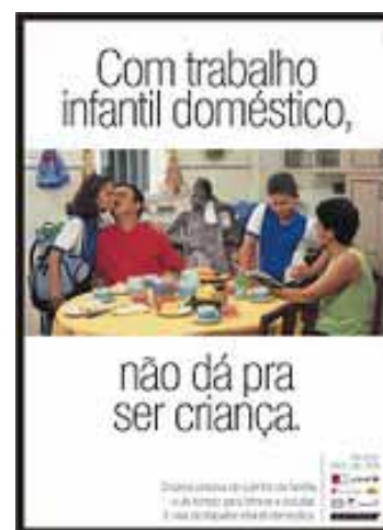
Figura 7. Cartaz 2ª fase.

A nova configuração visual se relaciona muito bem com o título do cartaz: “Com o trabalho infantil doméstico, não dá pra ser criança”. Dessa forma, podemos entender que o trabalho infantil doméstico exige responsabilidades que não são apropriadas ao tempo da infância, portanto, há uma incompatibilidade entre “trabalho” e “ser criança”. Além disso, a partir dessa frase o Petid pretende mostrar também que o trabalho infantil doméstico não é