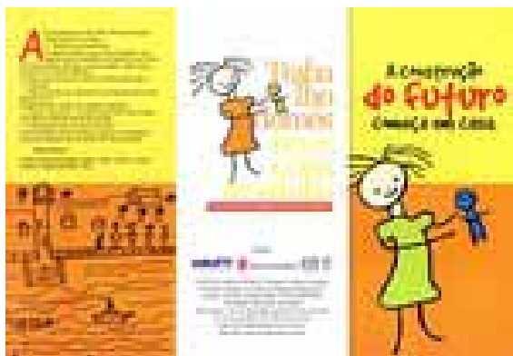
Figura 3. Lado externo do folder geral.

família”. O TID, portanto, é apresentado como uma condição essencialmente negativa. No entanto, não são discutidas ou apresentadas as razões que motivam essa saída para o trabalho doméstico ou, ainda, a situação de vida dessas meninas em seus municípios de origem.