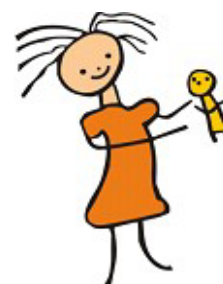
Figura 1. Desenho símbolo do Petid.

A primeira fase da campanha teve como objetivo geral a apresentação do problema do trabalho infantil doméstico. Produzida