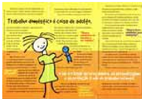
Figura 4. Lado interno do folder geral.

No folder, o trabalho infantil doméstico é apresentado também como uma violação de direitos e uma forma violência: