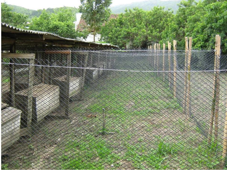
Figura 3. Área experimental mostrando as parcelas dispostas lado a lado.