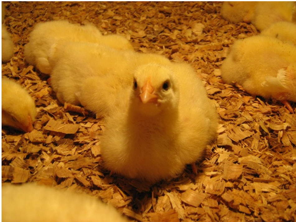
Figura 4. Pintinhos no pinteiro aos seis dias de vida.