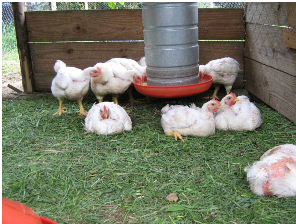
Figura 5. Aves nas baias aos 38 dias de vida.