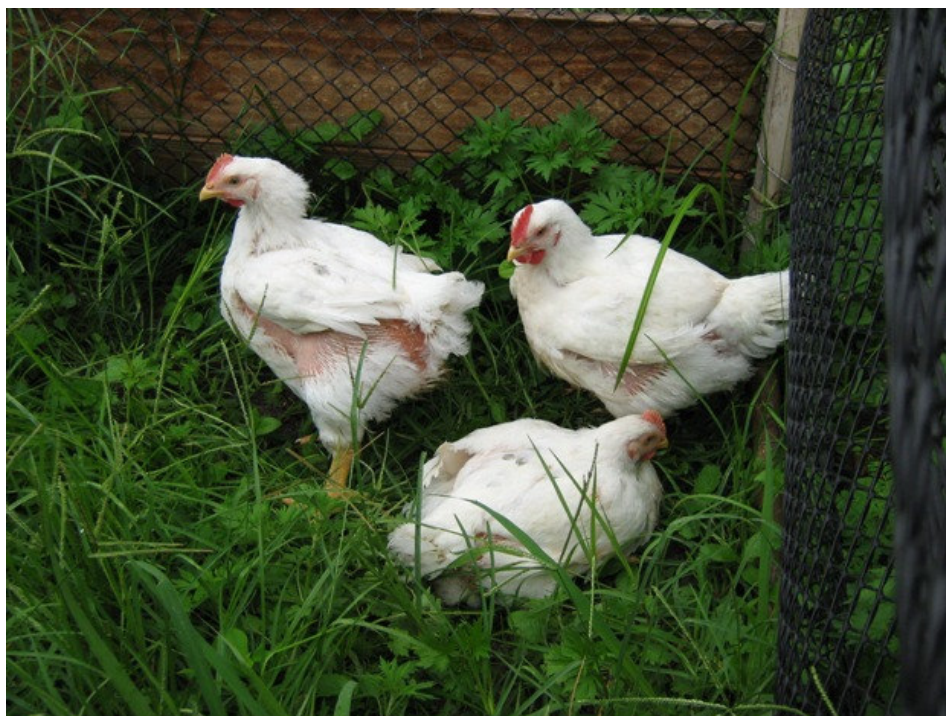
Figura 6. Aves na área de pasto aos 43 dias de vida.