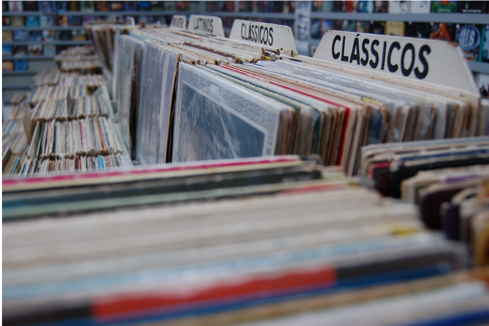
Figura 1: Foto da Loja 1

Sabe com quantos CDs eu comecei a loja? 38! 38 CDs! Tenho até foto para documentar. Tem muita coisa que eu compro e fico por 4, 5 anos sem vender. O giro é muito baixo. Mas é assim, eu tenho que comprar, porque se eu não comprar eu não tenho o que vender, né? (LUÍS)