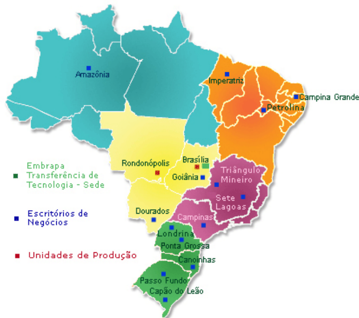
Figura 4: Distribuição da Embrapa Transferência de Tecnologia no Brasil

A Embrapa Transferência de Tecnologia com sede no Distrito Federal está distribuída em 14 Escritórios de Negócios e duas Unidades de Produção, instaladas, estrategicamente em todas as regiões geográficas do Brasil, conforme figura 4, formando uma grande rede que valida, demonstra e transfere conhecimentos e tecnologias produzidas pelos Centros Nacionais de Pesquisa.