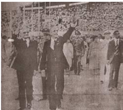
Fig 6 –Foto para o Jornal o Progresso, tirada do General Ernesto Geisel durante a partida de futebol, realizada depois da posse do governador Harry Amorin da Costa e todos os Constituintes em 1 de janeiro de 1979.

Outro ponto marcante é que esses profissionais acabam sendo educadores dos filhos dos outros, mas, em compensação, perdiam a sua própria família. Esta carta não tinha como função influenciar o governador, Cássio Leite, mas, sim, Harry Amorin Costa. Diante disso, é importante mencionar, neste momento, que outras cartas foram enviadas para o novo governo. Essas vieram de Amambai, Aquidauana, Dourados.