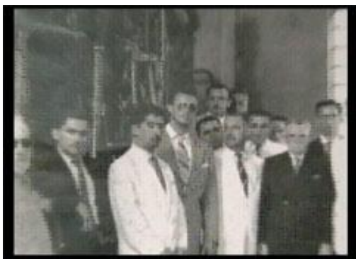
Fig 5 - Senador Filinto Müller e representantes do governo e da população douradense, no churrasco de inauguração na própria Usina

Em entrevista ao documentário “Do Sonho à Ruína”, Ercília de Pompeu (2006) descreve que a cidade de Dourados começou a ter um papel mais determinante na história de Mato Grosso, quando chegou a usina velha. Essa usina foi um ponto referencial, e Filinto Muller a quem ela chama de herói e de lutador é responsável pela instalação de tal usina.