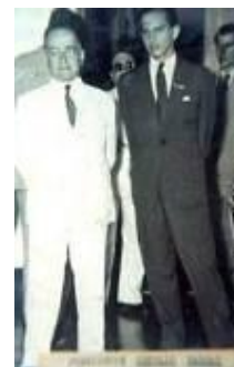
Fig 3 -Getúlio Vargas e Weimar Gonçalves Torres, 1943. Fonte Acervo Museu Histórico de Dourado IN: Arakaki (2006).

Foi através da lei nº 658, de 1914, que Dourados foi transformado em distrito do município de Ponta Porã. Em 1920, Dourados recebe a agência de Correios e Telégrafos dando assim um dos primeiros passos para o seu desenvolvimento. Com isso, a cidade, através do