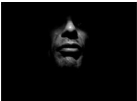
Fig 10 -O pior analfabeto é o analfabeto político imagem de Carlos Latuf

E aprende a construir todas as suas estradas no hoje, porque o terreno do amanhã é incerto demais para os planos, e o futuro tem o costume de cair em meio ao vão. Depois de um tempo você aprende que o sol queima se ficar exposto por muito tempo. Willian Shakespeare.