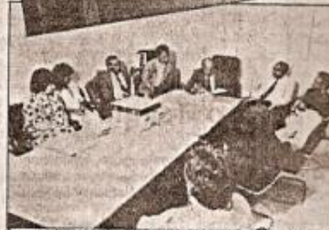
Governador recebe e analisa o projeto da Fundação pró-U.I.L.A.

que deriva das transformações das matérias-primas agropecuárias. Na oportunidade, disse que o núcleo deve adequar uma estrutura que seja eficiente na abordagem dos problemas agroindustriais do Estado. Esses problemas, segundo ele, seriam temas de pesquisas realizadas pela própria Fundação.