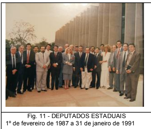
Fig. 11 - DEPUTADOS ESTADUAIS 1º de fevereiro de 1987 a 31 de janeiro de 1991

A foto ao lado apresenta os deputados apresentados na tabela, o que mais chama a atenção nesta legislatura e o número de deputadas, que teve um crescimento considerável.