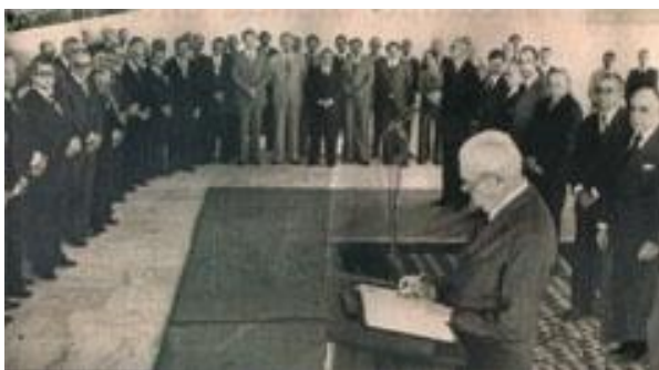
Fig 2- Assinatura da Lei Complementar nº 31, de 11 de outubro de 1977

Várias histórias se entrelaçam na construção da política sul-mato-grossense, durante o período de 1979 a 1992. Entre elas podemos citar as desavenças entre Norte-Sul e os embates entre as diferentes forças políticas regionais no contexto de um Golpe Militar.