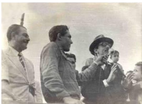
Fig 1 -Jânio Quadros, João Ponce Arruda e Juarez Távora, durante a campanha presidencial de 1960. No comício realizado no aeroporto de Dourados.

Em 1958, o PDS, o PTB, a UDN e o PSP enviaram um projeto de lei para Cuiabá tentando a divisão. Porém, a Constituição de 1956 exigia que fosse feito um plebiscito, mas o assunto acabou na mesa do governador João Ponce de Arruda que não deu prosseguimento à questão.