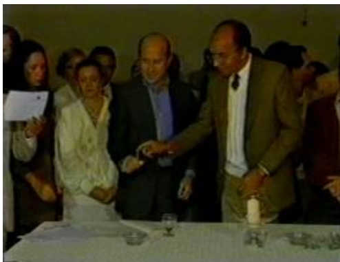
Fig 12 -Assinatura da posse da comissão da UILA

Esse trabalho áudio-visual traz uma descrição dos estudos realizados para identificar as potencialidades da região de fronteira, e apresenta o estado de Mato Grosso do Sul como uma esperança na produção agropecuária. No início do vídeo, o governador Marcelo Miranda faz a seguinte explanação: "Tenho a convicção que esta universidade poderá extrapolar as fronteiras nacionais e servir de fonte para políticas culturais com os países vizinhos, Paraguai e Bolívia", demonstrando seu apreço pelo projeto e o seu total apoio.