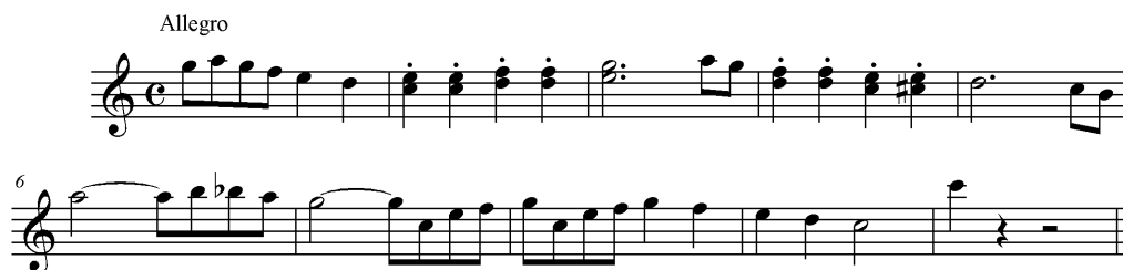
Figura 8 - Alunos “F” e “H” (improvisação livre)

A improvisação de F e H constou apenas de uma variação melódica tocada por ambos, dobrada a intervalo de oitava. Inserimo-la no MODO VERNACULAR, pois os alunos se utilizaram de motivos rítmicos e melódicos bem previsíveis, como as semínimas repetidas em staccato e o desenho cromático nas colcheias. A composição, bastante interessante, mostrou um