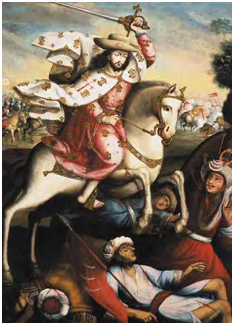
Figura 2 – Santiago Matamoros