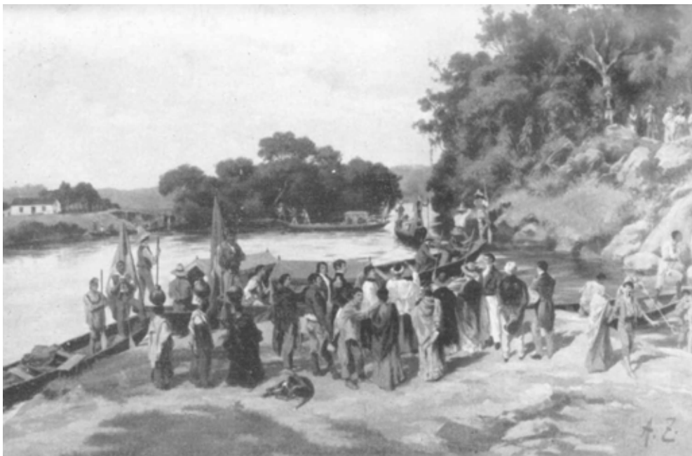
Bênção das canoas de uma monção pelo vigário de Porto Feliz. Óleo de Aurélio Zimmermann – Ap. de Hércules Florence – (Galeria do Museu Paulista). Fonte: TAUNAY, op. cit.; p. 143.