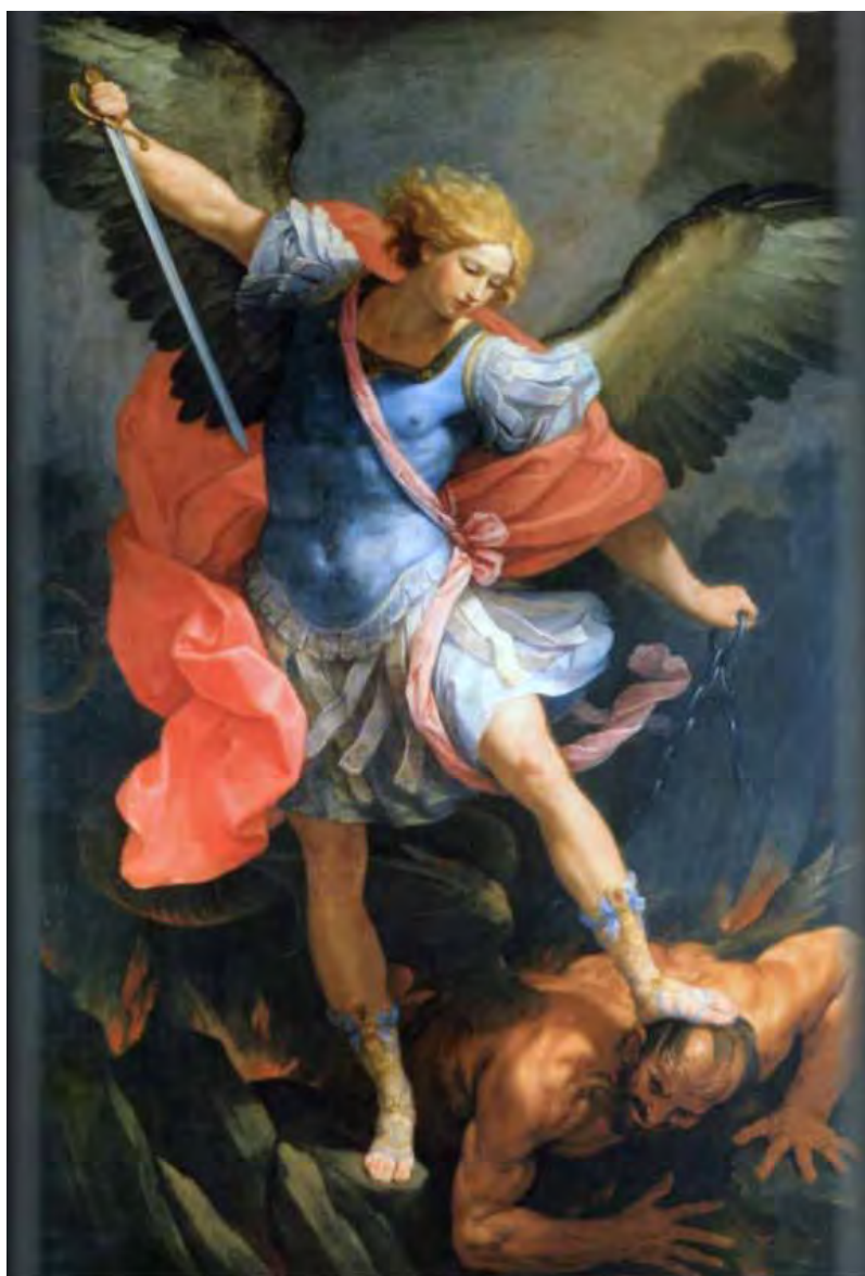
Figura 3 – Arcanjo Gabriel (pintura de Guido Reni)