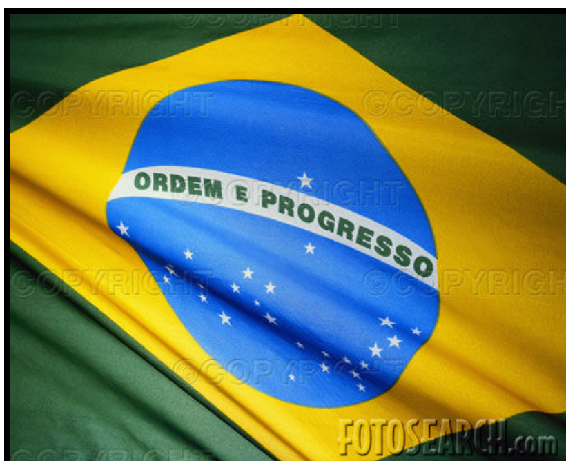
Imagem 7 – Bandeira Nacional.

Auxilia esta postura, o fato de que, nas democracias, o poder dá tributo aos valores, os quais são rememorados pela tradição. Tal situação deve-se ao fato de que os homens nos negócios públicos, ou seja, na política, querem ser conduzidos por imperativos morais, que, pelo paradigma racionalista, significa os imperativos que resultam da boa razão. Logo, a correção do discurso para ajustá-lo à prática pode ser percebida como resultante do progresso, que, pelo menos teoricamente, conduz a um mundo melhor. Uma idéia selada no símbolo maior da identidade brasileira.