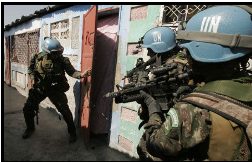
Imagem 6.2 – Peacekeepers brasileiros procuram por membros de gangues. Bois Neuf, Cité Soleil, Port-au-Prince, Haiti. 28 de fevereiro de 2007.

estritamente em autodefesa. A natureza do mandato da MINUSTAH implica necessariamente no emprego de operações táticas ofensivas, como, por exemplo, a procura de membros de gangues hostis aos civis envolvidos em atividades humanitárias. A seguinte foto disponibilizada na página oficial da ONU na Internet atesta esta afirmação.