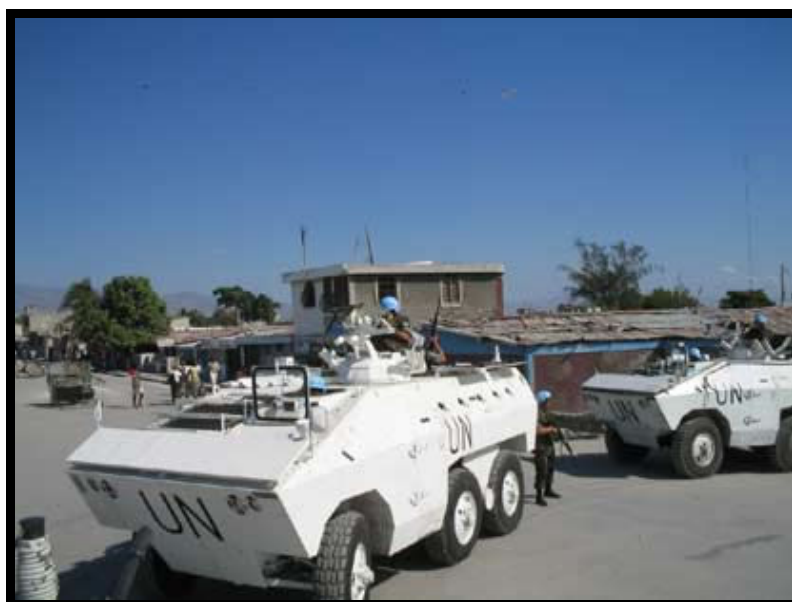
Imagem 6.1 – Presença de blindados no Haiti.

É evidente que, para o cumprimento deste complexo mandato, a MINUSTAH não poderia atuar equipada apenas com armamento leve. A previsão de combates sugeriu a existência de blindados para fornecer a devida segurança aos peacekeepers 102 . Assim sendo, a presença deste tipo de veículos com armamento pesado configura, também, a ampliação do uso da força no Haiti. A seguinte imagem confirma o que está sendo abordado.