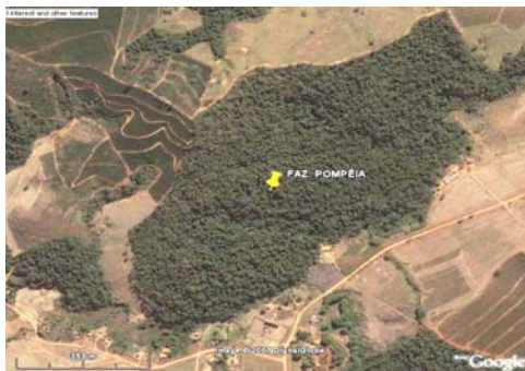
FIGURA 7 – Área 45 ha, Fazenda Pompéia, Santana da Vargem, MG.