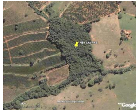
FIGURA 2 – Área 9 ha, Fazenda Renascer 1, Lavras, MG.