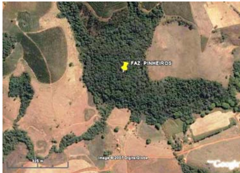
FIGURA 5 – Área 24 ha, Fazenda Pinheiros, Coqueiral, MG.