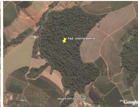
FIGURA 6 – Área 35 ha, Fazenda Santa Maria, Santana da Vargem, MG.