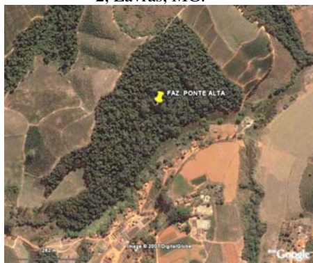
FIGURA 3 – Área 14 ha, Fazenda Ponte Alta, Lavras, MG.