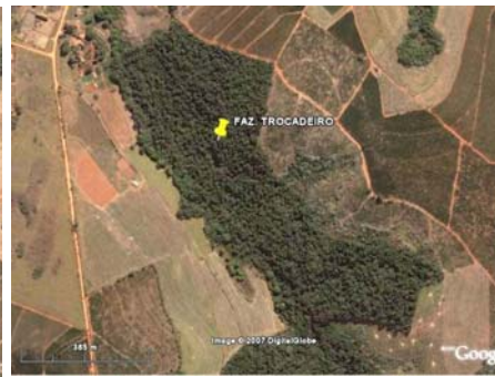
FIGURA 8 – Área ha, Fazenda Trocadeiro, Santana da Vargem, MG.