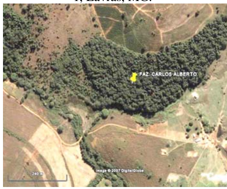
FIGURA 4 – Área 18 ha, Fazenda Cafua, Ijaci, MG.