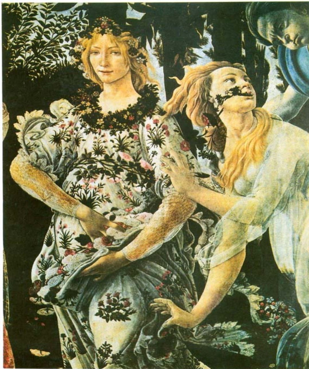
Figura 1: Detalhe do quadro A primavera , de Sandro Botticelli.