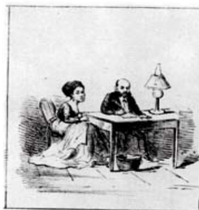
O lar domestico.