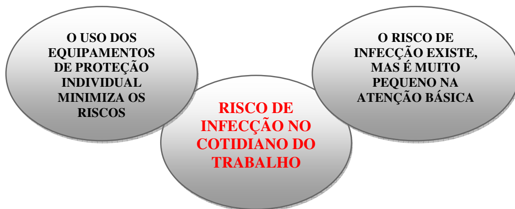
FIGURA 3- Representações do risco de infecção a que o profissional está exposto no cotidiano do trabalho na atenção básica

Na construção desta categoria, foram reunidas as representações dos profissionais da atenção básica acerca do risco de infecção a que se encontram expostos nesse nível de assistência à saúde. Após a análise do conteúdo das entrevistas, emergiram duas subcategorias: I - O risco de infecção existe, mas é muito pequeno na atenção básica; II- O uso dos equipamentos de proteção individual minimiza os riscos. Aqui, as representações têm sua raiz no conhecimento científico proveniente da formação profissional, não aparecendo outras originárias do senso comum, como em outras categorias em discussão.