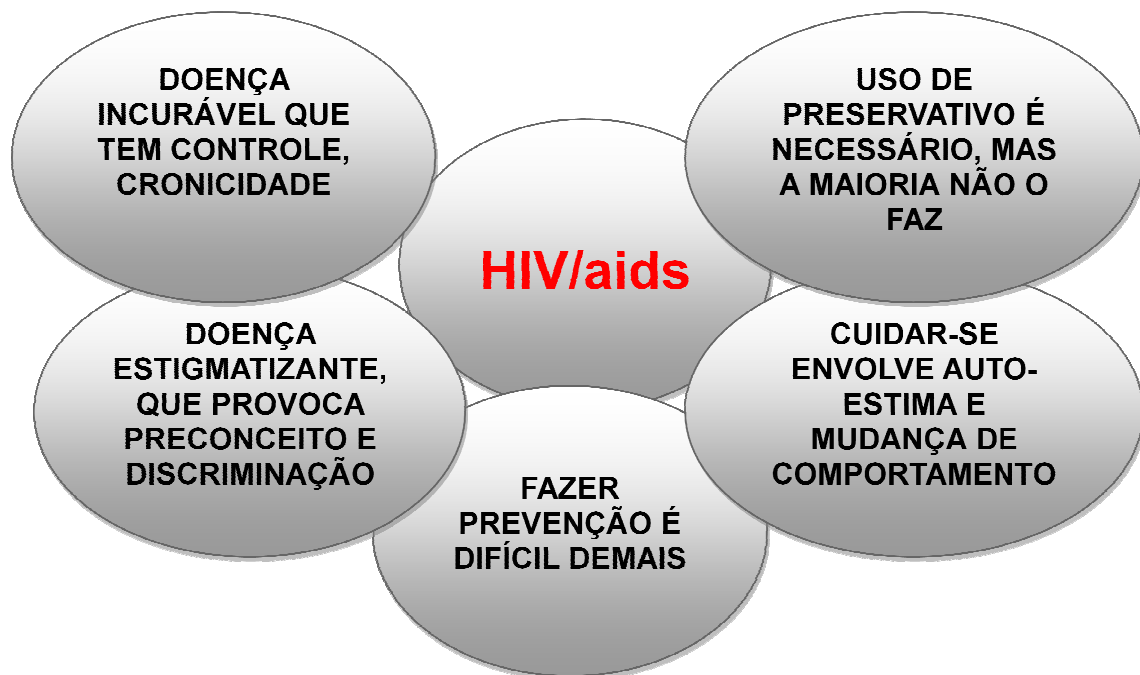
FIGURA 1- Representações dos profissionais da atenção básica em relação ao HIV/aids

Nesta categoria, incluem-se os objetos das representações dos sujeitos sobre o HIV/aids. Divide-se em 5 subcategorias, denominadas a seguir: I- Doença estigmatizante, que provoca preconceito e discriminação; II- Fazer prevenção é difícil demais; III- Uso de preservativo é necessário, mas a maioria não o faz; IV- cuidar-se envolve auto-estima e mudança de comportamento; V- Doença incurável que tem controle, cronicidade. Na FIG. 1, encontram-se representadas as subcategorias nas quais estão organizadas as representações dos profissionais.