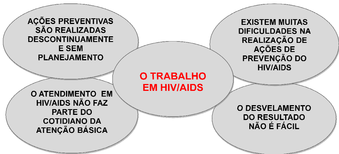
FIGURA 2- Representações dos profissionais da atenção básica sobre o trabalho em relação ao HIV/aids

Na FIG 2, encontram-se representadas as subcategorias nas quais estão organizadas as representações desses profissionais.