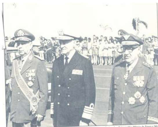
FIGURA 2 - A JUNTA MILITAR QUE ASSUMIU O PODER EM 1969: LIRA TAVARES, AUGUSTO RADEMAKER GRUNEWALD E MÁRCIO DE SOUZA E MELO