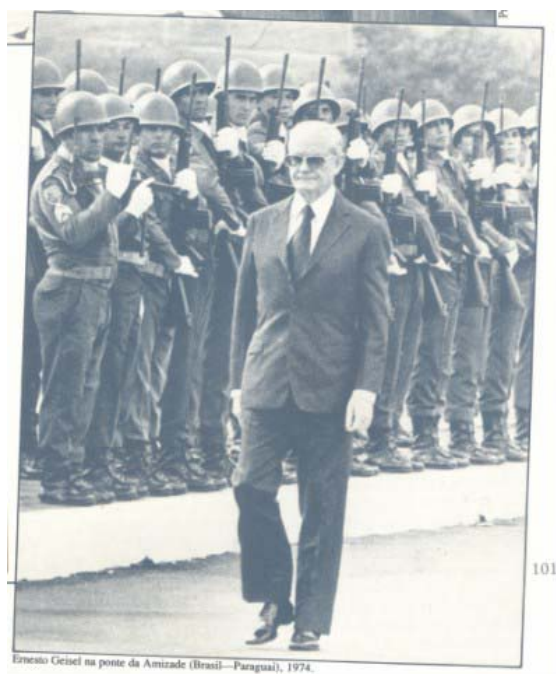
Ernesto Geisel na ponte da Amizade (Brasil-Paraguai), 1974.

Capa da revista Veja , mostrando os candidatos à presidência em 1986