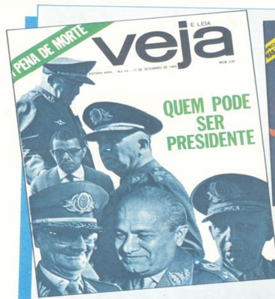
Capa da revista Veja , mostrando os candidatos à presidência em 1986