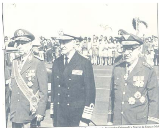
A Junta Militar: Aurélio de Lira Tavares, Augusto Rademaker Grunewald e Márcio de Souza e Melo

Essas fotografias A, B e C representam momentos da Ditadura Militar no Brasil de 1964 a 1984.