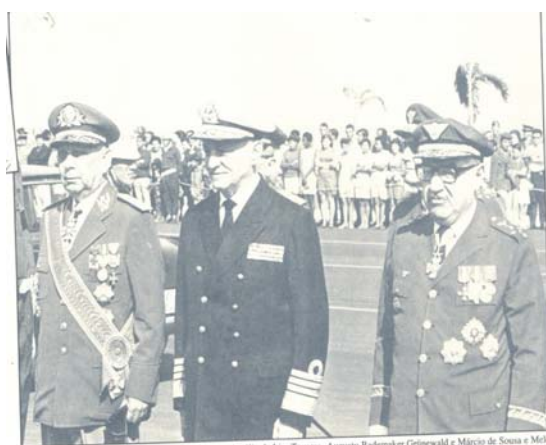
A Junta Militar: Aurélio de Lira Tavares, Augusto Rademaker Grunewald e Márcio de Souza e Melo

Essas fotografias A, B e C representam momentos da Ditadura Militar no Brasil de 1964 a 1984.