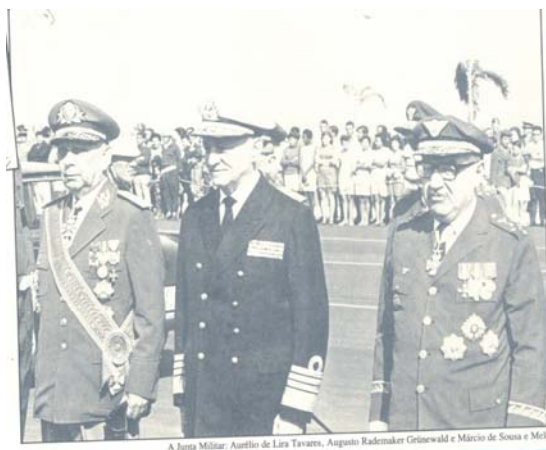
A Junta Militar que assumiu o poder em 1969: Lira Tavares, Augusto Rademaker Grunewald e Márcio de Souza e Melo

Essas fotografias A, B e C representam momentos da Ditadura Militar no Brasil de 1964 a 1984.