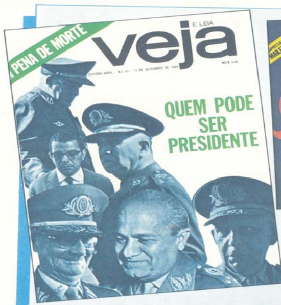
FIGURA 1 - CAPA DA REVISTA VEJA, MOSTRANDO OS CANDIDATOS À PRESIDÊNCIA EM 1986