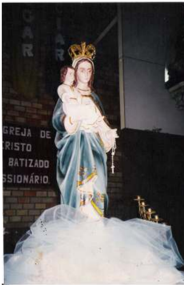
Fig 4 -Nossa Senhora do Rosário, na Catedral Nossa Senhora da Conceição, Osório – RS.

No caso específico do Maçambique, trata-se da devoção e do culto a Nossa Senhora do Rosário, por meio da Festa da Nossa Senhora do Rosário, e paralela a esta ocorre a Festa de Maçambique, ambas anualmente em Osório. Ocorre, também, a participação da congada na Festa de São Benedito, realizada no distrito de Aguapés, no mês de maio. De modo que ficam consagrados pelos negros, portanto, os dois dos muitos oragos de devoção católica negra: Nossa Senhora do Rosário e São Benedito.