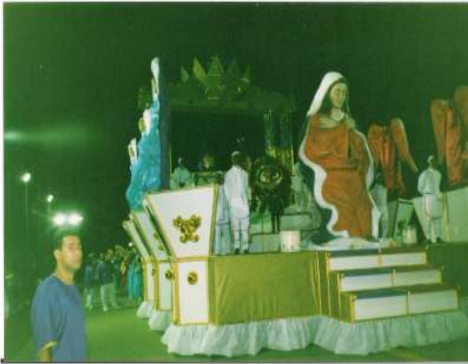
Fig. 19 - Carro alegórico com os Reis do maçambique, os dançantes e Nossa Senhora do Rosário "Negra".

O Chefe do Grupo não compareceu ao evento, assim as mulheres ganharam mais autoridade em relação aos mais jovens. Nesses momentos é que se percebe a função pedagógica das ações das mulheres em inculcar os valores do Maçambique nos mais jovens. Os dançantes, na medida em