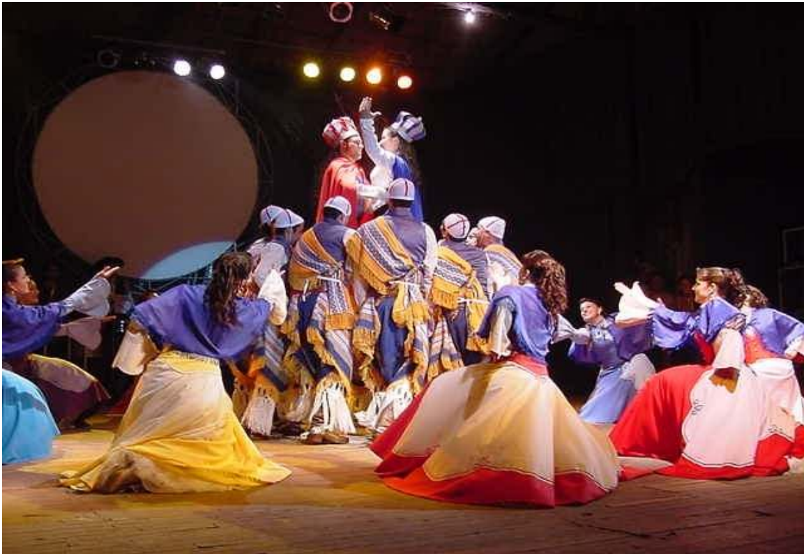
Fig. 16 -CTG Estância da Serra, de Osório (RS), realiza a performance do Maçambique de Brancos.

No final da dança, eles cruzam as estacas e erguem o Rei de Congo e a Rainha Ginga, personificados por um dos casais integrantes do grupo de nativistas, enquanto as mulheres permanecem dançando por fora, com estolas azuis e saias em diversas cores. Durante a dança, é executada a música “Moçambique de Brancos” 151 . Consta que, em 1928, ocorreu a performance de um Maçambique de Brancos em substituição ao verdadeiro, no município de Osório. Os “brancos maçambiqueiros”, conforme Guido Muri, “eram da sociedade da vila e pintavam de preto o rosto e as mãos com rolha de cortiça queimada, vestiam-se de calças e camisas claras e levavam maçaquiias nas panturrilhas”.