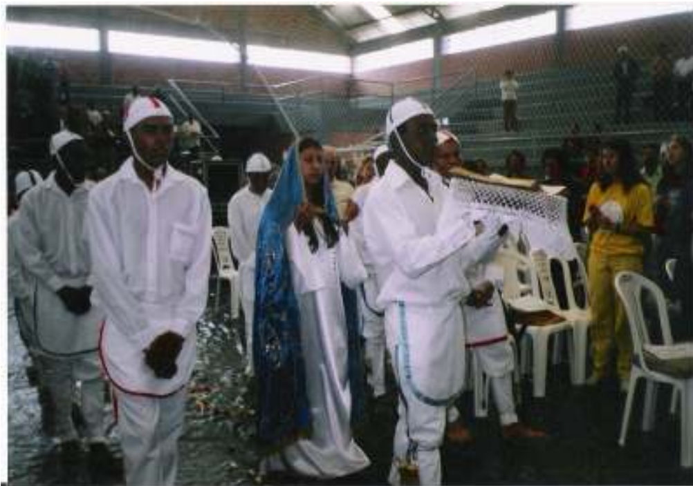
Fig. 3– Presença do Maçambique de Osório em evento dos católicos carismáticos.

A presença do Maçambique de Osório é solicitada, também, para participar de eventos dos católicos carismáticos. Os maçambiques foram convidados para participarem do cenáculo, realizado no dia 12 de outubro de 2004, no dia de Nossa Senhora Aparecida, uma santa negra. Os devotos da igreja queriam que os maçambiqueiros conduzissem uma menina branca, que faria a representação da Santa negra.