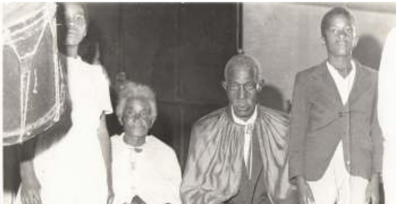
Fig. 5 - A célebre Rainha Ginga Maria Teresa e seus pagens, acompanhada do Rei de Congo.

Outros, no entanto, teriam exercido um controle com autoritarismo, de maneira que as lideranças maçambiqueiras perdiam a autonomia e o poder de decidir os rumos do grupo e da manifestação cultural. Uma dessas