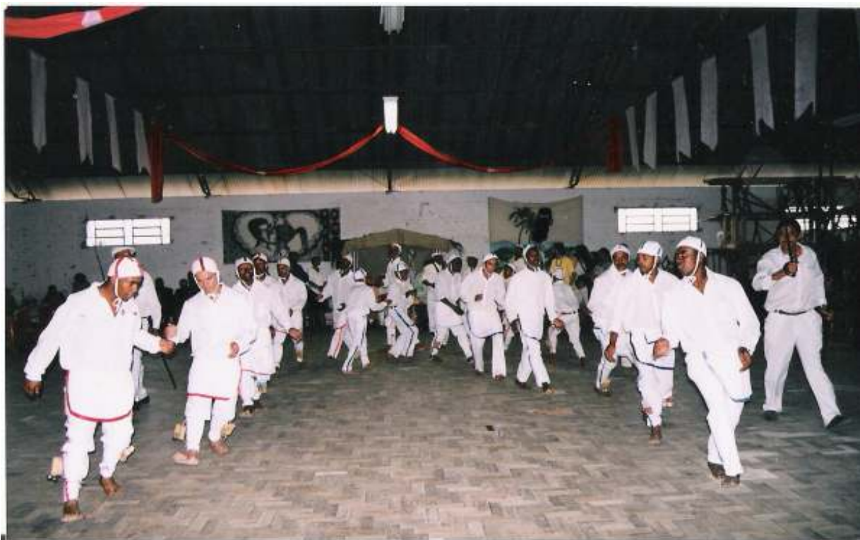
Fig. 9 – Grupo Maçambique de Osório.

De um modo geral, as pessoas da segunda geração, tanto nas áreas quilombolas como nas áreas ampliadas, conquistadas ou adquiridas pelo conjunto das famílias negras, no contexto urbano e periférico de Osório e de Capão da Canoa, chamam os mais velhos de tio ou tia. Da parte dos mais jovens, trata-se do reconhecimento de uma hierarquia e de um profundo respeito para com os mais velhos. Observei incontáveis vezes os jovens dirigindo-se aos mais velhos, primeiro pedindo a benção para um tio ou tia e, às vezes, acrescentando madrinha, no caso da Rainha Ginga – já que é ela quem acolhe os pedidos por um bom parto, intercedendo por Nossa Senhora do Rosário, sempre abençoando a todos.