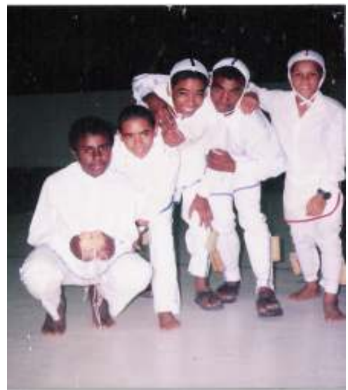
Fig. 10 - Jovens dançantes de Maçambique.

Além do mais, também se podem “duplicar”, “reforçar” e “reafirmar” os próprios laços consangüíneos. Por exemplo, quando um tio faz a Coberta D'Alma do irmão ou do cunhado; ou entre amigos ou parentes. Quando ocorre entre parentes, por exemplo, um tio pode assumir simbolicamente a condição do pai