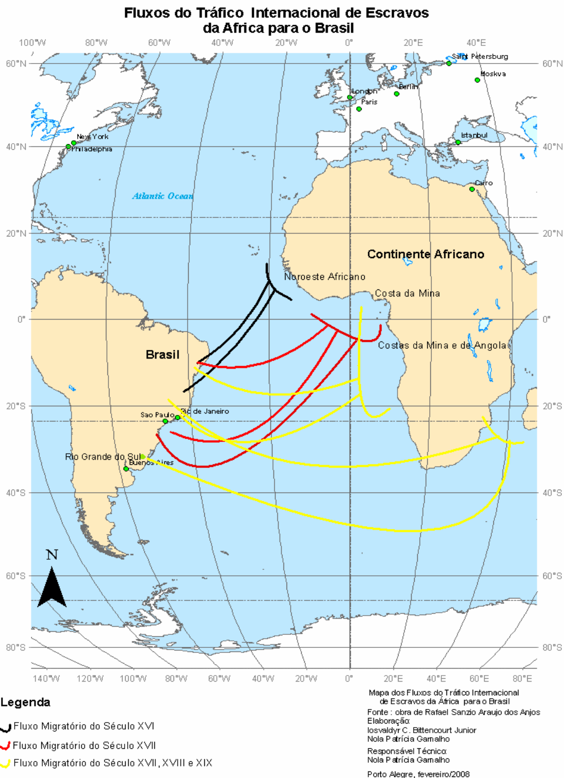
Fig. 2 – Mapa do fluxo do tráfico internacional de escravos da África para o Brasil.