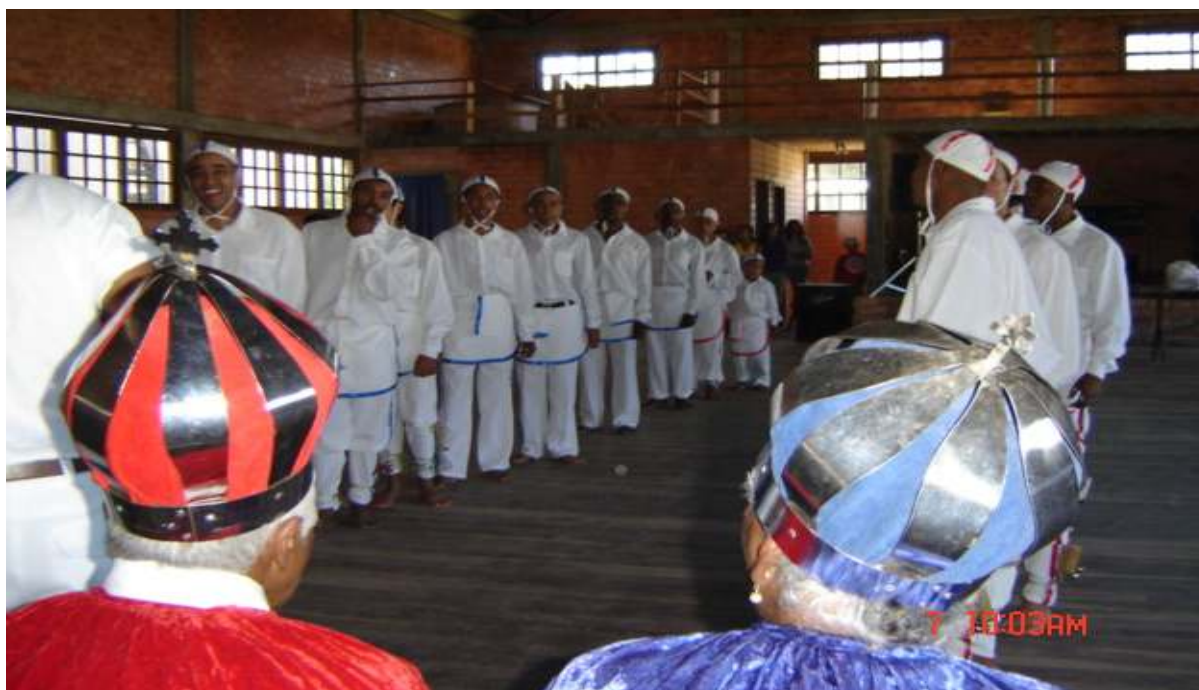
Fig. 11 - Os Reis do Maçambique e seus súditos e parentes: os Filhos do Rosário.

O bairro Caravágio é, também, chamado de Lomba, por tratar-se de uma área da cidade onde a malha viária apresenta algumas ondulações. O que os moradores consideram alto não passa de uma pequena elevação da malha asfáltica da Avenida Brasil. Como muitos moradores têm como meio principal de transporte a bicicleta, quando chegam nesse ponto, enfrentam resistência provocadas pelas ondulações do asfalto. O povoamento do bairro se deu por volta de 1960, com algumas famílias pioneiras. Muitas pessoas foram atraídas pelo fato de os terrenos, na época, serem vendidos a preços irrisórios. Outros terrenos foram doados pela prefeitura municipal de Osório.