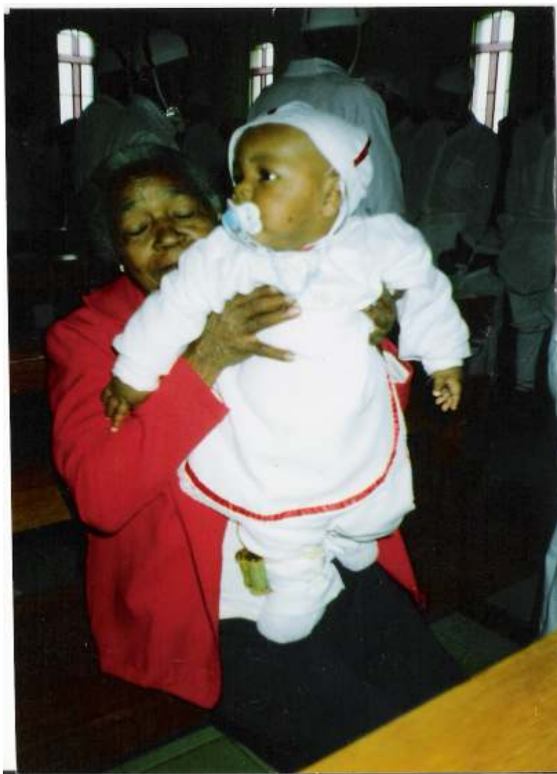
Fig. 14 -Criança pagando promessa para Nossa Senhora do Rosário.

para se obter um bom parto, mais tarde, levam os bebês para consagrá-los a Nossa Senhora do Rosário. É deste modo que os meninos e as meninas, que vão crescendo e seguem acompanhando o grupo de dançantes e de tamboreiros, durante o transcurso de muitos festejos religiosos e da realização das promessas. As crianças circulam ao lado do grupo e, por vezes, no meio ou no final das varas de dançantes de Maçambique. Alguns já vão sendo admitidos no grupo religioso, a partir dos sete ou oito anos de idade.