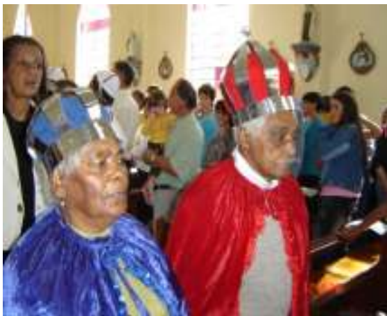
Fig. 12 - A Rainha Ginga e o Rei de Congo na Festa de São Benedito, em Aguapés, Osório. Fonte: Pesquisador.

O ‘chefe’ de um clã ou de linhagem é o ponto de junção entre o clã (linhagem) actual, constituído pelos vivos, e o clã (ou linhagem) idealizado, portador dos valores últimos, simbolizado pela totalidade dos antepassados, visto que é ele que transmite a palavra dos antepassados aos vivos e a dos vivos aos antepassados. A imbricação do sagrado e do político é, nesses casos, já incontestável. Nas sociedades laicizadas, continua aparente; nelas o poder nunca está inteiramente esvaziado do conteúdo religioso, que se mantém presente, reduzido e discreto. (BALANDIER, 1980, p. 105).