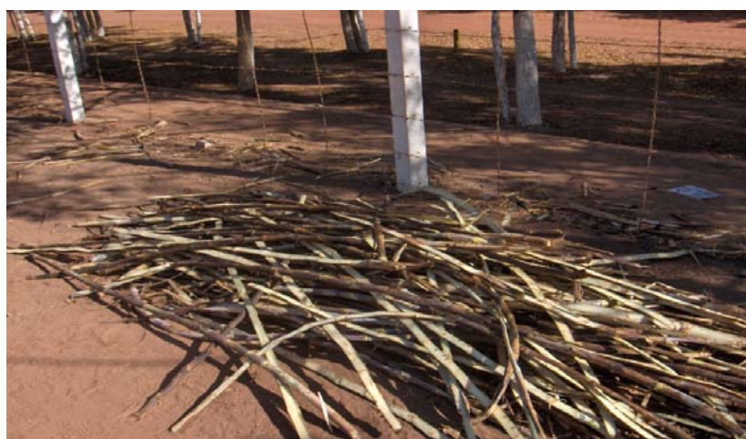
FIGURA 3. Abertura dos colmos longitudinalmente, para contagem do número total de internódios e o número de entrenós broqueados por colmo.