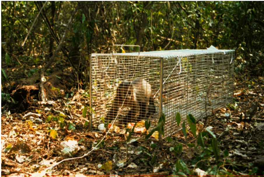
Figura 4. Macaco Prego preso na armadilha.