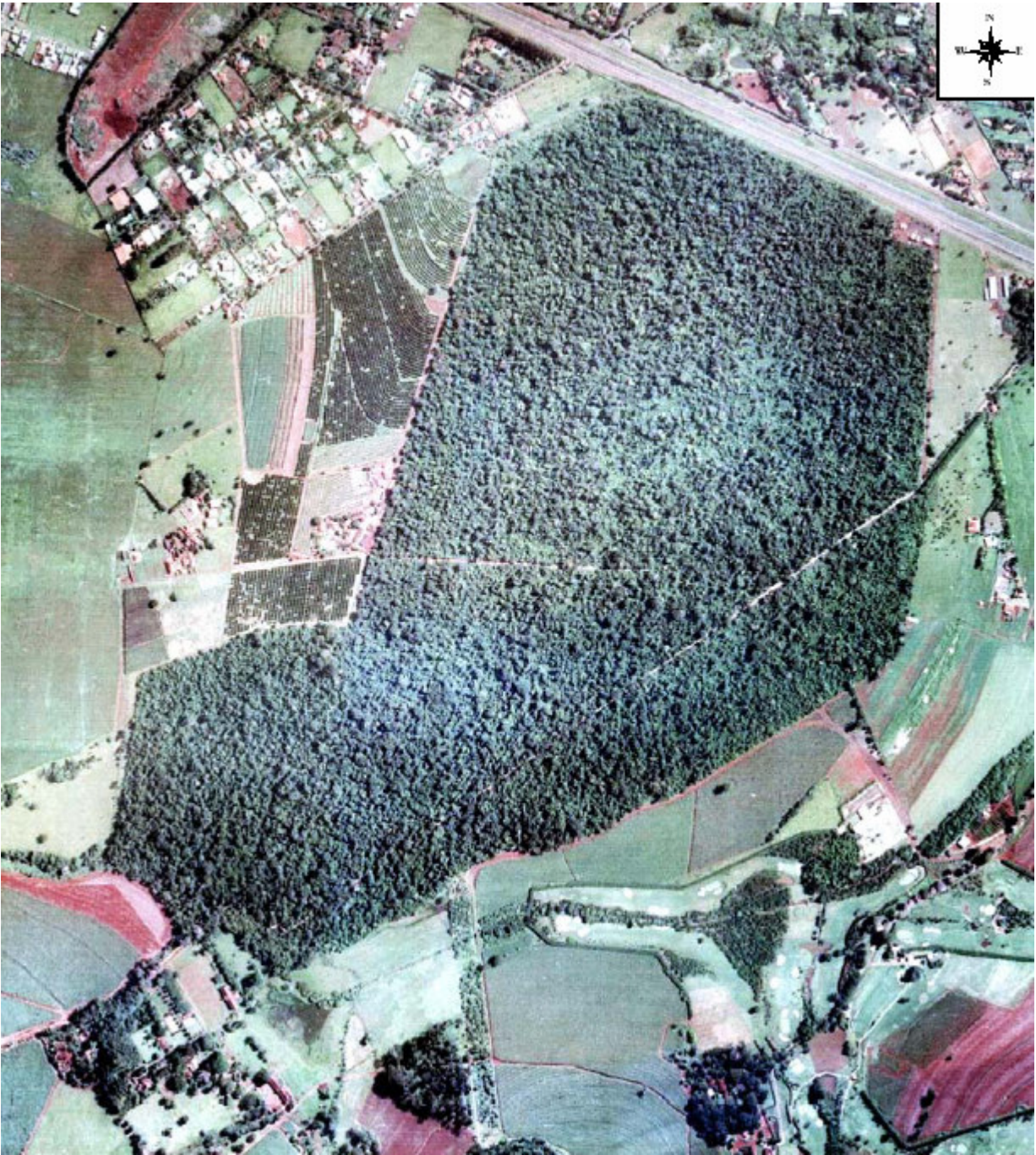
Figura 2. Foto aérea da Mata de Santa Teresa, mostrando seu isolamento por áreas de plantações, loteamentos e anel viário.