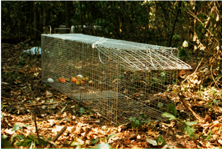
Figura 3. Armadilha do tipo Tomahawk , com frutas no seu interior.