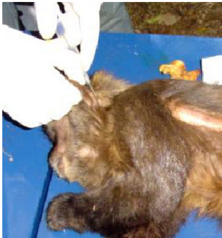
Figura 6. Aplicação do transponder (microchip) na região do processo mastóide.

Todos os animais foram microchipados com transponders ( microchips ). Os transponders foram introduzidos atrás da orelha do animal, ficando sob a pele, na região do processo mastóide do osso temporal. Esse local foi escolhido por dificultar a retirada dos microchips pelo animal e em seguida foi realizada a leitura com o aparelho da marca Animalltag®.