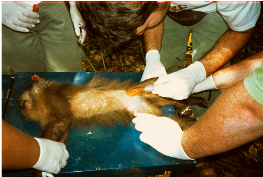
Figura 5. Coleta de sangue da veia femural de um Macaco Prego.

Os soros obtidos foram transferidos para tubos de plástico da marca Eppendorf® de 0,5 mL, identificados e mantidos em freezer a temperatura de -20°C até o momento do uso.