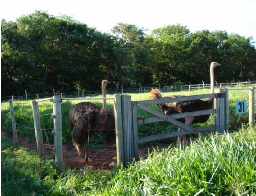
Figura 3: Setor de reprodução de uma fazenda de criação de avestruzes em Minas Gerais.