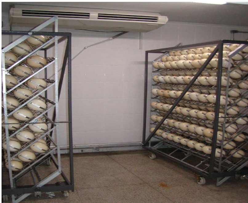
Figura 2: Vista interna de um incubatório de avestruzes localizado no Estado de Minas Gerais.

A propriedade utilizada para o estudo, situa-se na Região Sudeste do Brasil, possui aproximadamente 12.000 aves. O sistema de criação é composto por: incubatório (Figura 2), reprodução (Figura 3), cria (Figura 4) e recria (terminação) (Figura 5).