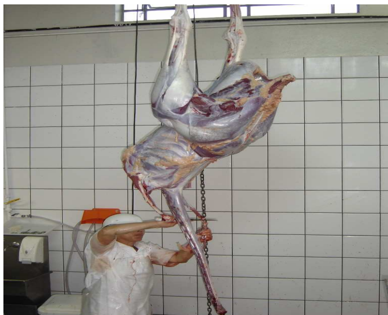
Figura 7: Carcaça de avestruz na linha de abate em um abatedouro do Estado de São Paulo.