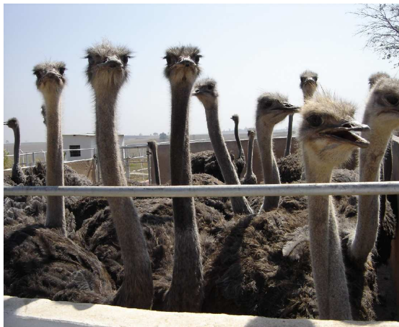
Figura 6: Vista do curral de espera em abatedouro localizado no Estado de São Paulo.