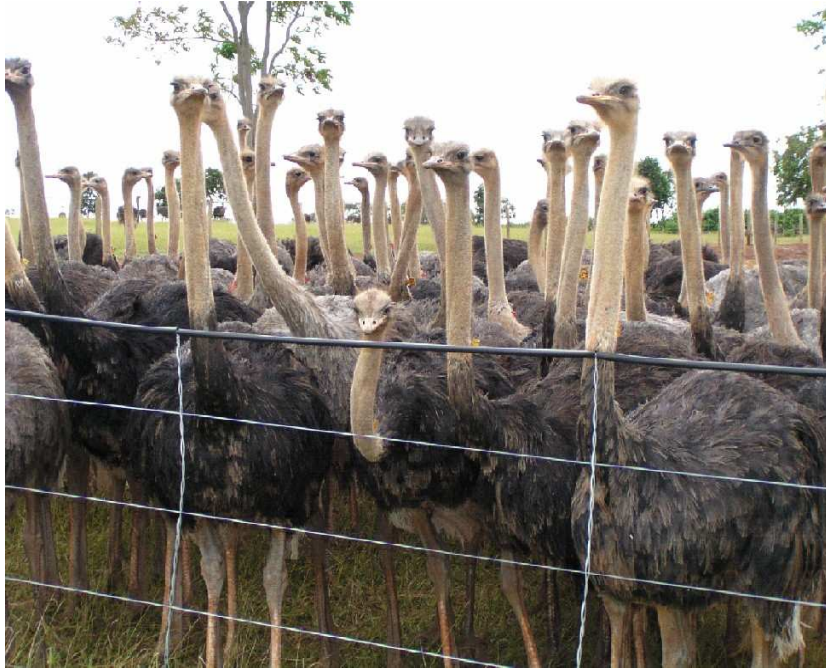
Figura 5: Setor de recria de uma fazenda de criação de avestruzes de Minas Gerais.

De acordo com Instrução Normativa Conjunta nº 2 (BRASIL, 2007b), o criatório se enquadra na classificação de estabelecimento de ciclo completo. Na criação de avestruzes convencional, as fases da criação são divididas em creche, cria, recria e reprodução. A propriedade estudada segue o modelo israelense que não possui a fase de creche e as aves, logo que eclodem, vão para o campo, em um sistema de abrigos e piquetes móveis onde permanecem até a idade de 90 dias. A partir de três meses de idade, os avestruzes seguem o modelo convencional de criação, sendo as aves levadas para piquetes fixos até a idade de 13 meses (aves destinadas ao abate) ou 24 meses (aves selecionadas para reprodução). Com mais de 24 meses as aves seguem para o setor de reprodução.