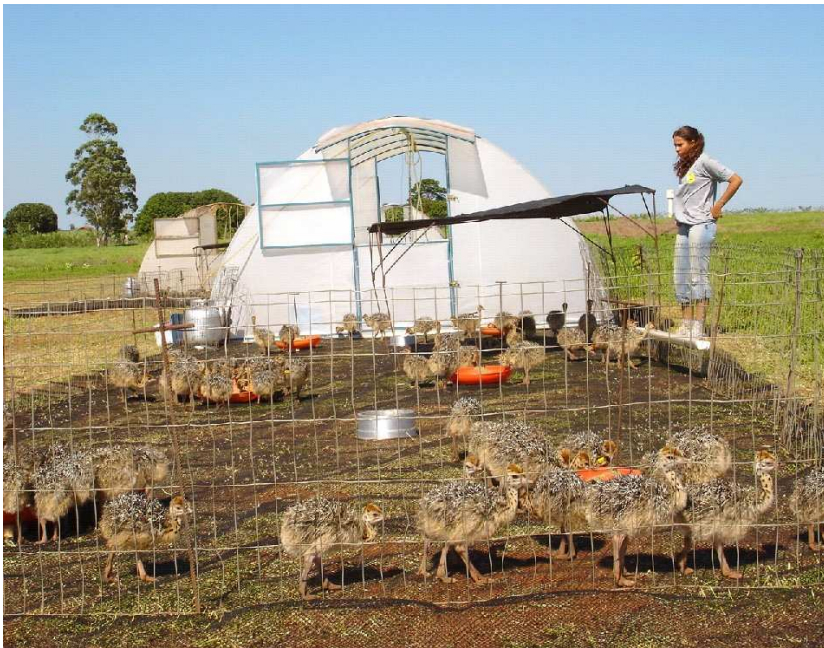
Figura 4: Setor de cria de uma propriedade produtora de avestruzes situada no Estado de Minas Gerais.