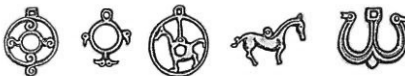
Ilustração 3: Amuletos descobertos nos cemitérios do Império Kazar.