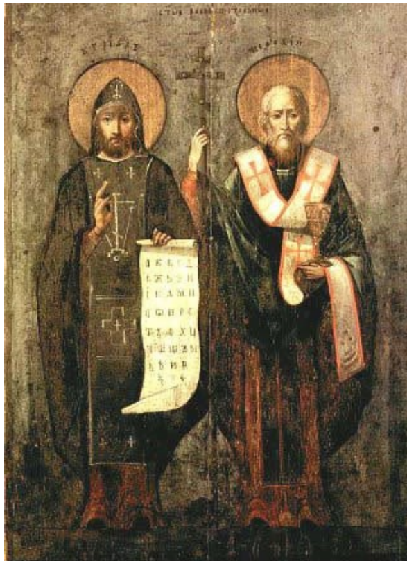
Ilustração 2: Santos Cirilo e Metódio

Onde está meu tapete, ali está meu país.