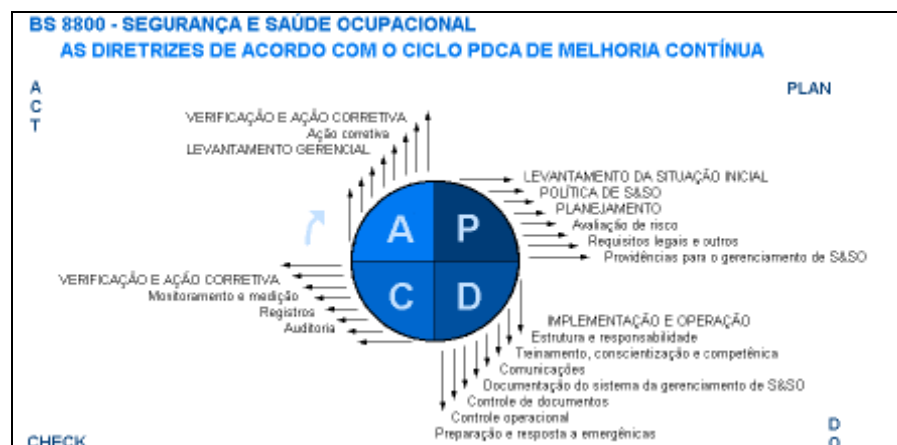
Figura 3: BS 8800 – Segurança e saúde ocupacional: as diretrizes de acordo com o ciclo PDCA (Plan Do Check Act) de melhoria contínua

O sistema de gerenciamento retro citado compõe-se de diversos elementos que são descritos como essenciais para a sua eficácia, e se harmonizam em um ciclo de aperfeiçoamento contínuo que, por sua vez, se insere no sistema global da gerência, conforme se pode verificar analisando a Figura. (QUELHAS; LIMA, 2002, p. 3).