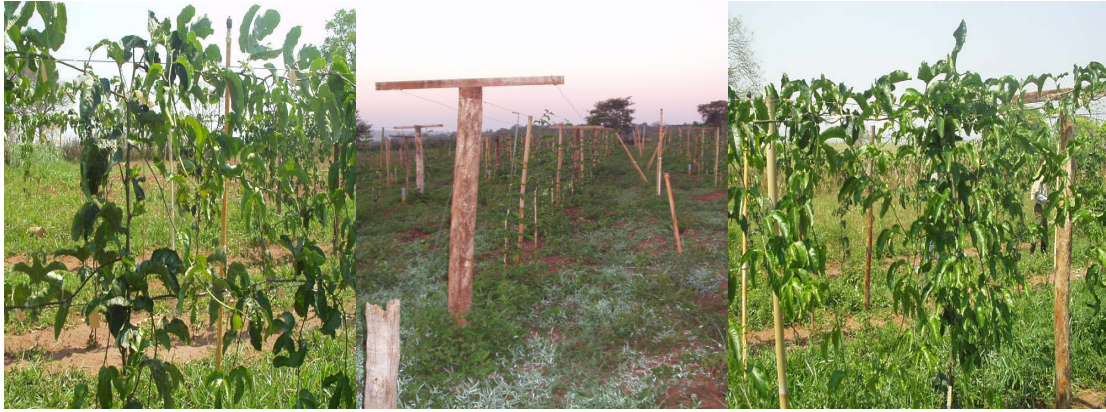
Apêndice 6- Tratamento 5 (espaldeira vertical com 2 fios de arames e 4 cordões) aos 135 dias após o transplante; Tratamento 6 (espaldeira em T com 2 fios de arames e 2 cordões só para um lado a 2,0 m) aos 73 dias e Tratamento 7 (espaldeira em T com 2 fios de arames e 4 cordões) 135 dias após o transplante, em Andradina/SP.