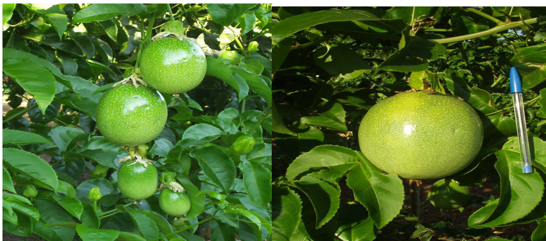
Apêndice 3 - Frutos de maracujazeiro amarelo em dois estádios de desenvolvimento, após 8 meses do transplante.