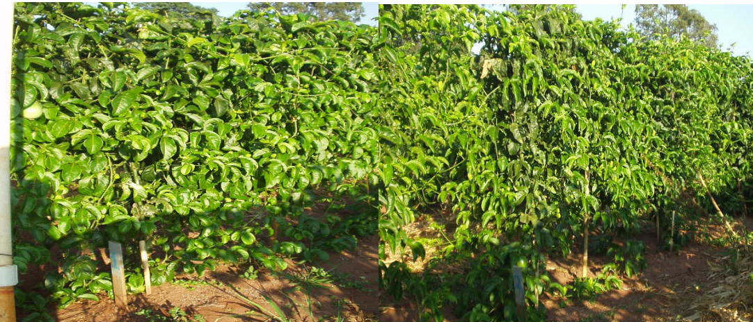
Apêndice 7- Aspecto visual dos tratamentos: T1 (espaldeira vertical com 1 fio de arame e 1 cordão para um só lado), T2 (espaldeira vertical com 1 fio de arame e 2 cordões- um para cada lado a 2,00m), 210 dias após o transplante, em Andradina/SP.