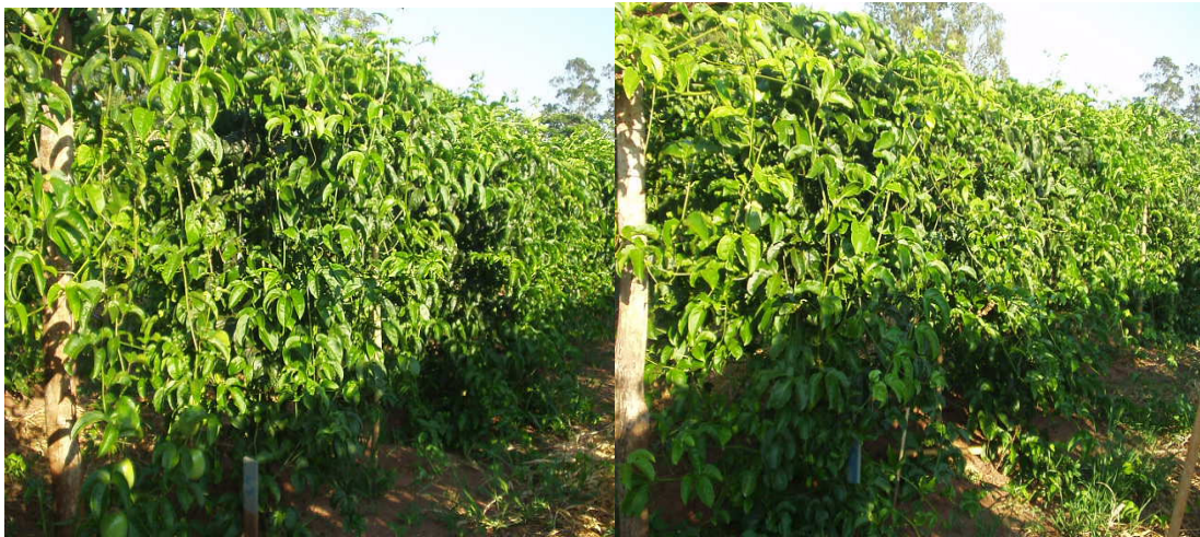
Apêndice 9- Aspecto visual dos tratamentos: T5 (espaldeira vertical com 2 fios de arames e 4 cordões) e T6 (espaldeira em T com 2 fios de arames e 2 cordões só para um lado a 2,0 m) 210 dias após o transplante, em Andradina/SP.