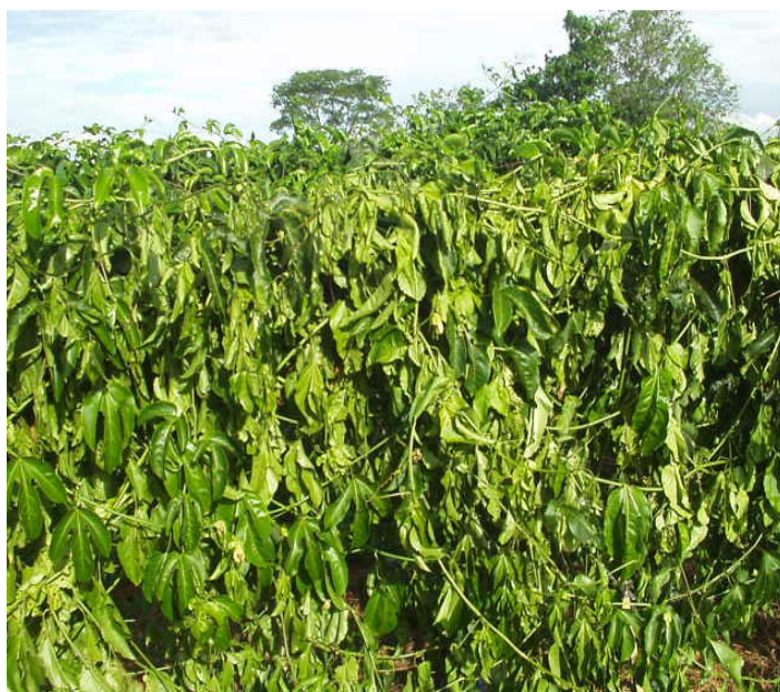
Apêndice 11- Aspecto visual das plantas atacadas por Fusarium solani (Morte prematura do maracujazeiro) aos 11 meses do transplante, em Andradina/SP.