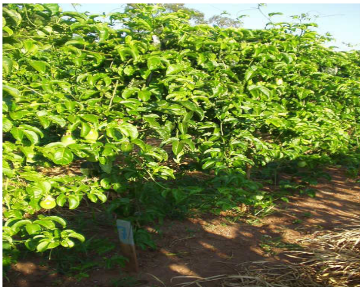
Apêndice 10- Tratamento 7 (espaldeira em T com 2 fios de arames e 4 cordões) 210 dias após o transplante, em Andradina/SP.