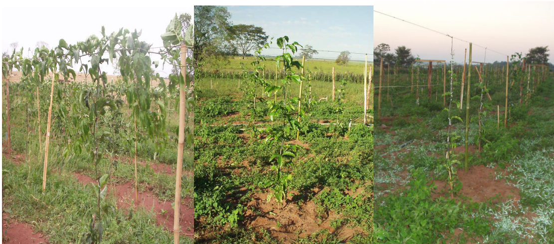
Apêndice 5- Plantas de maracujazeiro, 135 dias após o transplante, conduzidos em T2 (espaldeira vertical com 1 fio de arame e 2 cordões –um para cada lado a 2,00m) 135 dias após o transplante e aos 73 dias após transplante, em Andradina/SP.