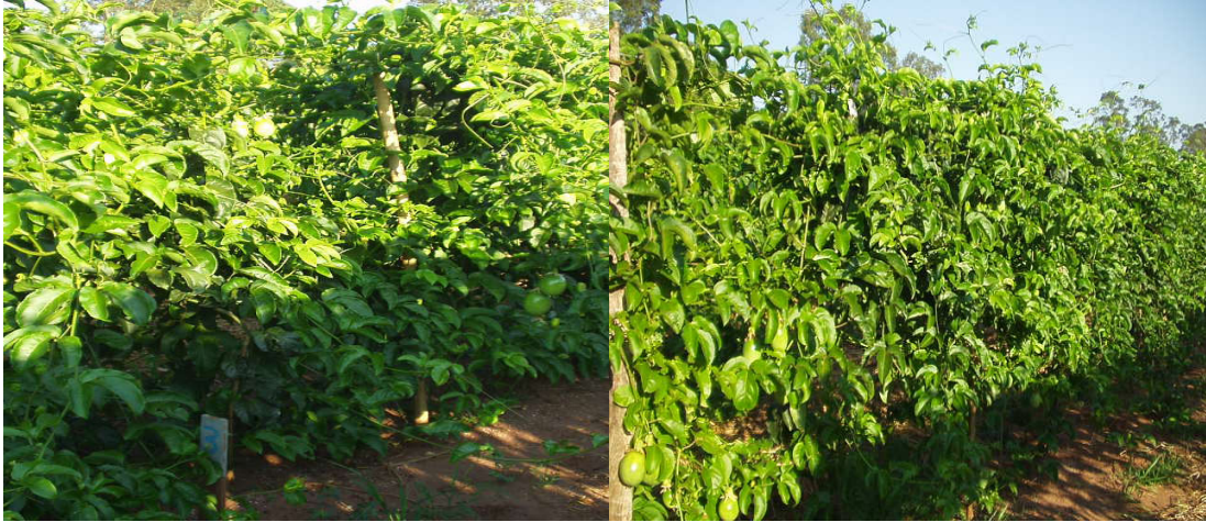
Apêndice 8- Tratamento 3 (espaldeira vertical com 2 fios de arame e 2 cordões - um para cada lado a 1,60 m e 2,00m ) 210 dias após o transplante, em Andradina/SP.