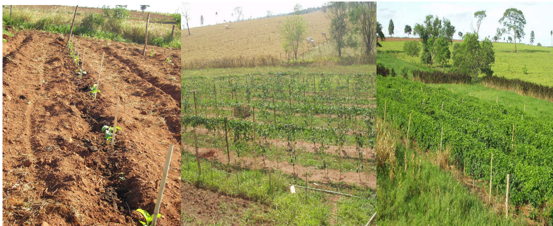
Apêndice 1- Aspecto visual das plantas de maracujazeiro com 01 dia, 135 dias e 222 dias após transplante, em Andradina/SP.