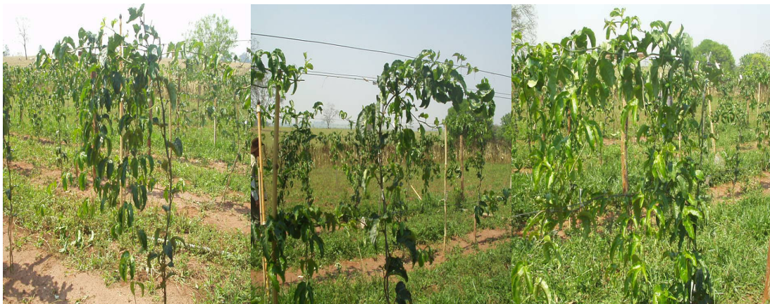
Apêndice 4- Plantas de maracujazeiro conduzidos em T1 (espaldeira vertical com 1 fio de arame e 1 cordão para um só lado ), em T3 (espaldeira vertical com 2 fios de arame e 2 cordões, um para cada lado a 1,60 m e 2,00m), em T4 (espaldeira vertical com dois fios de arame e dois cordões, só para um lado) aos 135 dias após o transplante, em Andradina/SP.