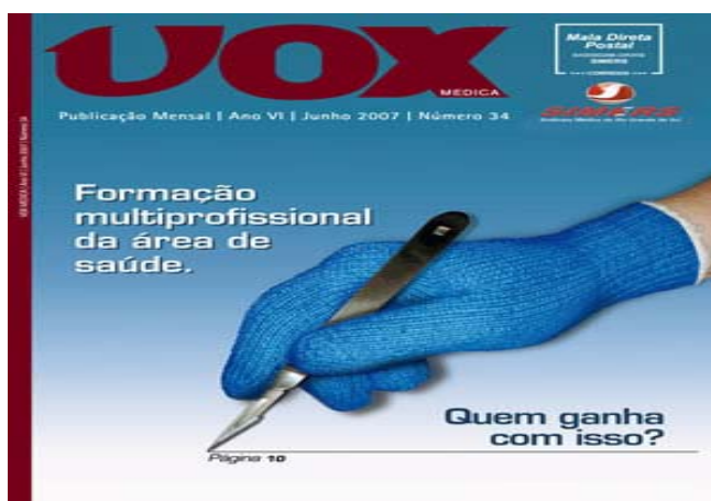
Figura 2: Capa revista VOX Médica VOX Médica, junho, 2007

A perfeição da atuação profissional de um médico é o que parece constituir essa imagem que acabo de descrever. Até pode ser... No entanto, essa imagem está localizada na capa de uma revista publicada pelo Sindicato Médico do Rio Grande do Sul 16 (VOX Médica, 2007) e acompanha outra imagem portando os dizeres “Formação multiprofissional da área da saúde: Quem ganha com isso?”. E há mais: a mão visivelmente tem quatro dedos e a luva é de lã. Porém, não há com o que se preocupar: o desenho da revista está preso, ou como diria Foucault (2001a, p. 248): “estável prisão”. A descrição que se faz e o pensamento ativado pela imagem nos leitores e nas leitoras da revista estão soltos. São do mundo!