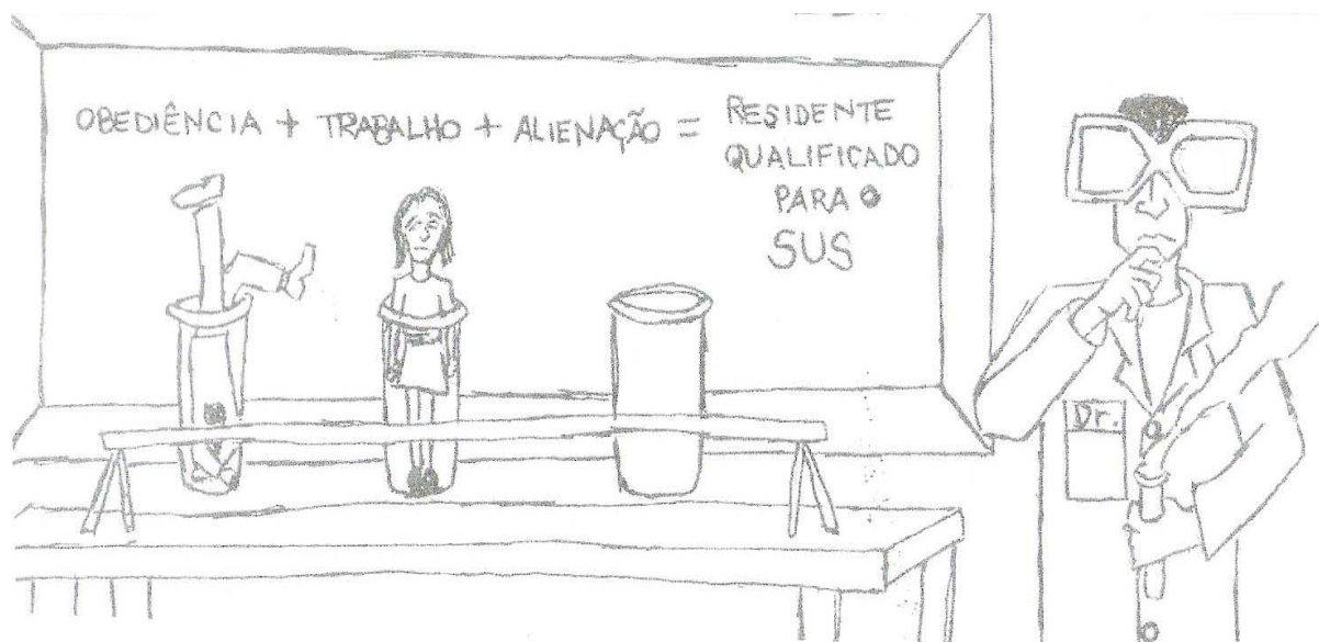
Figura 1: Desenho “Residente qualificado para o SUS”

formação” (CGMRS, 2007). Já no informativo produzido pelo Fórum Nacional de Residentes Multiprofissional em Saúde, ou seja, em âmbito nacional, os residentes se inscrevem como “profissionais de saúde e cidadãos brasileiros” (FNRMS, 2007). Que personagem é este que se narra de muitos modos, que incita um posicionamento quase heróico de seus pares, que milita por todos os cantos, buscando seus encantos? Essa narrativa inflamada fala e faz falar sobre quem é o residente. Constitui esses sujeitos, produz efeitos de verdade, tem caráter pedagógico. Ao mesmo tempo, esses sujeitos que se identificam também estão em busca de identificação ou da certeza dela, pois manifestam sua vontade de realizar um “aprofundamento da identidade política para o grupo formado por residentes de várias partes do país” (LAPPIS, 2007b).