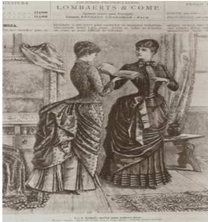
Ilustração de uma página da revista A Estação , de 1884 (MEYER, 2001, p.87).