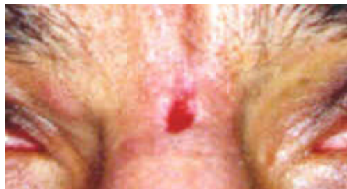
Figura 2 - Ferida corto-contusa

As perfurantes são ocasionadas por agentes longos e pontiagudos como prego, alfinete. Pode ser transfixante quando atravessa um órgão, estando sua gravidade na importância deste órgão.