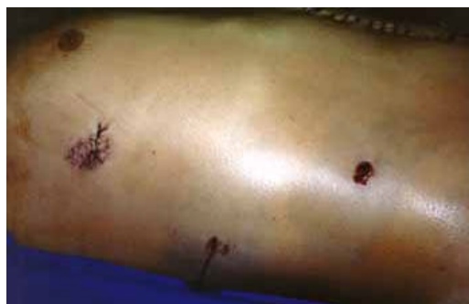
Figura 3 - Ferida pérfuro-contusa

As pérfuro-contusas são as ocasionadas por arma de fogo, podendo existir dois orifícios, o de entrada e o de saída.