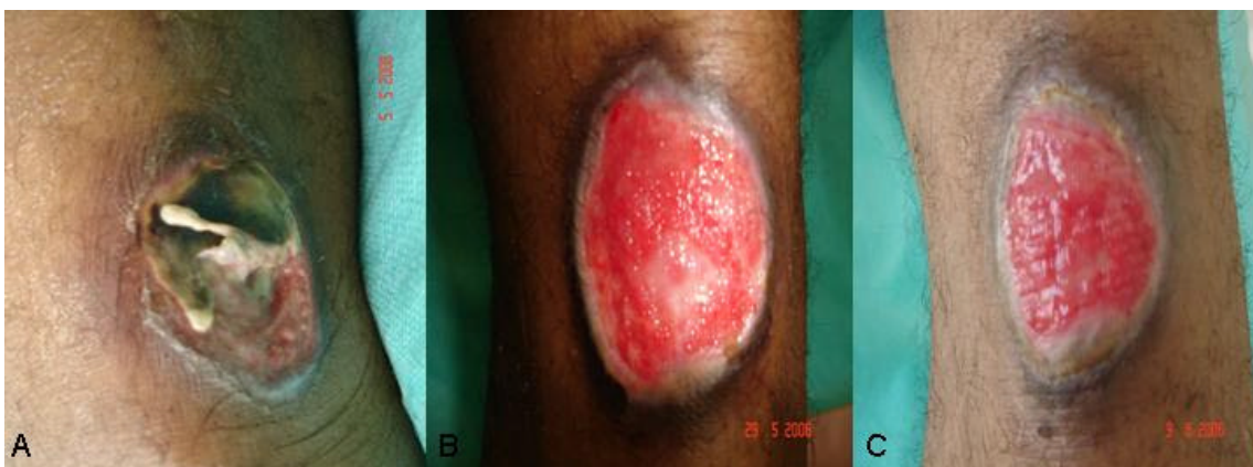
Figura 16 – Grupo Laser - clientes com feridas limpas diariamente com S.F.0.9% ,aplicado Laser Diodo (830nm – 30 mW) de forma contínua em suas margens, ocluídas com curativo primário umedecido em S.F.0.9% , curativo secundário seco e fechadas com ataduras.

adjacentes para que sejam eficientes seus efeitos regenerativos (ZELTZER, s/d). Em seguida iniciou-se a limpeza com S.F.0.9% e a aplicação do laser em suas margens de forma contínua. Com dezessete dias de aplicação de laser de baixa potência, a ferida apresentava-se totalmente limpa com seu leito coberto por granulação vermelho vivo, brilhante, ilha de epitelização, contração em suas margens, exsudação insignificante e relato de diminuição da dor. Em 09/06/2006, ao se encerrarem as aplicações de laser, apresentava-se em total processo de cicatrização, com suas margens epitelizadas (figura 15 A, B e C).