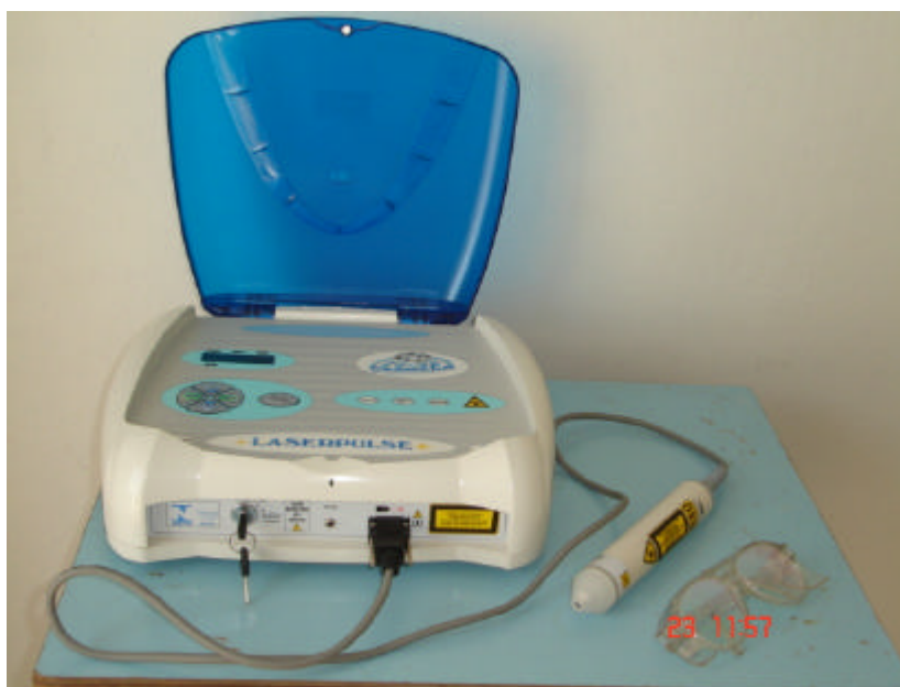
Figura 12: Aparelho de Laser