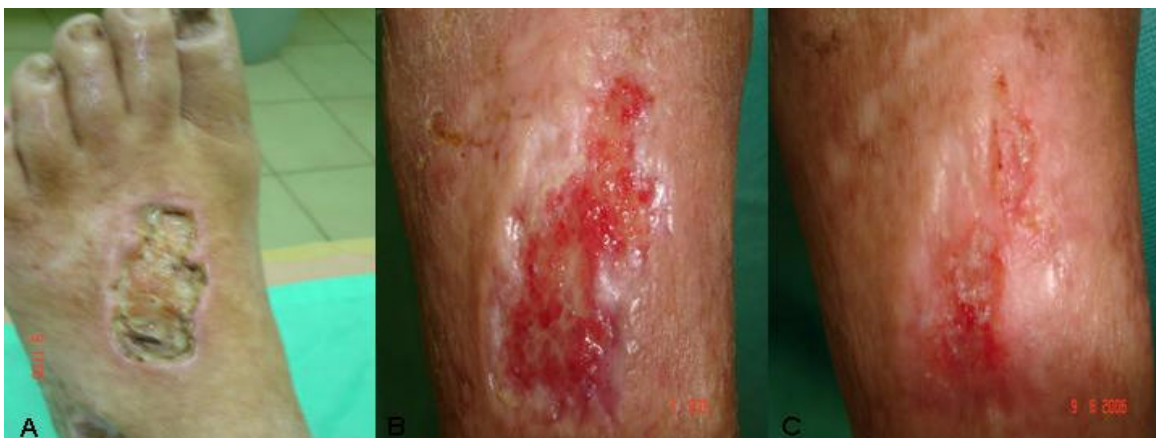
Figura 15 – Grupo Papaína – clientes com feridas limpas diariamente com soro fisiológico S.F. 0.9% , passado papaína, ocluídas com curativo primário umedecido em S.F.0.9%, curativo secundário seco e fechadas com ataduras. A – aspecto da ferida em 09/02/2006; B – em 07/04/2006; C – em 09/06/2006.

Nos clientes do Grupo 3 (feridas com aplicação de Laser Diodo), observou-se uma evolução positiva como esperado. Torres e Brito (s/d) mostram, em um levantamento bibliográfico, vários autores que descrevem em seus experimentos os efeitos satisfatórios da terapia com laser de baixa potência no processo de reparação tecidual como, por exemplo, a reparação de fraturas ósseas dentro de três semanas após ser irradiada em dias alternados pelo laser de He-Ne, num estudo de Trelles e Mayayo (1987).