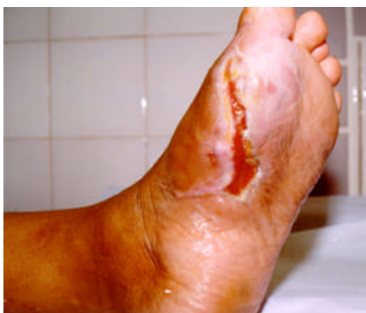
Figura 8 – Danos causados por remoção de calos