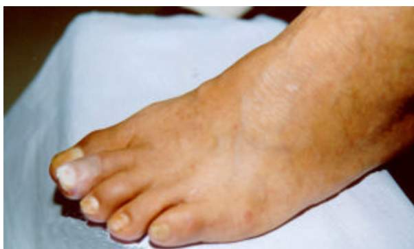
Figura 7 – Pé com úlcera

Sapatos novos podem machucar os pés, causando bolhas e úlceras.