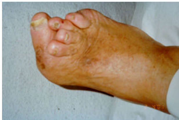
Figura 10– Dedos em garra de martelo

Dedos em garra/martelo: comumente ocorrem devido à atrofia muscular e levam as pontas dos dedos a terem atrito com os sapatos.