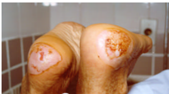
Figura 6 – Pé diabético

Sapatos novos podem machucar os pés, causando bolhas e úlceras.