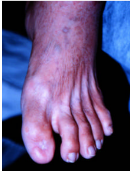
Figura 11– Pé de charcot Fonte: (TOSCANO, 2003)

Pé de Charcot – artropatia neuropática – artropatia degenerativa relativamente sem dor, progressiva de uma ou múltiplas articulações.