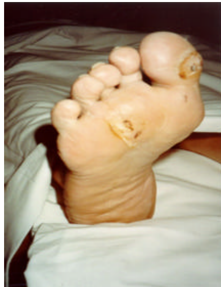
Figura 9 – Pé com sinal de estresse

Deformidades dos pés: levam à mudança do passo e causam estresse a outras partes do pé, principalmente nas extremidades metatársicas. O calo é um dos primeiros sinais de estresse.