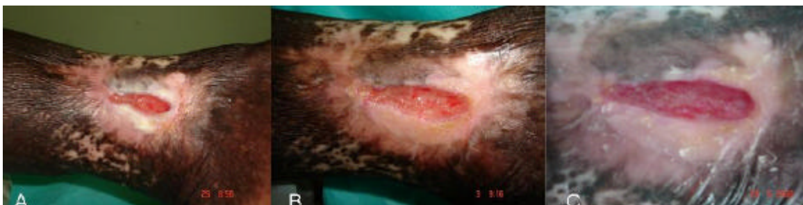
Figura 14 – Grupo Controle – clientes com feridas limpas diariamente com soro fisiológico S.F. 0.9%, ocluídas com curativo primário umedecido em S.F.0.9%, curativo secundário seco e fechadas com ataduras. A – aspecto da ferida em 25/01/2006; B – em 03/04/2006; C – em 29/05/2006.

As feridas do Grupo Controle foram trabalhadas em 125 dias com curativos diários de S.F.0.9%. Localizada em terço inferior da perna esquerda, em face lateral interna, com evolução lenta, profunda superficial, leito vermelho pálido, margens regulares, aderidas, contaminada, exsudato mínimo, edema presente, dor ausente e pulso pedioso presente (figura 13 A, B e C).