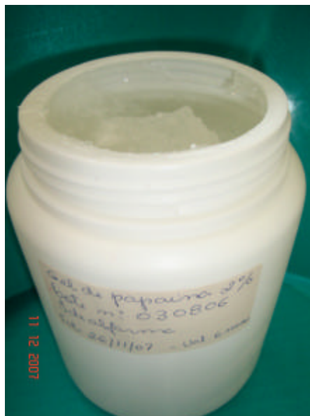
Figura 13: Gel de papaína