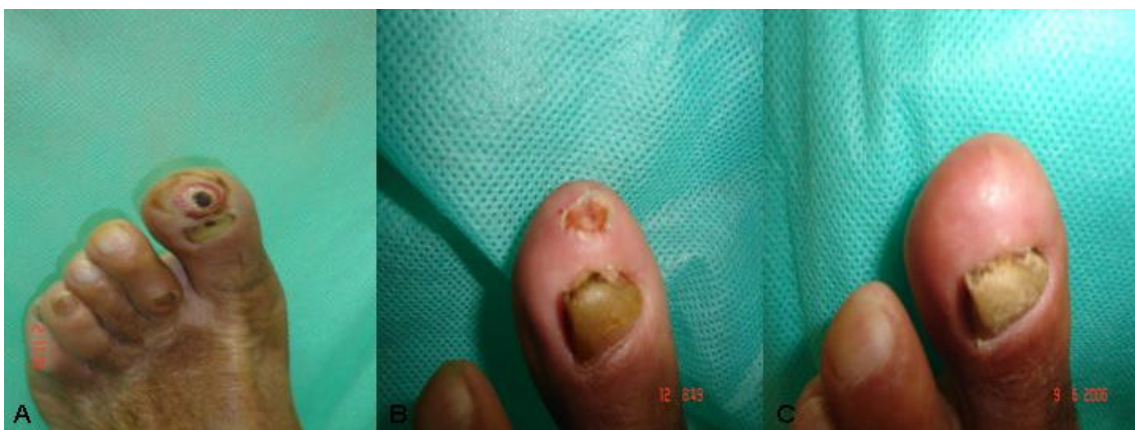
Figura 17 – Grupo Laser + Papaína - clientes com feridas limpas diariamente com S.F.0.9%, aplicado Laser Diodo (830nm – 30 mW) de forma contínua em suas margens, passado papaína, ocluídas com curativo primário umedecido em S.F.0.9%, curativo secundário seco e fechadas com ataduras. A – aspecto da ferida em 02/03/2006; B – em 12/04/2006; C – em 09/06/2006.

Em 12/04/2006, com 40 dias de curativo, verificamos clinicamente a evolução positiva, apresentando-se limpa, em fase de maturação, com total reepitelização em seu leito. E região perilesão íntegra. Em 09/06/2006, ao finalizar a coleta de dados, completa cicatrização (figura 16 A, B e C).