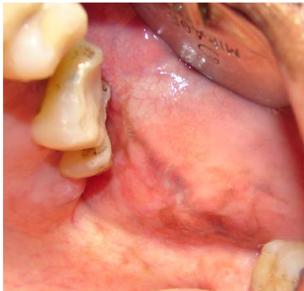
Figura 5.2 B – Aspecto clínico pós-substituição de restaurações em amálgama