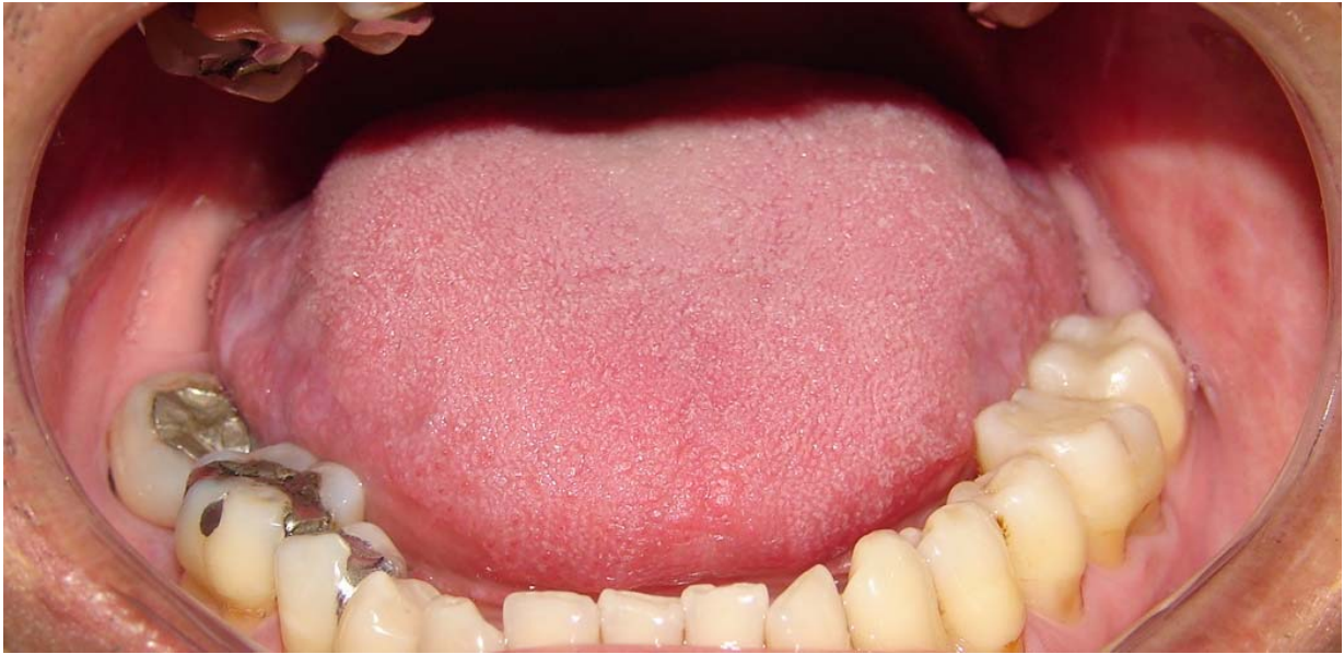
Figura 5.1 A – Paciente com quadro clínico sugestivo de RLC 2 meses após substituição de restaurações em amálgama do lado esquerdo.