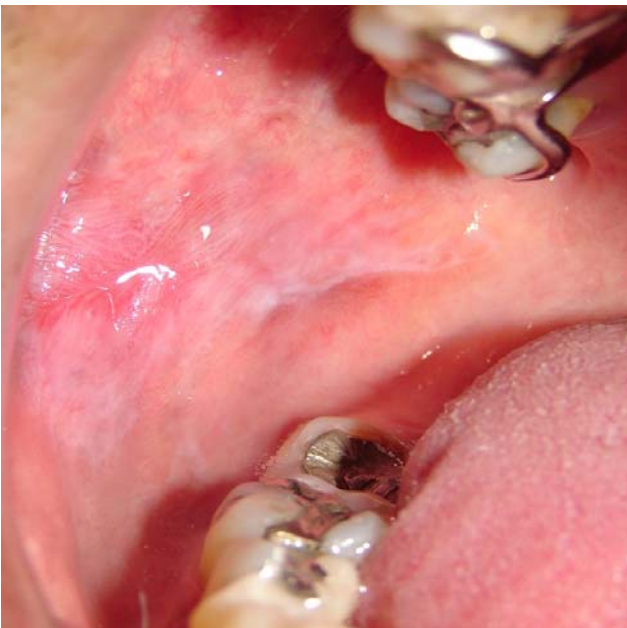
Figura 5.1 B – Associação intensa (classe III) de lesões orais e restaurações em amálgama (lado direito)