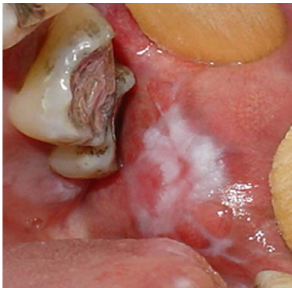
Figura 5.2 A – Aspecto clínico inicial de paciente portador de RLC (classe III)