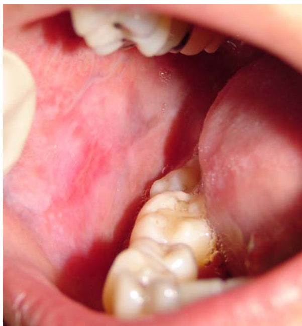
Figura 5.3 A – Aspecto clínico inicial de paciente portador de RLC (classe II)