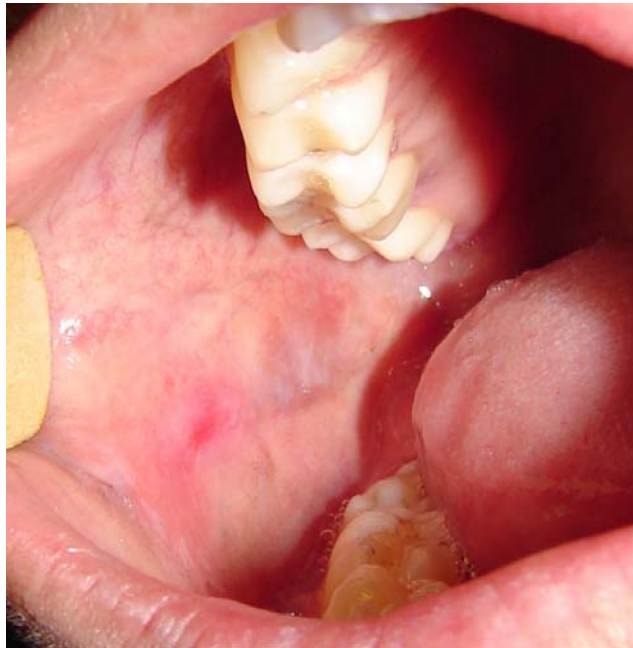
Figura 5.3 B – Aspecto clínico 7 dias após substituição do amálgama por resina composta