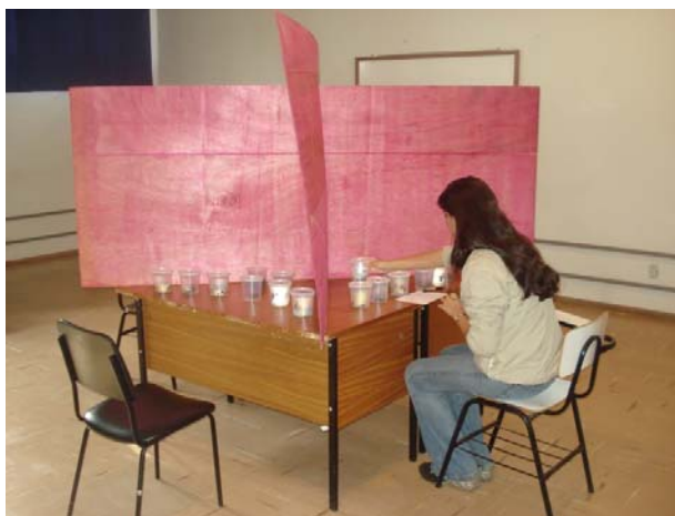
Figura 2: Análise sensorial

colocados em sete vasilhames sobre uma mesa dividida em quatro partes (figura 2). A avaliação foi feita comparando o material numerado de 1 a 6 com o material chamado de padrão (P) que consistia de fezes dos animais alimentados com a ração sem os aditivos. Os valores atribuídos às amostras seguiram uma escala de 0 a 10, onde os valores de 0 a 4 representavam classificações de odor mais forte que o padrão, o valor de 5 odor igual ao padrão e os valores de 6 a 10 classificações de odor mais fracos que o padrão (figura 3).