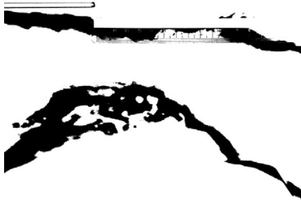
Figura 5: Radiografia abdominal de cães da raça Beagle em projeção laterolateral, processada pelo Software Image J onde nota-se a presença de gás formado nas alças intestinais