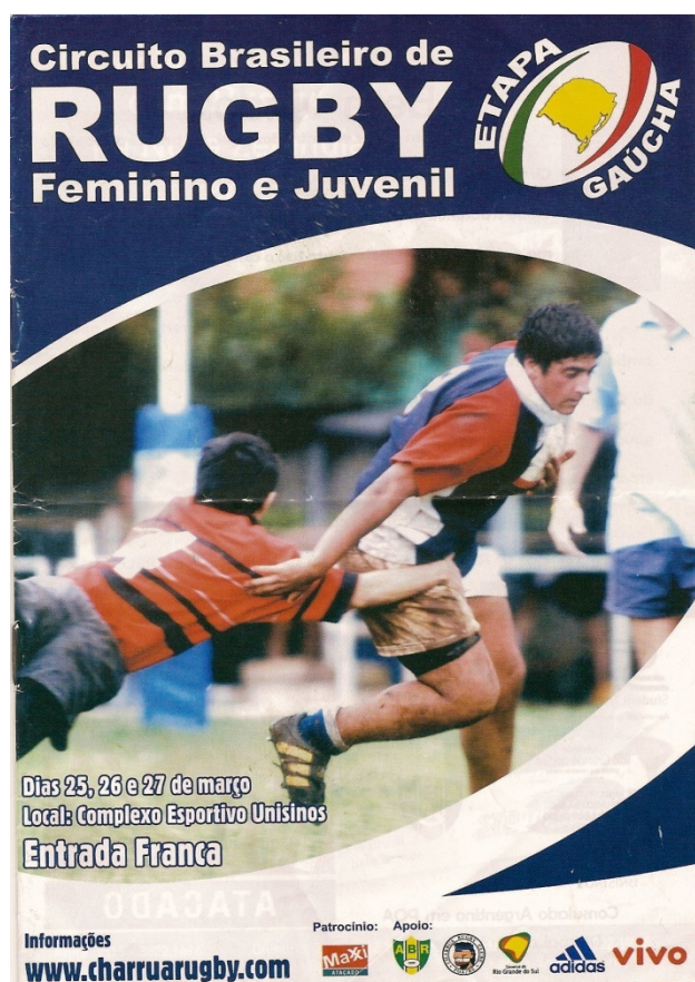
Imagem 1 – Folder do Circuito Brasileiro de Rugby

Através do conteúdo do folder , pude ainda constatar a existência de um endereço online deste clube, uma espécie de sede virtual 32 , já que o mesmo não dispunha de um endereço físico para tanto, apenas treinava nos campos da ESEF. Numa breve busca no site , pude obter mais informações sobre o clube e o esporte, regras, histórico, e aquilo que me interessava naquele momento: dias e horários de treinos.