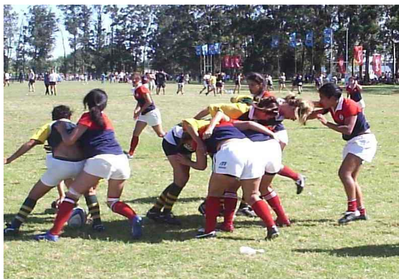
Imagem 3 – Charrua Feminino em partida do campeonato Valentin Martinez 2007