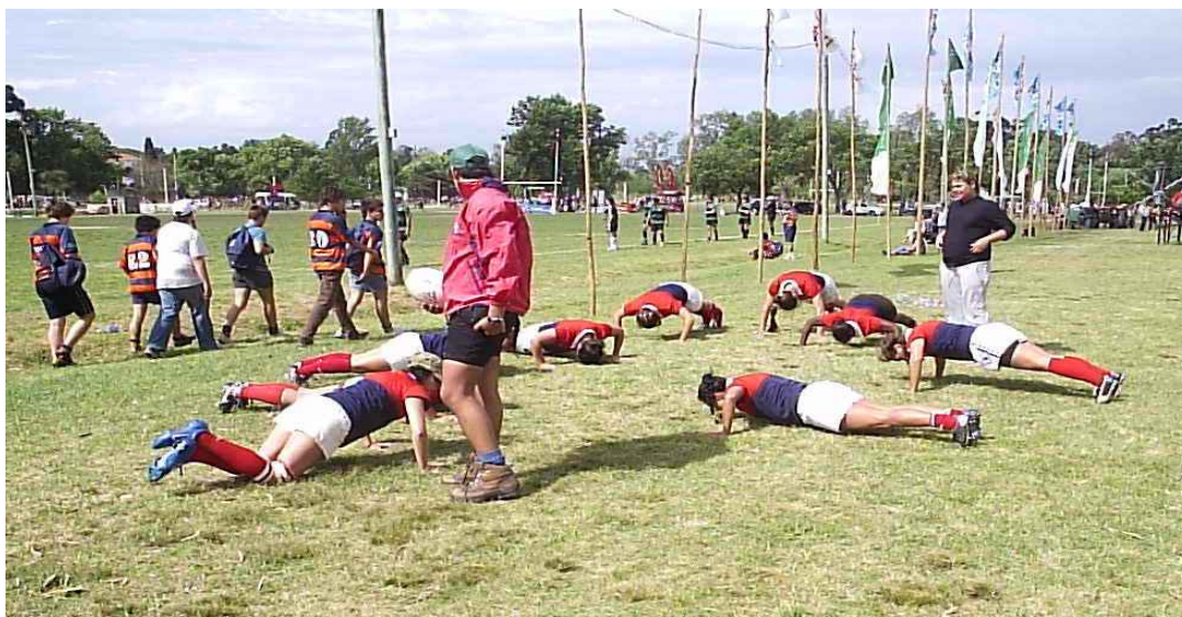
Imagem 4 – Charrua feminino realizando aquecimento antes das partidas - 2007

ser submetido, que pode ser utilizado, que pode ser transformado e aperfeiçoado (1989, p.126)”.